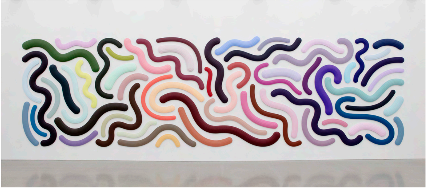
Summertime A, B, C, D, E, 2019. Acrylic on canvas. Dimensions variable.