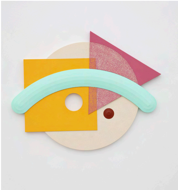
Peeping Tom, 2019. Acrylic on canvas, acrylic on panel. 84 x 106 cm

20th Century. One only has to look at The Jetsons—with its aping of space age and Googie architecture—to see subtle echos of retrofuturist forms and colors visible in Sperling's work.