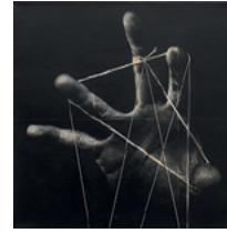
Between Heart and Brain 2018 57,4 x 57,4 cm oil, acrylic and monoprint on linen