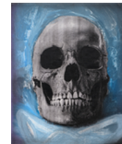
A Large Smile (Self-portrait) 2019 32,5 x 27,2 cm oil, acrylic and monoprint on linen