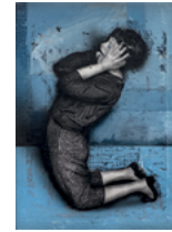
Girl Power 2019 34,5 x 25,5 cm oil, acrylic and monoprint on linen