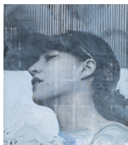
Grace 2018 - 2019 160,1 x 140,4 cm oil, acrylic and monoprint on linen