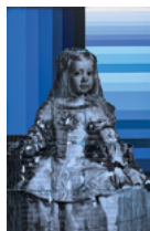
Strange Fruit (final series - 2) 2019 145,2 x 92,4 cm oil, acrylic and monoprint on linen