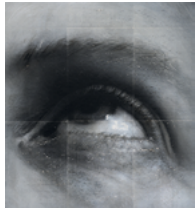
Stargazing 2019 65,4 x 60,4 cm oil, acrylic and monoprint on linen