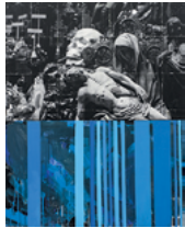
Bazaar (2) 2018 - 2019 182,2 x 143,4 cm oil, acrylic and monoprint on linen