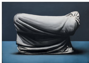
Study for Medusa (3) 2019 82,5 x 114,5 cm oil, acrylic and monoprint on linen