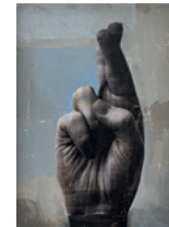
Protection 2019 34,4 x 25,2 cm oil, acrylic and monoprint on linen