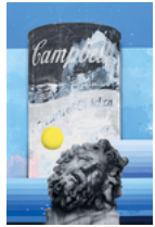
Trans-Atlantic Still Life 2019 175,3 x 115,4 cm oil, acrylic and monoprint on linen