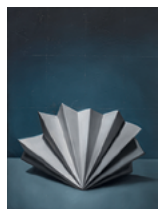
Study for Medusa (1) 2019 114,4 x 82,3 cm oil, acrylic and monoprint on linen