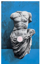
Sublime 2018 192 x 117,7 cm oil, acrylic and monoprint on linen