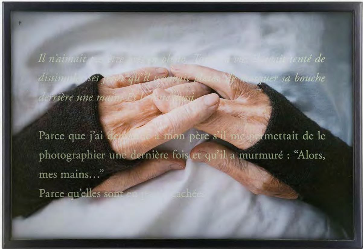
Mes Mains, 2018. Digital photograph. 27 x 42 cm | 10 5/8 x 16 ©Sophie Calle / ADAGP, Paris & JASPAR, Tokyo, 2019.