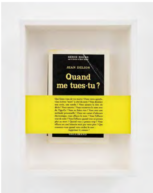
Quand me tues-tu ?, 2017 Book, silkscreen glass, framing 28.5 x 21.5 x 7.5 cm / 11 1/4 x 8 7/16 x 2 15/16 in ©Sophie Calle / ADAGP, Paris & JASPAR, Tokyo, 2019.

sayable. As Christine Macel explains, who curated her exhibition at the Centre Pompidou, Musée National d'Art Moderne, 'for [Sophie Calle] art is above all a matter of words. It is what cannot be seen, but what can be said, photography serving to show what cannot be said.' 1