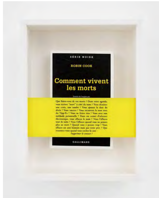
Comment vivent les morts, 2017 Book, silkscreen glass, framing 28.5 x 21.5 x 7.5 cm / 11 1/4 x 8 7/16 x 2 15/16 in ©Sophie Calle / ADAGP, Paris & JASPAR, Tokyo, 2019.

Sophie Calle is familiar with authorial games, collaborating occasionally with writers (Paul Auster, Doubles-jeux ) and artists (Greg Shephard, No Sex Last Night ), among others. Here Sophie Calle stretches even further the notion of author in order to share a mourning and the celebration of a loved one.