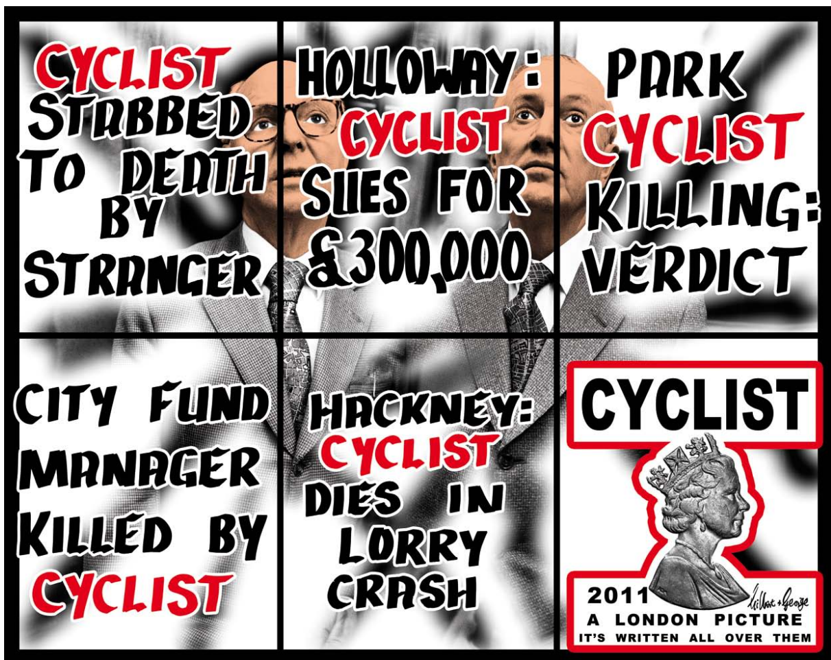
Cyclist , 2011 (mixed media)

Opening on Saturday April 14th, with the artists present, from 6pm to 8:30pm