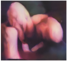
Untitled (3 legs) 2018 69 x 75,5 cm oil on canvas