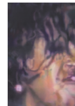
Untitled (woman scream shadow) 2018 57,2 x 40,2 cm oil on canvas