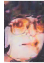
Untitled (woman with glasses) 2018 53,5 x 37,5 cm oil on canvas