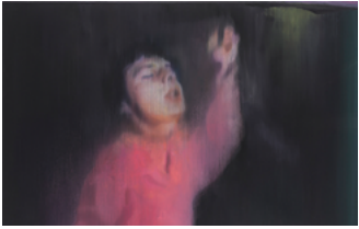
Untitled (man closed eyes 1) 2017 66,4 x 107,5 cm oil on canvas