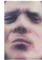
Untitled (man looking at me) 2018 48,2 x 34,2 cm oil on canvas