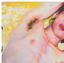
Untitled (man with yellow and white flowers) 2018 62,4 x 62,4 cm oil on canvas