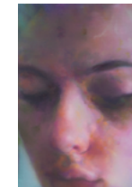
Untitled (long head) 2018 54,2 x 35,2 cm oil on canvas