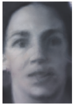
Untitled (woman looking at me) 2018 54,4 x 37,4 cm oil on canvas