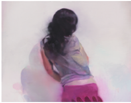
Untitled (dancing 2) 2018 99,5 x 126,4 cm oil on canvas