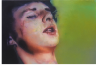
Untitled (man closed eyes 2) 2017 57,5 x 84,4 cm oil on canvas