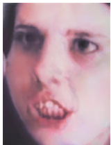
Untitled (angry woman) 2018 46 x 35 cm oil on canvas