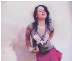
Untitled (dancing 1) 2018 100,3 x 116,2 cm oil on canvas