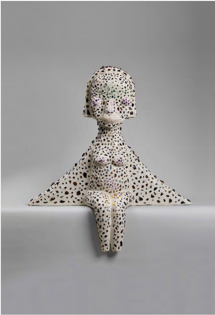
Untitled , 2018. Obsidian, stone, silicon, FRP, coating. 90 × 85 × 30 cm | 35 7 / 16 × 33 7 / 16 × 11 13 / 16 in. Photo: Kei Okano. Courtesy the Artist and Perrotin. ©2018 Izumi Kato.