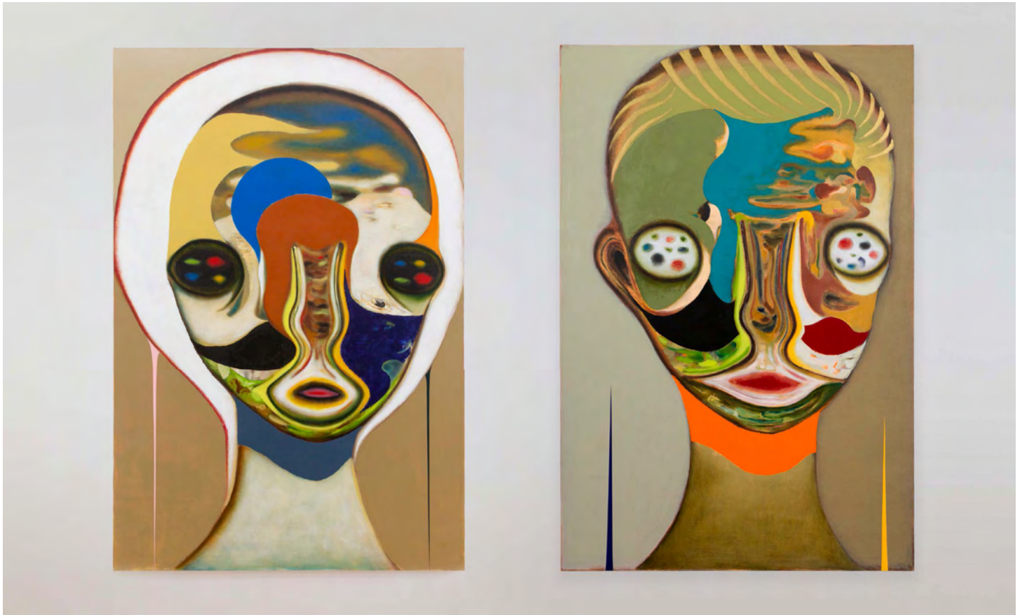
(Left) Untitled , 2018. Oil on canvas. 194 × 130.3 cm | 76 3/8 × 51 5/16 in. (Right) Untitled , 2018. Oil on canvas. 194 × 130.3 cm | 76 3/8 × 51 5/16 in. Photo: Ringo Cheung. Courtesy the Artist and Perrotin. ©2018 Izumi Kato.