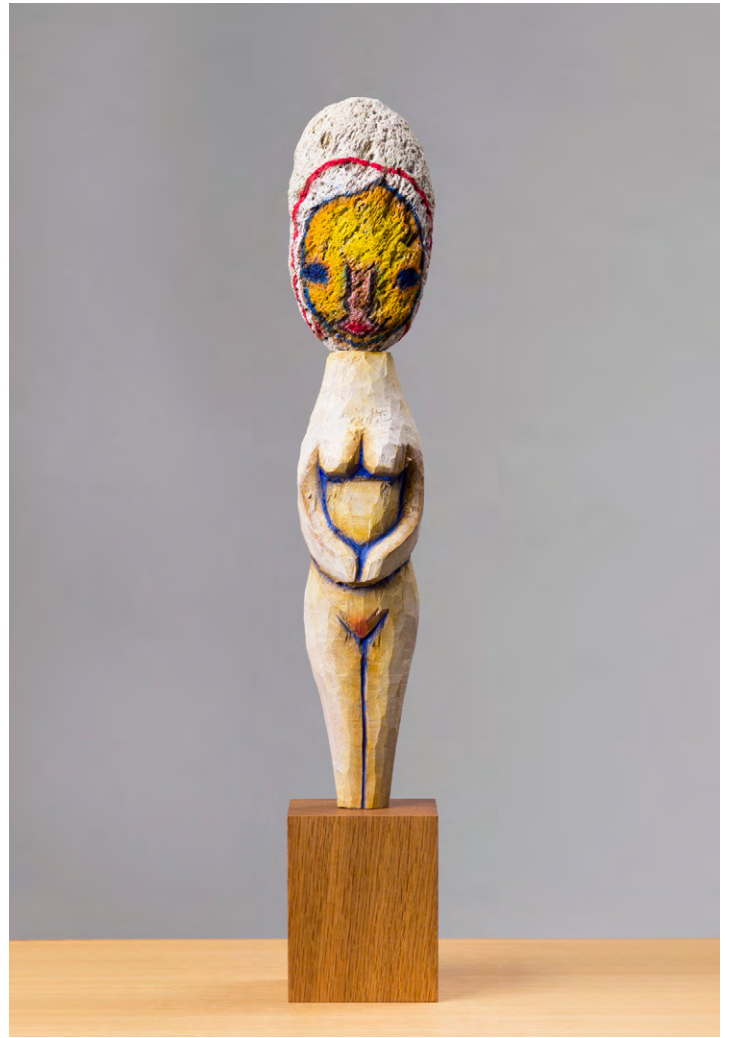
Untitled , 2018. Coral, wood, acrylic, stainless steel, wood pedestal. 48 × 8 × 8 cm | 18 7 / 8 × 3 1 / 8 × 3 1 / 8 in. Photo: Kei Okano. Courtesy the Artist and Perrotin. ©2018 Izumi Kato.

Kato's figures lead us away from preconceived notions of contemporary sculpture and painting, while bringing us back to the belief of art as ritual, bound with the power of primitive imagery, born of the need for communication with each element building upon the next. Similarly, Kato's visual language abounds with references to communication, incorporating the myths and folklore that populate his native Shimane prefecture, a coastal region in western Japan. At the heart of his practice is the Shinto belief that everything – even objects like rocks and wood – contains a spirit.