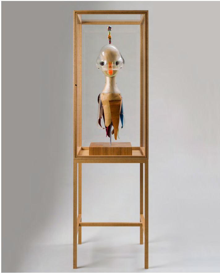
Untitled, 2018. Soft vinyl, acrylic, leather, wood, iron, string; wood and plexiglass display case 173 x 50 x 50 cm | 68 1/8 x 19 11/16 x 19 11/16 in.