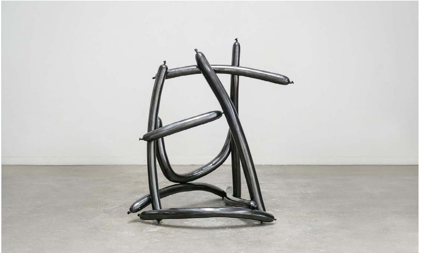
Inadequate (EVERY, DAY, ACTS, LIKE, LIFE) - LIKE, 2016. Cast bronze. 119 × 92 × 99 cm | 46 7/8 × 36 1/4 × 39 1/3 in.