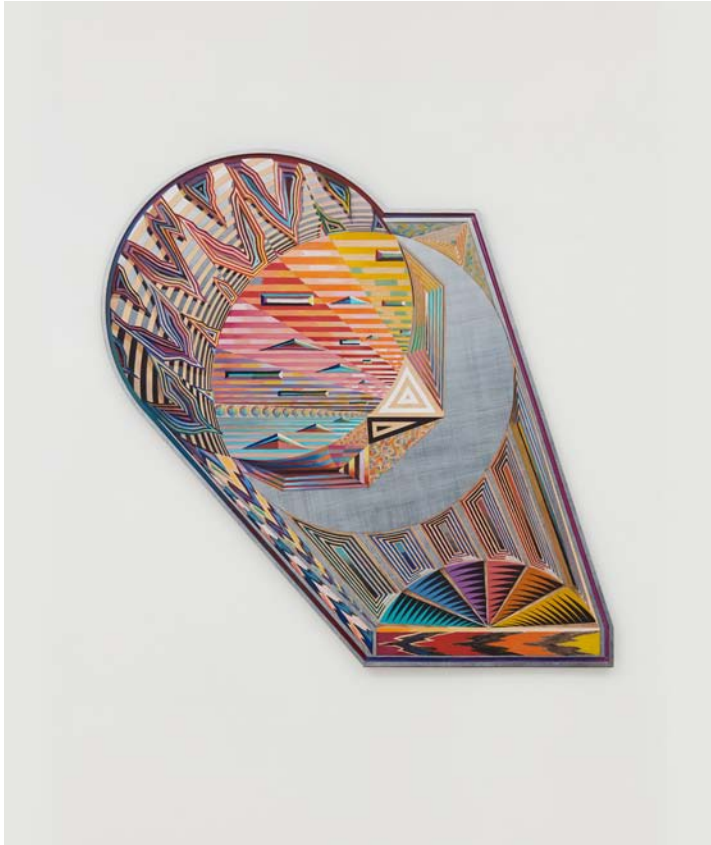
Zach HARRIS, Eclipse Eye , 2018. Carved wood, water-based paint, ink. 99.1 x 91.4 cm | 39 x 36 in.