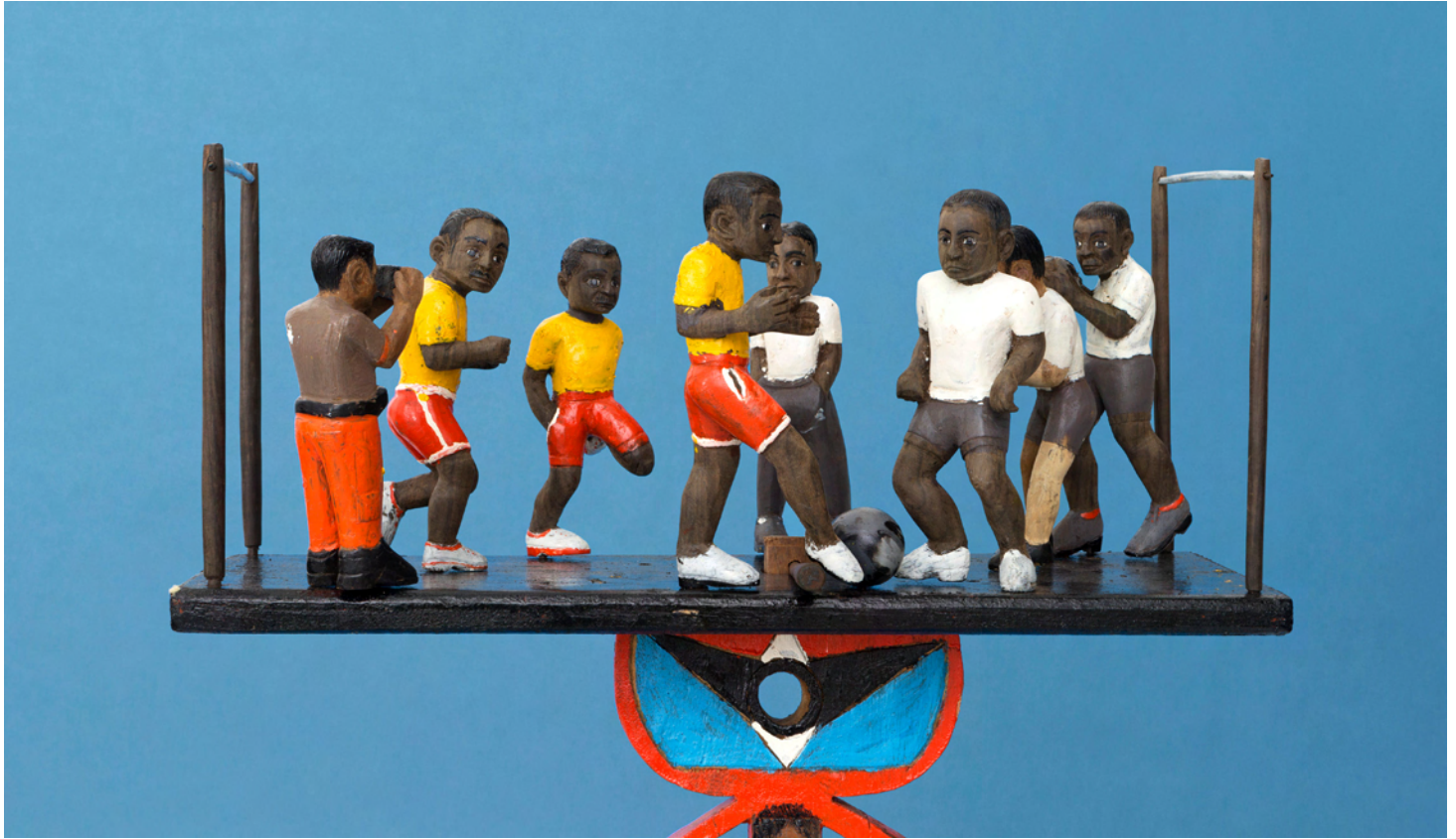
Jean Terry, Soccer Team (Mpanao baolina kitma) , 2012. Mendorave wood, paint. 226 x 53 x 28 cm | 89 x 20 7/8 x 11 1/16 in.