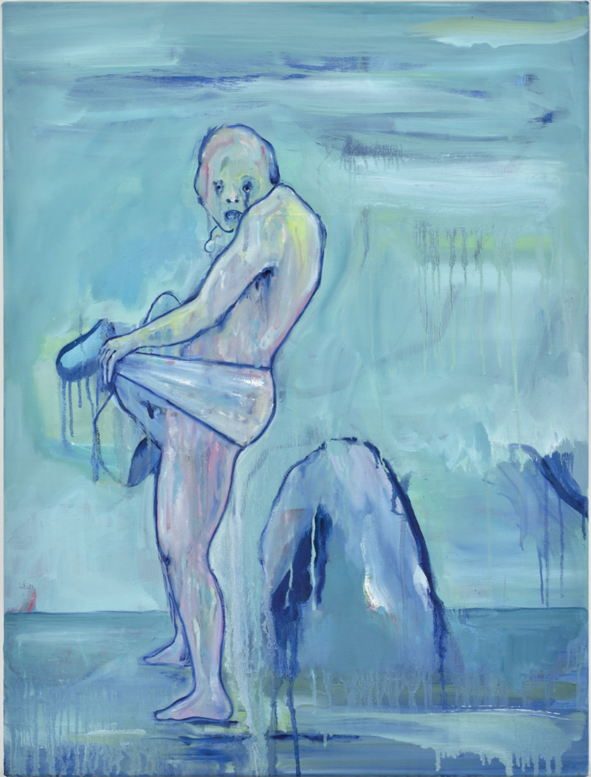
Vincent Gicquel, Roc , 2018 Huile sur toile. 80 x 60 cm