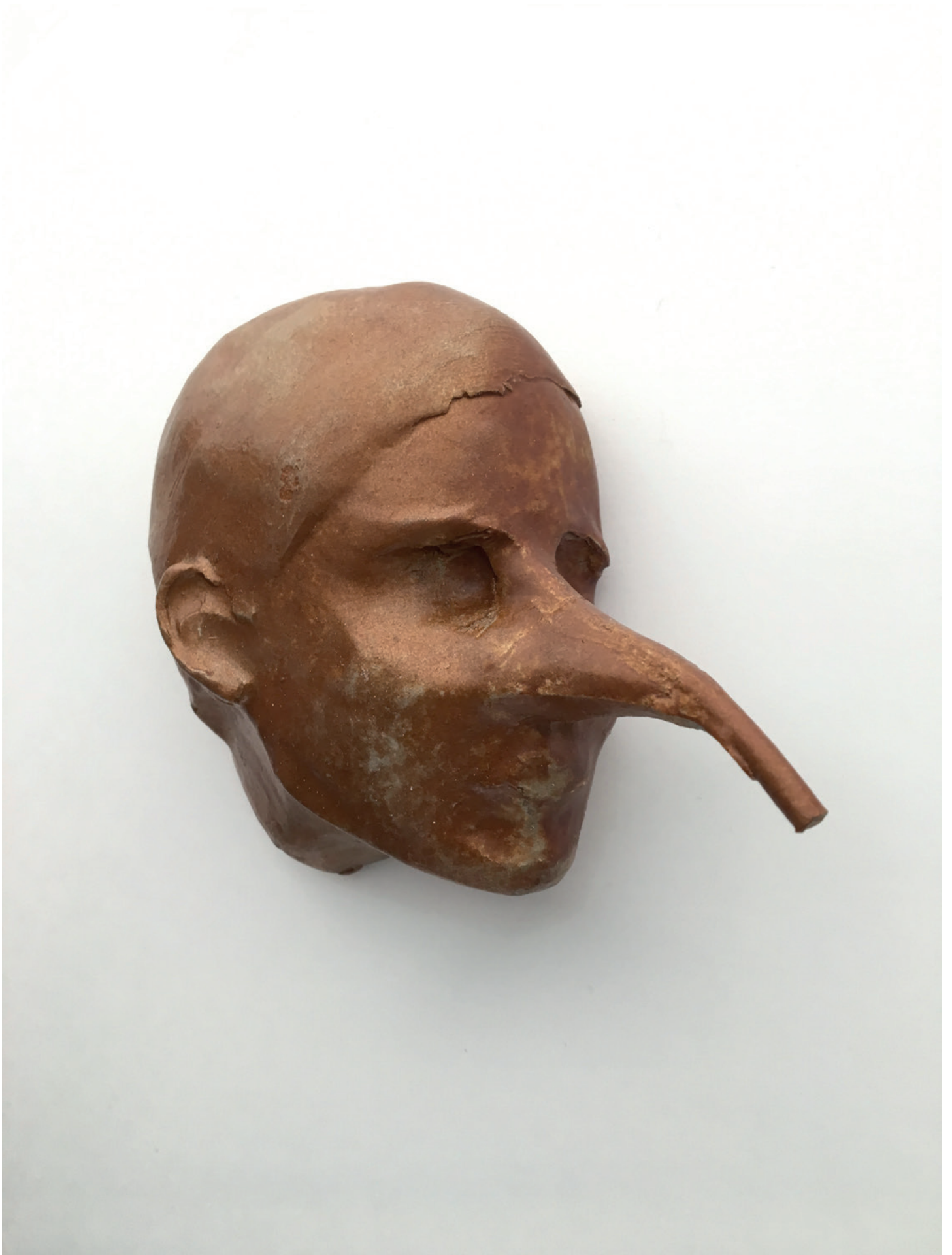
Florian Sumi, Sans titre , 2018. Travail en cours. Dimensions variables Unique