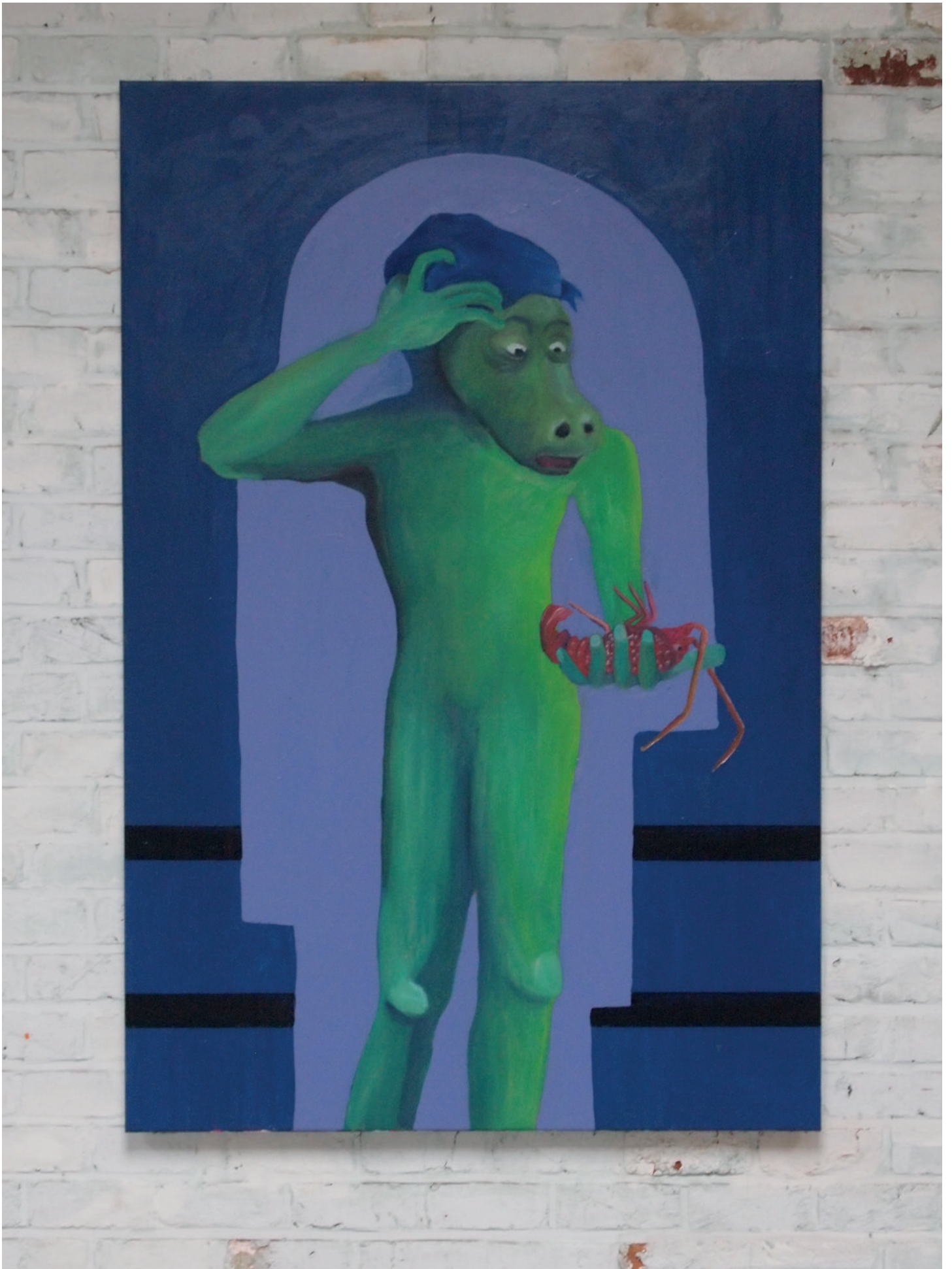
Diego Wery, Symétrie de l'origine , 2018 Huile sur toile 160 x 100cm. Unique