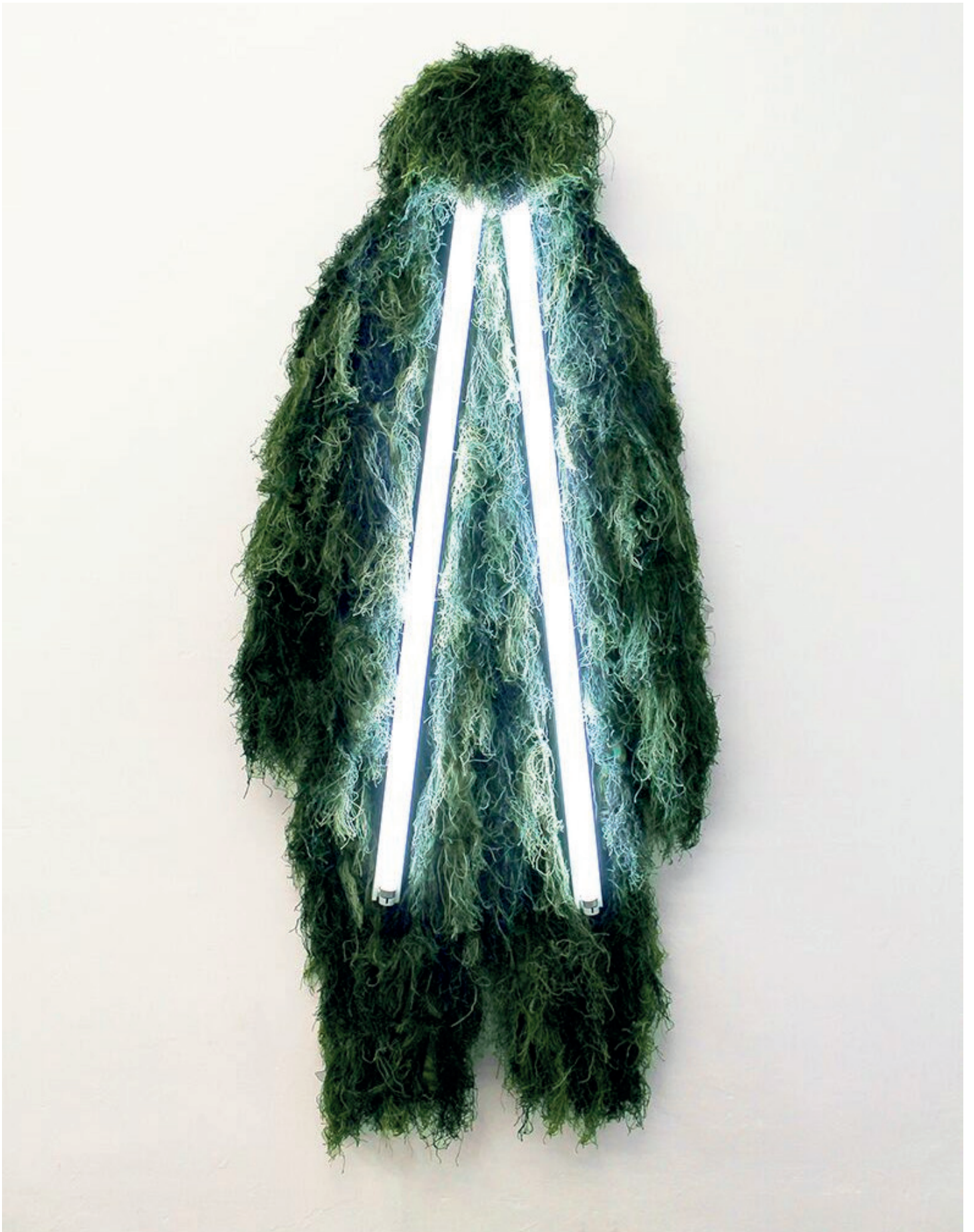
Pierre Clément, Longue range , 2014 Tenue de camouflage sniper Ghillie, tubes fluorescents 220 x 90 cm. 2E + 1E