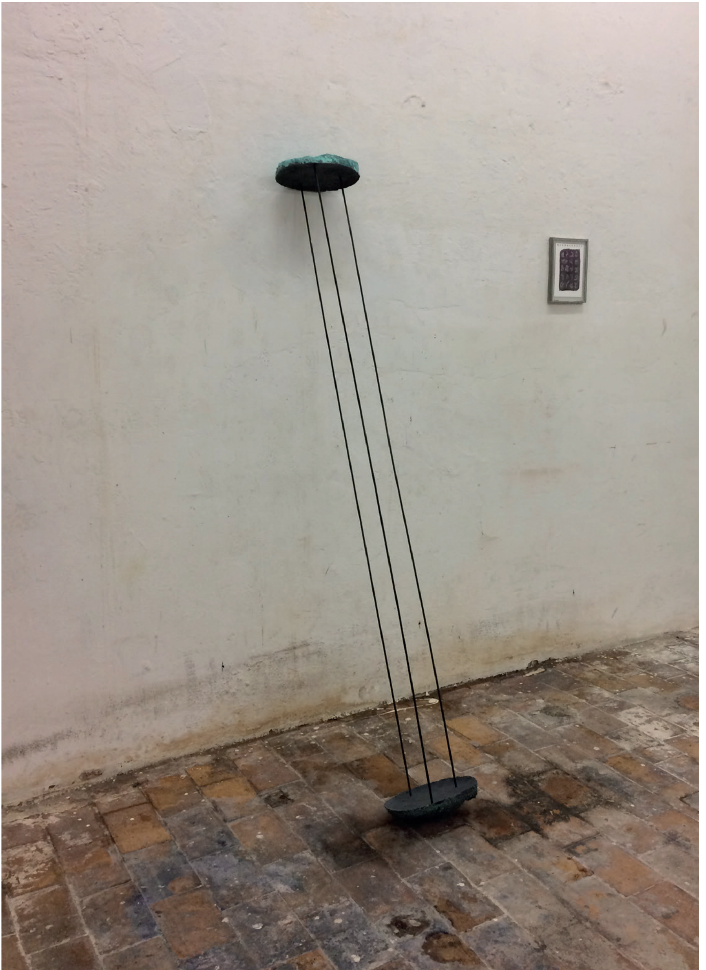
David de Tschärner, Sculpture Relative : Masques , 2018 Polyuréthane, sable, pigment, acier 209 x 29 x 22 cm. Unique