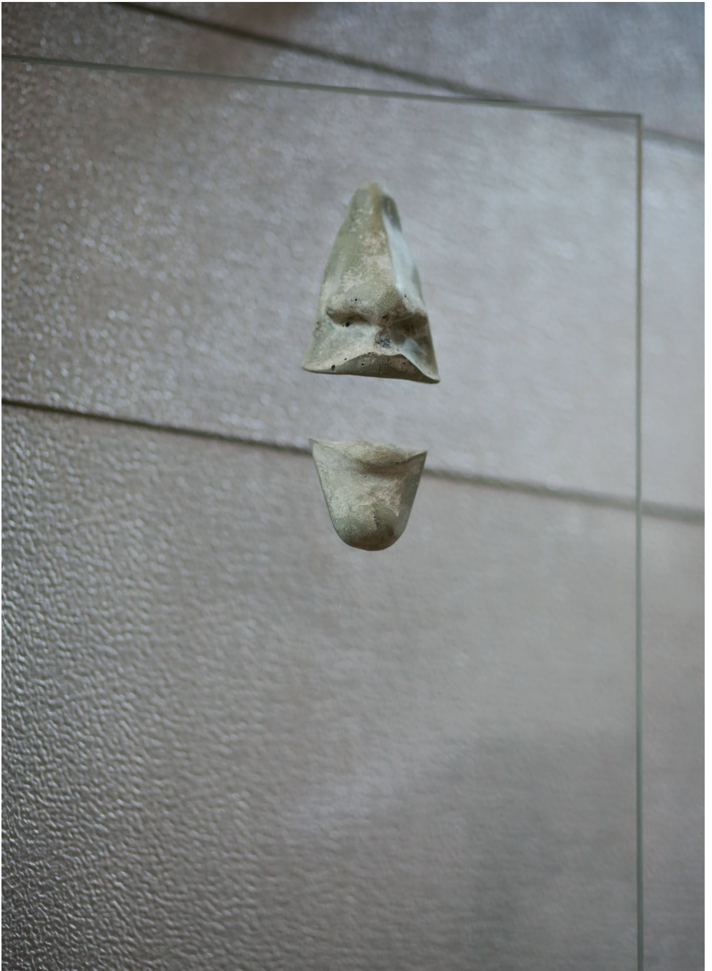
Laura Gozlan, Hollowism , 2018 Dimensions variables