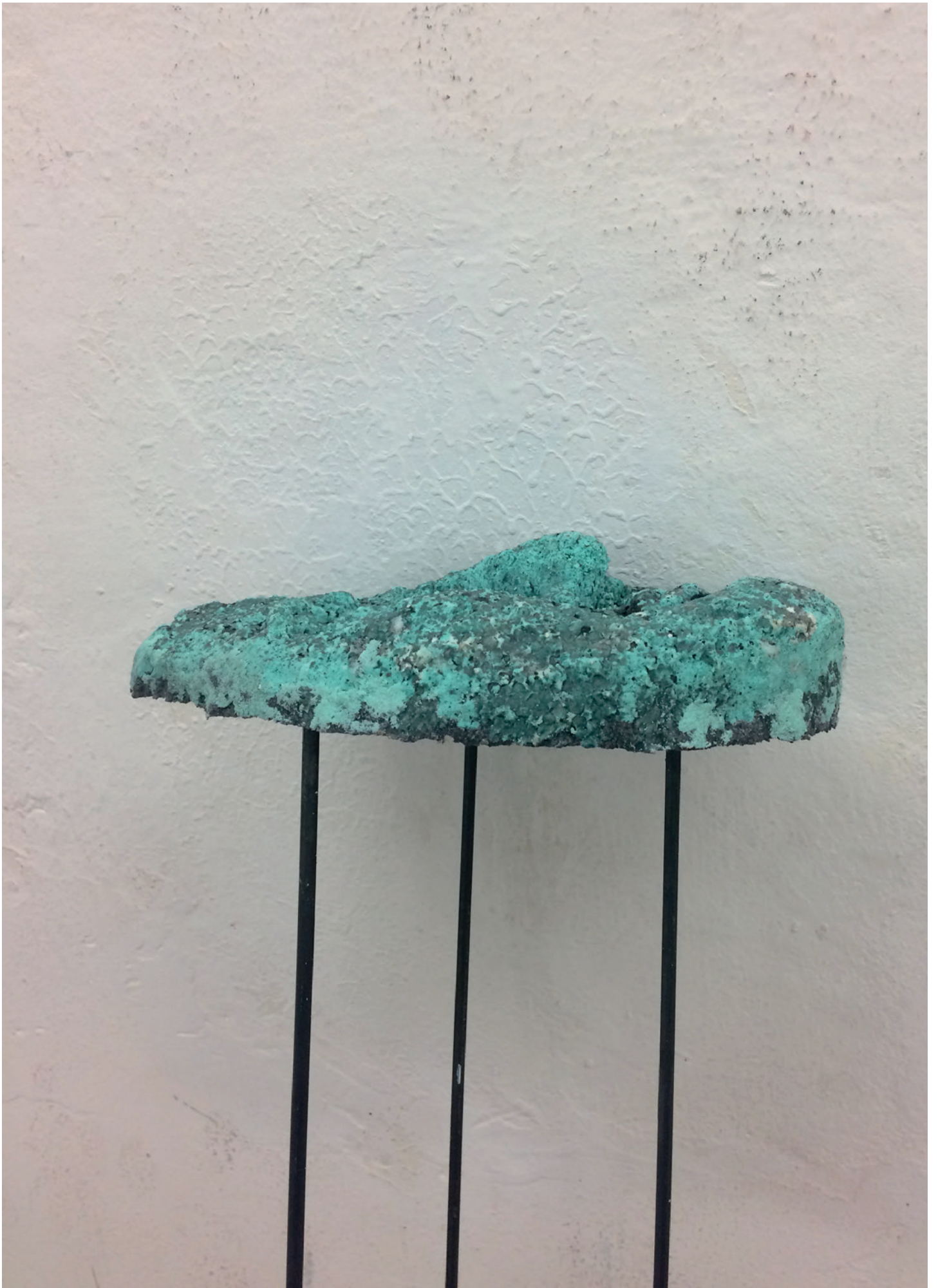
David de Tscharnier, Sculpture Relative : Masques , 2018. Détail Polyuréthane, sable, pigment, acier 209 x 29 x 22 cm. Unique