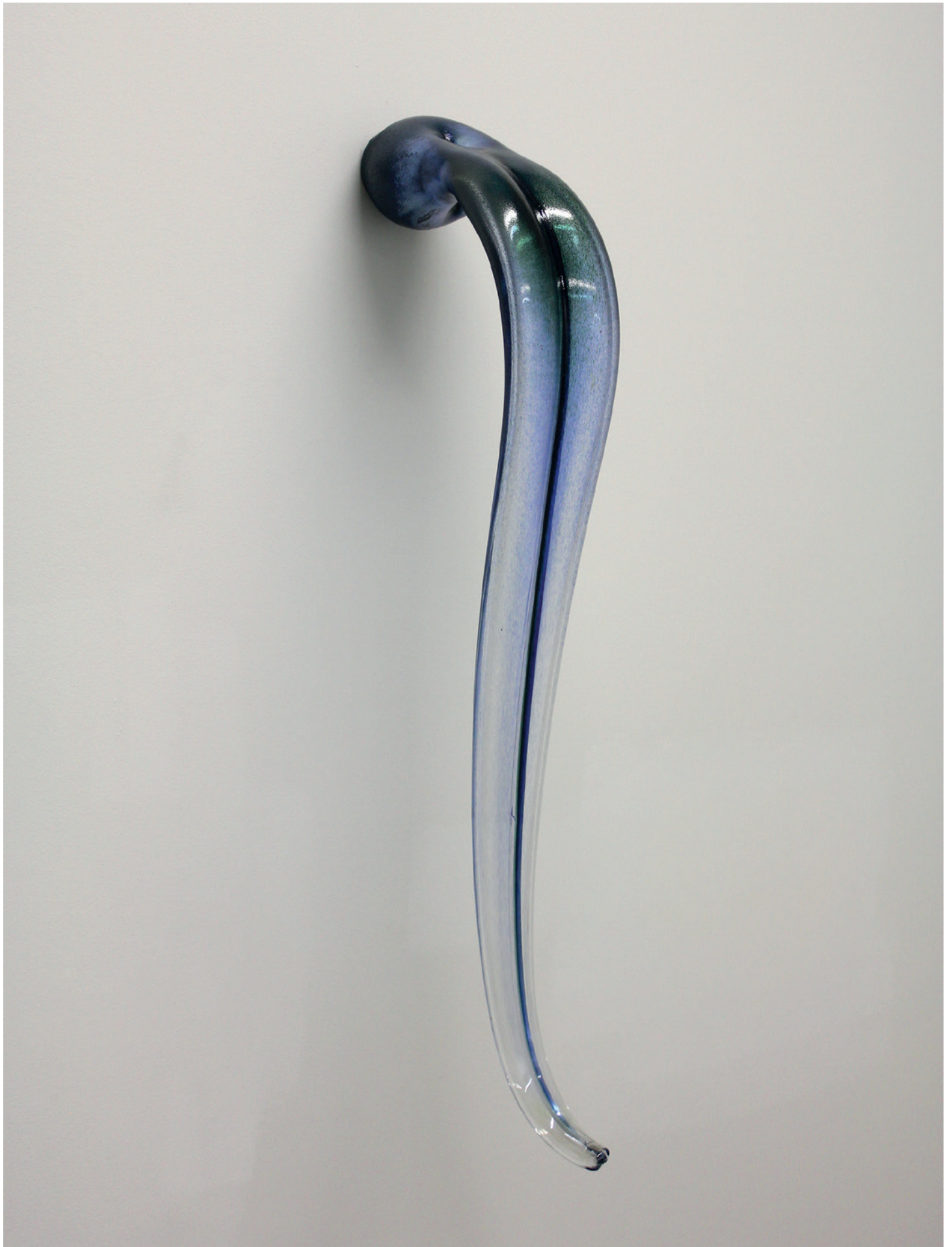
Pia Rondé et Fabien Saleil, Langue #2 , 2017 Verre soufflé, inox 100 x 15 cm. Unique Production Centre d'art DrawingLab, Paris.