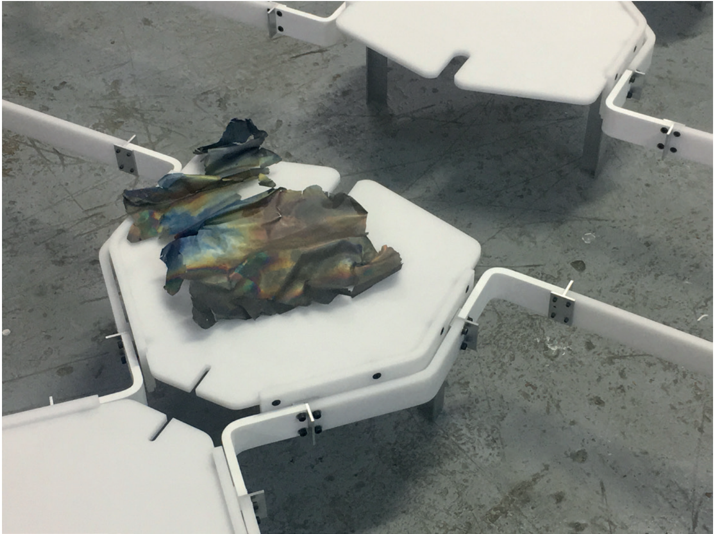
Andrés Ramirez, I wrap my last kiss in a bandage , 2018. Détail Perspex, aluminium, maille titane Dimensions variables Unique