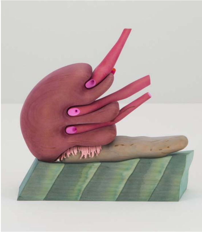
Move, Swallow, Breathe , 2017. Bois de tilleul, colorant, gouache, flocage, acier, plastique, polycarbonate. 28.6 × 30.5 × 10.15 cm | 11 1/4 × 12 × 4 in.