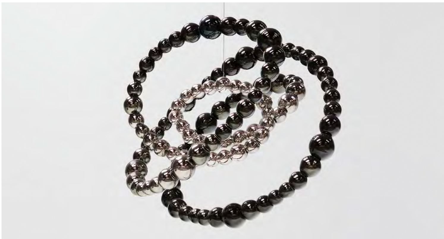
Black Lotus , 2015. Verre miroité, inox. 130 × 150 × 100 cm / 51 3/16 × 59 1/16 × 39 3/8 in. © Othoniel / ADAGP Paris, 2018.