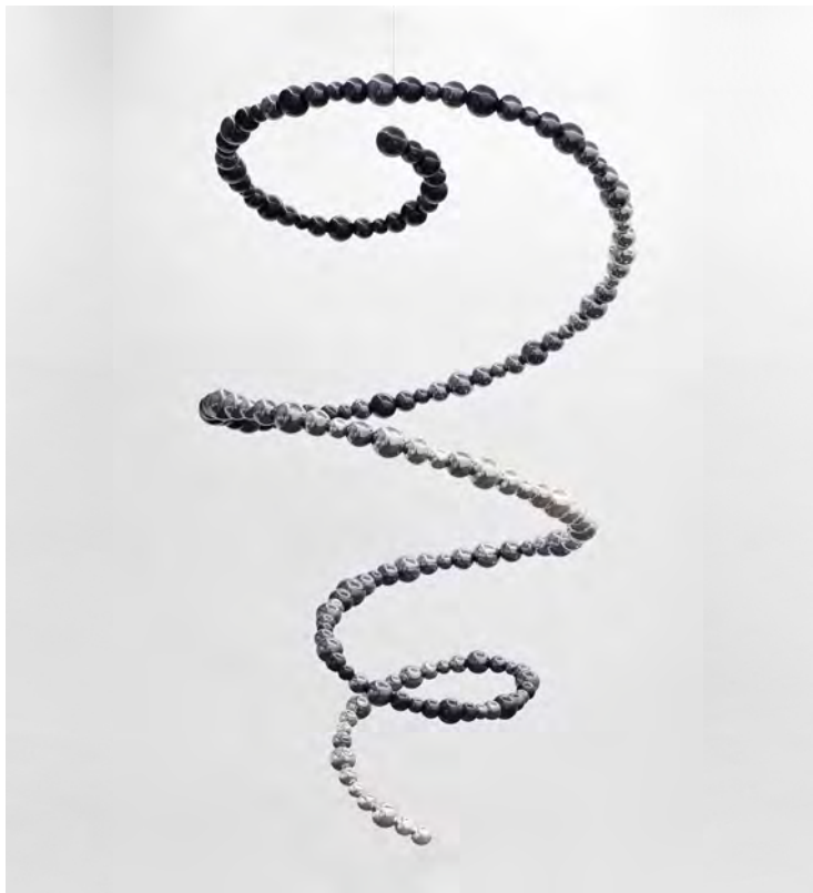
Tornado , 2017

Perles en aluminium, peinture chrome, acier. 450 x 260 x 250cm / 177 3/16 x 102 3/8 x 98 7/16 in © Othoniel / ADAGP Paris, 2018.