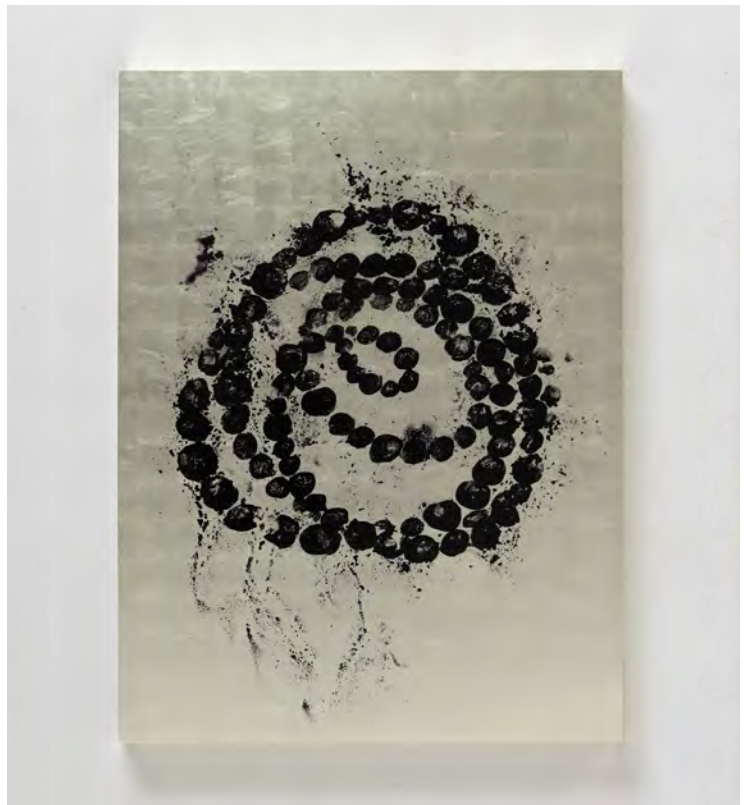
The Knot of Shame , 2016. Peinture sur toile, encre sur feuille d'or blanc 140 x 105 x 5.5 cm / 55 1/8 x 41 5/16 x 2 3/16 in.

Perles en aluminium, peinture chrome, acier. 450 x 260 x 250cm / 177 3/16 x 102 3/8 x 98 7/16 in © Othoniel / ADAGP Paris, 2018.