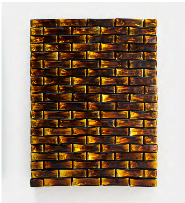
Precious Stonewall , 2014 Briques en verre indien ambre miroité. 131 × 99 × 23 / 51 9/16 × 39 × 9 1/16 in © Othoniel / ADAGP Paris, 2018.