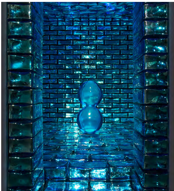
Grotta Azzurra , 2017 Briques en verre indien bleu miroité, acier, fontaine. 180 × 201 × 205 cm / 70 7/8 × 79 1/8 × 80 11/16 in © Othoniel / ADAGP Paris, 2018.