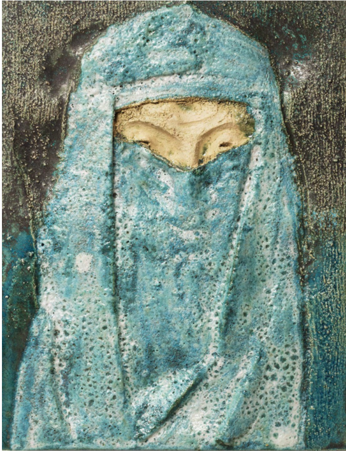
Aus dem Serail, 2016-2017. Wall sculpture, Blister glaze on modelled glazed stoneware, high-fired 89 × 67.5 × 8 cm / 35 × 26 5/8 × 3 1/8 in.