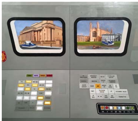
Andrew Lewis, Sir Christopher Cam Cams , 2017 huile sur toile, 108,8 x 121,3 cm oil on canvas, 42 7/8 x 47 3/4 in.