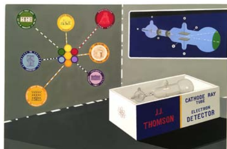
Andrew Lewis, V.A.B (Victoria & Albert Building) , 2017 huile sur toile, 90,6 x 112 cm oil on canvas, 35 5/8 x 44 1/8 in.