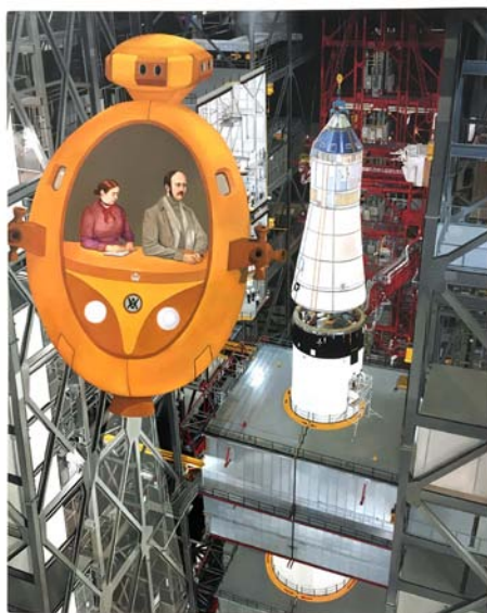
Andrew Lewis, V.A.B (Victoria & Albert Building) , 2017 huile sur toile, 112 x 90,6 cm oil on canvas, 44 1/8 x 35 5/8 in.

Ces images sont destinées uniquement à la promotion de l'exposition Andrew Lewis : Vers une boîte éclairée / Crystal Palace Transmissions présentée à la galerie Art:Concept, Paris du 24 novembre 2017 au 13 janvier 2018. Elles ne peuvent être recadrées ou modifiées. Merci de bien mentionner les crédits suivants : courtesy de l'artiste et Art:Concept, Paris