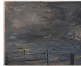
Rio de Janeiro 2016 24 x 30 cm acrylic on canvas