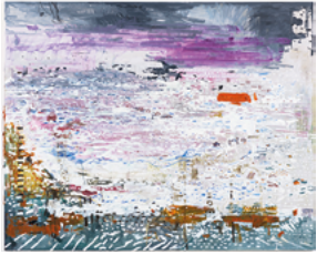
Xilofone 2017 200 x 250 cm oil on canvas