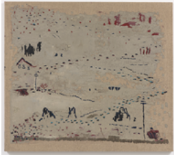
AB 2017 80 x 90 cm oil on canvas