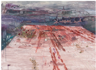
Lelove 2017 170 x 210 cm oil on canvas