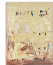
Pelego 2017 80 x 60 cm oil on canvas