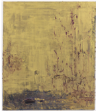
Silkworm 2017 130 x 110 cm oil on canvas