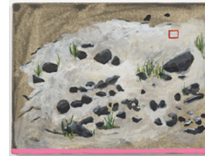
P 2015 18 x 24 cm acrylic on canvas