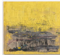
Precipitação 2017 80 x 90 cm oil on canvas