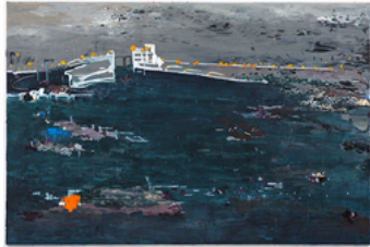
Radio pirata 2017 200 x 300 cm oil on canvas