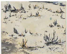
Serra das confusões 2015 24 x 30 cm acrylic on canvas