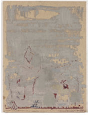
Balão 2017 80 x 60 cm oil on canvas