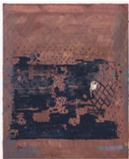
Galope 2017 160 x 130 cm oil on canvas