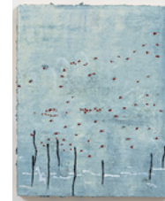
Arapuca 2017 25,5 x 20,5 cm oil on wood