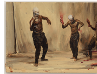
Fugazy 2017 21 x 28 cm oil on wooden panel