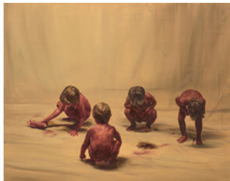
Fire from the Sun (Four Figures) 2017 174 x 220 cm oil on canvas