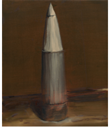
Missile 2017 43,2 x 36 cm oil on canvas