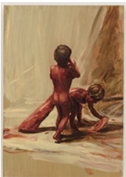
Fire From The Sun 2017 21 x 14,5 cm oil on cardboard