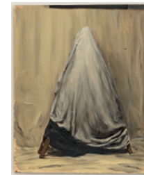
Mercy 2017 41,5 x 33,8 cm oil on cardboard