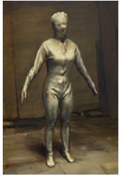
Poppy 2016 240 x 160 cm oil on canvas