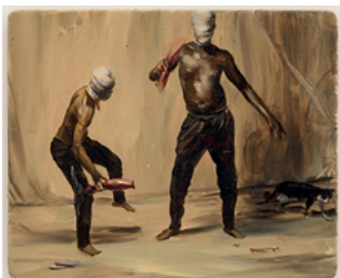
Wick-Wack 2017 21 x 25,7 cm oil on wooden panel