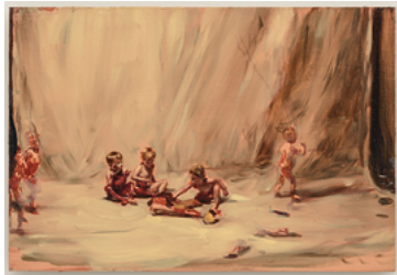
Fire From The Sun 2017 26,1 x 38 cm oil on wooden panel