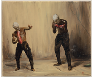
Rah-Rah 2017 17,5 x 20,8 cm oil on wooden panel