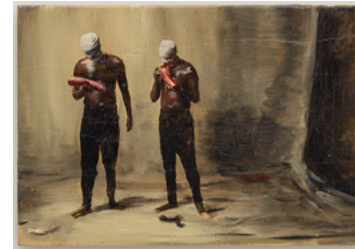
Phat 2017 22 x 32 cm oil on wooden panel