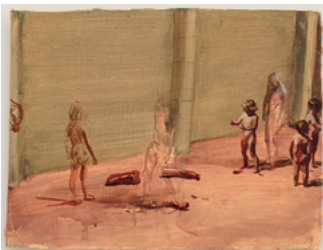
Fire From The Sun 2017 19,9 x 26 cm oil on wooden panel