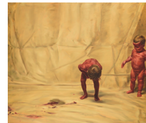
Fire from the Sun 2017 200 x 240 cm oil on canvas