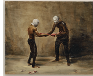
Buggin 2017 24,1 x 29,8 cm oil on wooden panel