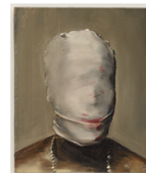
Melon 2017 24,3 x 20,9 cm oil on cardboard