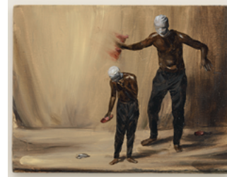
Static 2017 25,1 x 33 cm oil on wooden panel