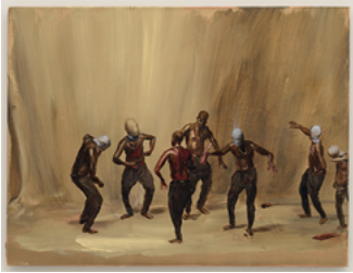
On the Grind 2017 27 x 35,6 cm oil on wooden panel