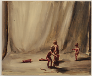
Fire From The Sun 2017 23,8 x 23,5 cm oil on wooden panel