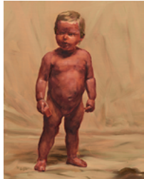
Fire from the Sun 2017 82 x 65 cm oil on canvas