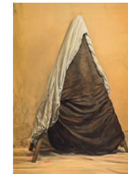
Mercy 2017 280 x 205 cm oil on canvas