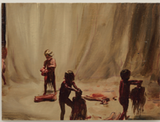
Fire From The Sun 2017 21,5 x 29,4 cm oil on wooden panel