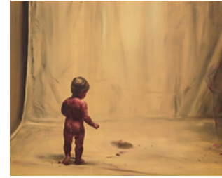
Fire from the Sun 2017 174 x 220 cm oil on canvas