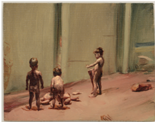
Fire From The Sun 2017 19 x 24 cm oil on wooden panel