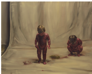
Fire from the Sun 2017 120 x 150 cm oil on canvas