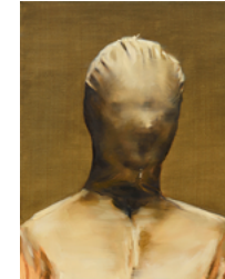
Becky 2017 82 x 65 cm oil on canvas