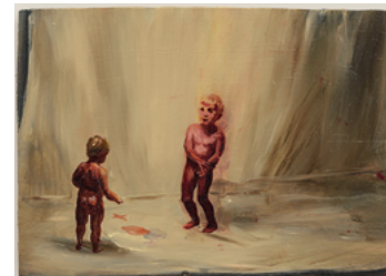
Fire From The Sun 2017 21,7 x 31 cm oil on wooden panel