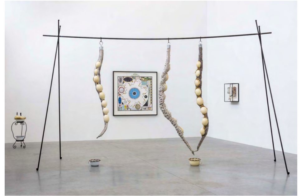
Les Loques de Chagrin . Fabularum (La Vie d'Esopé) 2009 219 x 310 x 445 cm mixed media