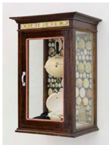
The Cosmogonic Indigestion (The Greedy Snake - Piggy Bank I) 2017 67,5 x 34,5 x 45 cm mixed media