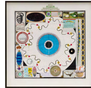
Collage for The Cosmogonic Indigestion (The Greedy Snake I) 2016 123,8 x 119,2 cm mixed media