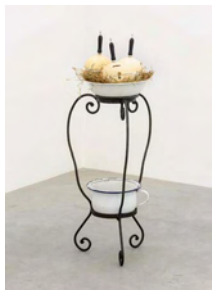
The Cosmogonic Indigestion (The Greedy Snake - Piggy Bank II) 2017 101 x 40 x 40 cm mixed media