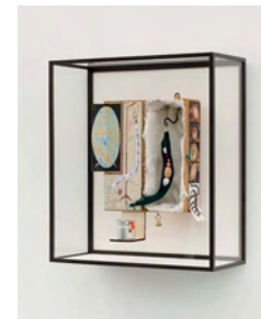
Maquette for The Cosmogonic Indigestion (The Greedy Snake I) 2016 55 x 49,5 x 22,5 cm mixed media