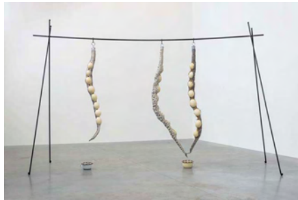
The Cosmogonic Indigestion (The Greedy Snakes) 2016 - 2017 295 x 468 x 153 cm mixed media