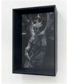
L'Hêtre à l'Image (été 2011) 2011 94 x 74 x 15 cm pencil and paint on paper