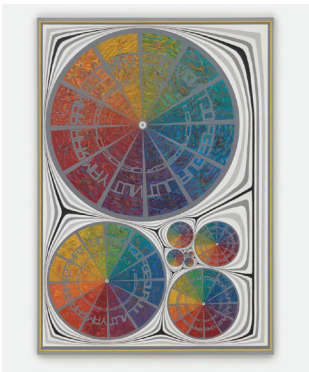
Study for 20/20 2016-17 Bois sculpté, peinture à l'eau, encre Carved wood, water-based paint, ink 172,7 × 120,7 cm / 68 × 47 1/2 in