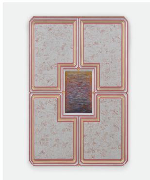
Silver Sky 2014-17 Bois sculpté, peinture à l'eau, encre Carved wood, water-based paint, ink 91,4 × 61 cm / 36 × 24 in