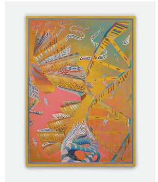
Double Helix (in 2020) 2015-17 Bois sculpté, peinture à l'eau, encre Carved wood, water-based paint, ink 208,3 × 152,4 cm / 82 × 60 in