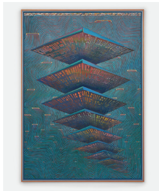
Calendar Cloud (in 2020) 2016-17 Bois sculpté, peinture à l'eau, encre Carved wood, water-based paint, ink 190,5 × 134,6 cm / 75 × 53 in