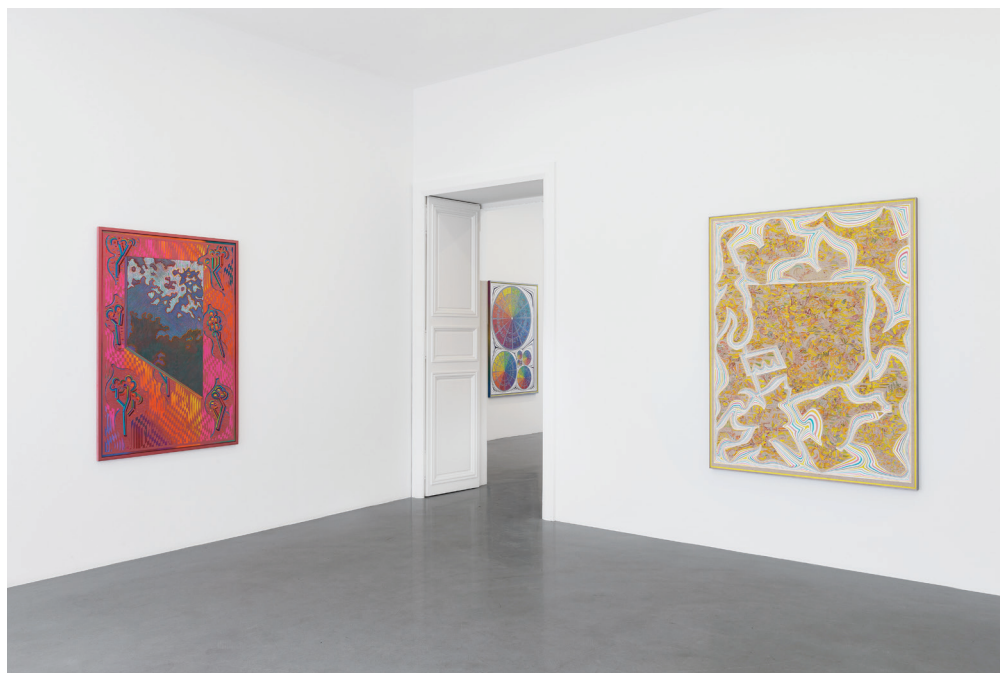
Vue de l'exposition / exhibition view

The artist's first comprehensive monograph is released on this occasion.