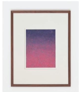
Purple Cloud 2016-17 Peinture, crayons de couleur et crayon de papier sur bois Paint, color pencil and pencil on wood 76,2 × 58,4 cm / 30 × 23 in