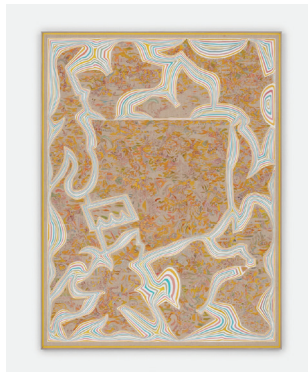
Linen Last Judgement (Yellow Prism) 2016-17 Bois sculpté, toile, peinture à l'eau, encre Carved wood, linen, water-based paint, ink 184,2 × 139,7 cm / 72 1/2 × 55 in