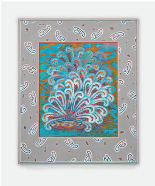
Cloud Kitty Arrival 2016-17 Bois sculpté, peinture à l'eau, encre Carved wood, water-based paint, ink 87 × 72,4 cm / 34 1/4 × 28 1/2 in