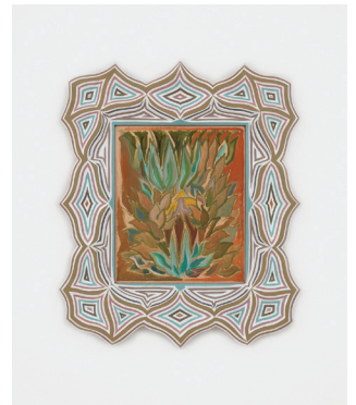
Small Succulent 2013-17 Bois sculpté, peinture à l'eau, encre Carved wood, water-based paint, ink 57,2 × 48,3 cm / 22 1/2 × 19 in