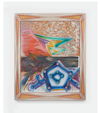
Pentagon Sky 2016-17 Bois sculpté, peinture à l'eau, encre Carved wood, water-based paint, ink 106 × 86,4 cm / 41 3/4 × 34 in