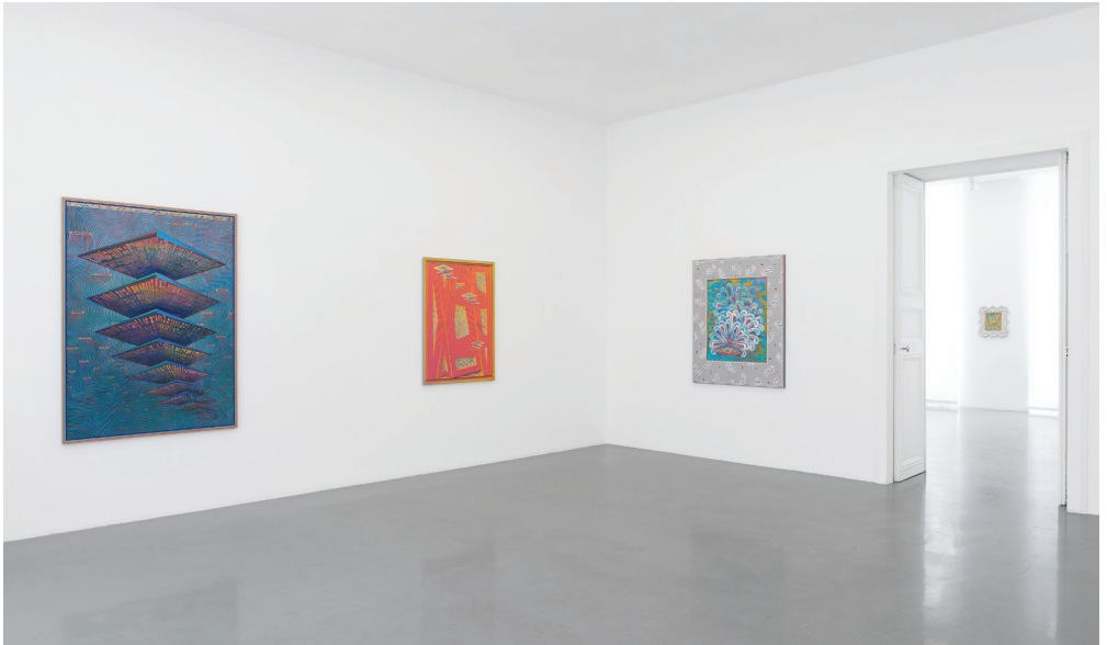
Vue de l'exposition / exhibition view

Des déesses ; et par d'idolâtres peintures, À leur ombre enlever encore des ceintures : Ainsi, quand des raisins j'ai sucé la clarté, Pour bannir un regret par ma feinte écarté, Rieur, j'élève au ciel d'été la grappe vide Et soufflant dans ses peaux lumineuses, avide D'ivresse, jusqu'au soir je regarde au travers.