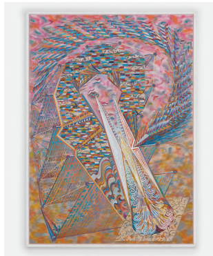
Sunrise Sunset (in 2020) 2015-17 Bois sculpté, peinture à l'eau, encre Carved wood, water-based paint, ink 219,7 × 158,8 cm / 86 1/2 × 62 1/2 in