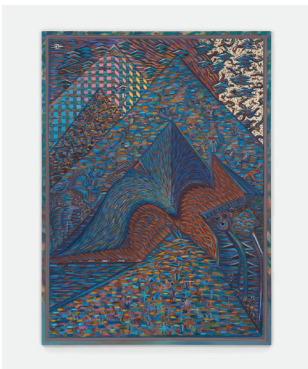
Water on Fire Bird 2015-17 Bois sculpté, peinture à l'eau, encre Carved wood, water-based paint, ink 208,3 × 152,4 cm / 82 × 60 in