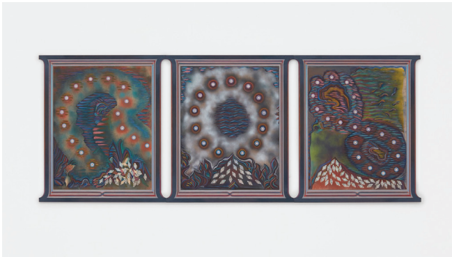
"N" "O" "8" 2013-17 Bois sculpté, peinture à l'eau, encre Carved wood, water-based paint, ink 91,4 × 236,2 cm / 36 × 93 in