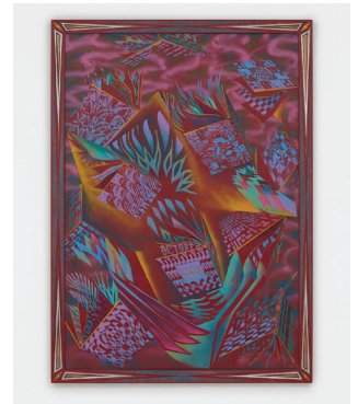
Twelve Months (for 2020) 2016-17 Bois sculpté, peinture à l'eau, encre Carved wood, water-based paint, ink 181,6 × 130,8 cm / 71 1/2 × 51 1/2 in