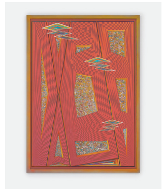
Sky Writing Wall 2016-17 Bois sculpté, toile, peinture à l'eau, encre Carved wood, linen, water-based paint, ink 125,7 × 88,9 cm / 49 1/2 × 35 3/4 in