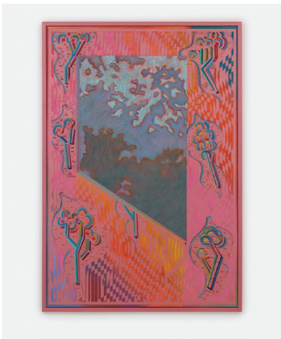
Glass Guillotine 2016-17 Bois sculpté, peinture à l'eau, encre Carved wood, water-based paint, ink 157,5 × 108 cm / 62 × 42 1/2 in