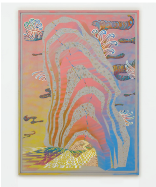
Philosopher Stone (in 2020) 2016-17 Bois sculpté, peinture à l'eau, encre Carved wood, water-based paint, ink 208,3 × 152,4 cm / 82 × 60 in