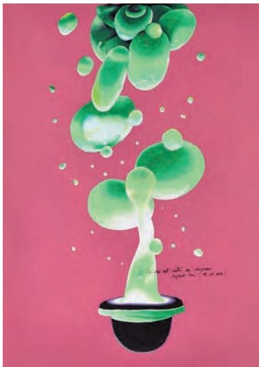
Ce qui est sorti du chapeau aujourd'hui