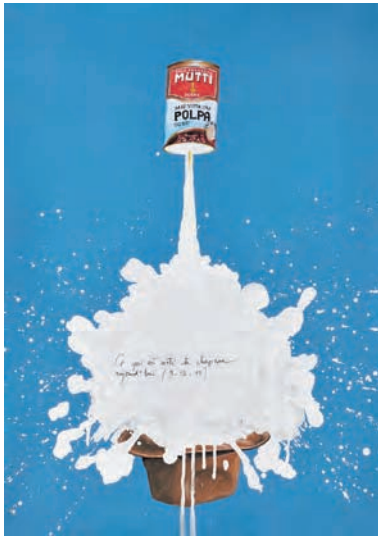
Ce qui est sorti du chapeau aujourd'hui

GALERIE Georges-Philippe & Nathalie Vallois