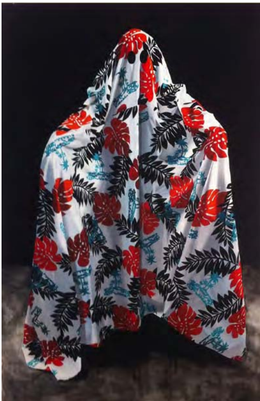
Hawaiian Ghost 3

Gilles Barbier : The hat is the head, and today a clock's frequency. As is often the case, the idea is to combine the power of doing with a freedom which can contradict the approach, often accompanied by a heavy, hackneyed and discriminating lexicon. In order to do this, I devise strategies to trigger a bursting within a given frame, where each fragment can subsequently be garnered. I call this principle a production machine . Combining machine and subjectivity is something that has troubled me for a long time now, at least since AI has allowed to clarify this interaction. Ce qui est sorti du chapeau aujourd'hui acts as a production machine and therefore I don't need to be preoccupied about the objects it produces, only to be attentive and dedicated.