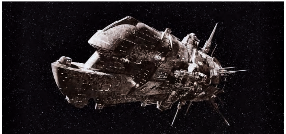
HMS Hawking de classe Neptune, detail