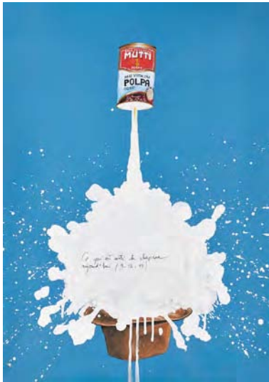
Ce qui est sorti du chapeau aujourd'hui