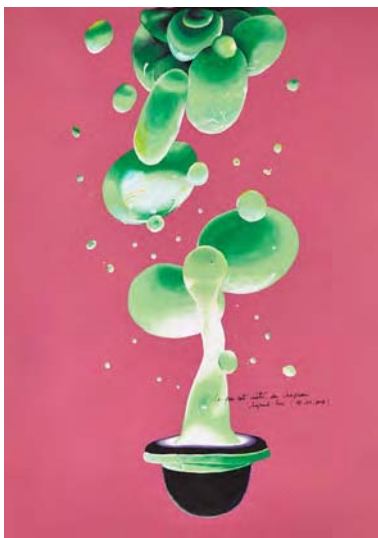
Ce qui est sorti du chapeau aujourd'hui

très conceptualisés, comme les exoplanètes, mais n'ont pour image qu'une fiction, cette vue d'artiste . Un pied dans une construction mentale sérieuse du réel, un autre dans la fantaisie. Cette ambivalence ne pouvait que me séduire. Et puis c'est un art mineur, comme l'a longtemps été la bande dessinée : une terre vierge. Y poser le pied produit un frisson sans égal et débusquer ces perles inconnues ou ignorées du monde de l'art fait partie des gestes qui me sont précieux.