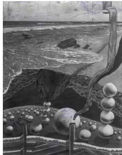
Made By God's Assistant

Plusieurs matériaux non conventionnels ont été utilisés, y compris de la pâte à papier et des déchets en plastique provenant de son atelier. Toutes ces couches de différents matériaux, utilisés de manière peu orthodoxe, leur confèrent un aspect géologique. La vie est une matière complexe et même le plus artificiel des plastiques polymère est fait de poussière d'étoiles, tout comme nous.