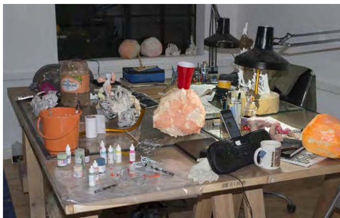
Vue de l'atelier

A travers sa perspective post-humaniste, l'artiste adopte la posture d'autres formes de vie, ou bien d'une intelligence artificielle, ou encore d'un Simulateur Omnipotent. Dans ce nouvel univers, il n'y a ni politique, ni logique, ni bien ni mal, encore moins de l'art, mais seulement des matériaux et leur combinaison devient le seul langage universel. Ce point de vue place l'activité humaine sur le même plan que les insectes, la roche et les virus. Il nous faut quitter l'Humanité afin d'entrevoir ce que nous sommes en train d'infliger au monde. Seul un non-humain peut critiquer un humain. Alors peut-être serons-nous en mesure de comprendre.