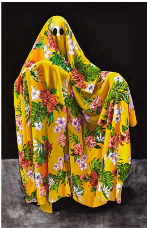
Hawaiian Ghost 2