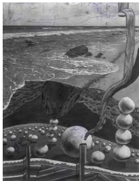
Made By God's Assistant