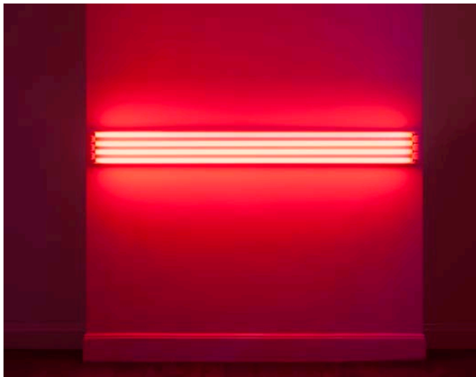
«four red horizontals (to Sonja),» 1963 Red fluorescent light 22 x 243,8 cm / 8 3/4 inches x 96 inches

Dan Flavin was born in 1933 in New York. Flavin attended preparatory school for the seminary in Brooklyn. In 1953, he enlisted in the Air Force where he trained as a meteorological technician. While working as a meteorological aide, Flavin began making and collecting art and visiting museums in Washington D.C., and New York. In the late 1950's, Flavin attended Columbia University and studied Art History. Major exhibitions of Flavin's work include those at the Museum of Contemporary Art, Chicago (1967); the National Gallery of Canada, Ottawa (1969); the Staatliche Kunsthalle, Baden-Baden (1989) and «Dan Flavin: A Retrospective», a touring exhibition organized by Dia Foundation in association with the National Gallery of Art, Washington, D.C (2004–2007) which traveled to the Museum of Contemporary Art, Chicago; the Museum of Modern Art, Fort Worth, Texas; Hayward Gallery, London; Musée d'Art Moderne de la Ville de Paris; Bayerische Staatsgemäldesammlungen, Pinakothek der Moderne, Munich; and the Los Angeles County Museum of Art. In 1983, The Dan Flavin Art Institute in Bridgehampton, New York, was inaugurated in a converted firehouse. In 1992, he created a monumental work for the reopening of the Solomon R. Guggenheim Museum, New York. Dan Flavin died in 1996, after having designed his ultimate work, inside the nave and the choir of Milan's Chiesa Rossa.