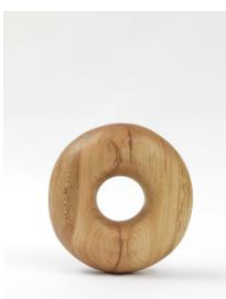
Sculpture Object 44: Donut standing up, 2016 platanus, spruce plinth, chainsaw carved, black ink and oil Sculpture: 38 x 13 x 13 cm Plinth: 498 x 135 x 45 cm