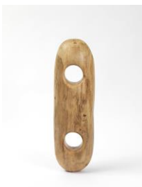
Sculpture Object 36: Two Mouthes, 2016 Ilex aquifolium, spruce plinth, chainsaw carved, black ink and oil Sculpture: 84 x 14 x 27 cm Plinth: 273 x 60 x 45 cm