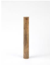
Sculpture Object 46, 2016 cherry tree, spruce plinth, chainsaw carved, black ink and oil Sculpture: 62 x 9 x 9 cm Plinth: 483 x 45 x 45 cm