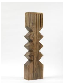
Sculpture Object 49: Two Zigzag creates a Totem, 2016 walnut, spruce plinth, chainsaw carved, black ink and oil Sculpture: 139 x 34 x 19 cm Plinth: 249 x 135 x 30 cm