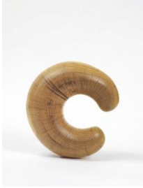
Sculpture Object 45: Le Croissant, 2016 acacia, spruce plinth, chainsaw carved, black ink and oil Sculpture: 34 x 36 x 15 cm Plinth: 249 x 135 x 30 cm