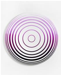
Big Circle, gradient black pink white, 2016 acrylic on canvas, framed Ø 150 cm dimensions variable