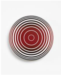
Small Circle, gradient black red black, 2016 acrylic on canvas, framed Ø 40 cm