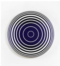
Middle Circle, gradient black violet black, 2016 acrylic on canvas, framed Ø 90 cm