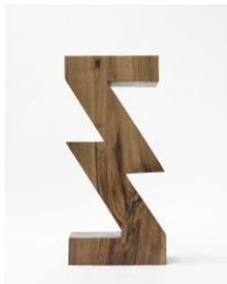
Sculpture Object 43: ZigZag Division, 2016 walnut, spruce plinth, chainsaw carved, black ink and oil Sculpture: 74 x 20 x 34 cm Plinth: 498 x 135 x 45 cm