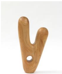
Sculpture Object 42, 2016 cherry trees, spruce plinth, chainsaw carved, black ink and oil Sculpture: 76 x 17 x 43 cm Plinth: 210 x 210 x 30 cm