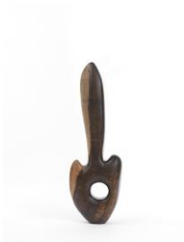
Sculpture Object 38: The Beauty, 2016 ebony, spruce plinth, chainsaw carved, black ink and oil Sculpture: 101 x 34 x 13 cm Plinth: 453 x 135 x 45 cm