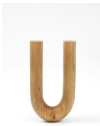
Sculpture object 47: Big U, 2016 platanus, spruce plinth, chainsaw carved, black ink and oil Sculpture: 81 x 45 x 15 cm Plinth: 210 x 210 x 30 cm