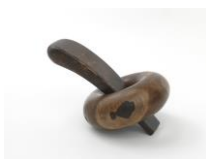
Sculpture Object 41: Loony Toons, 2016 ebony, walnut, spruce plinth, chainsaw carved, black ink and oil Sculpture: 31 x 50 x 36 cm Plinth: 468 x 90 x 45 cm