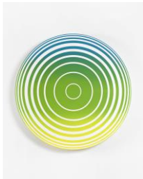
Middle Circle, gradient yellow green blue, 2016 acrylic on canvas, framed Ø 90 cm