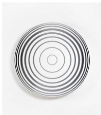
Middle Circle, gradient black grey black, 2016 acrylic on canvas, framed Ø 90 cm