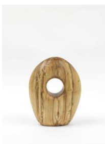
Sculpture Object 40: Fatty Kenny, 2016 acacia, spruce plinth, chainsaw carved, black ink and oil Sculpture: 50 x 13 x 39 cm Plinth: 498 x 60 x 45 cm