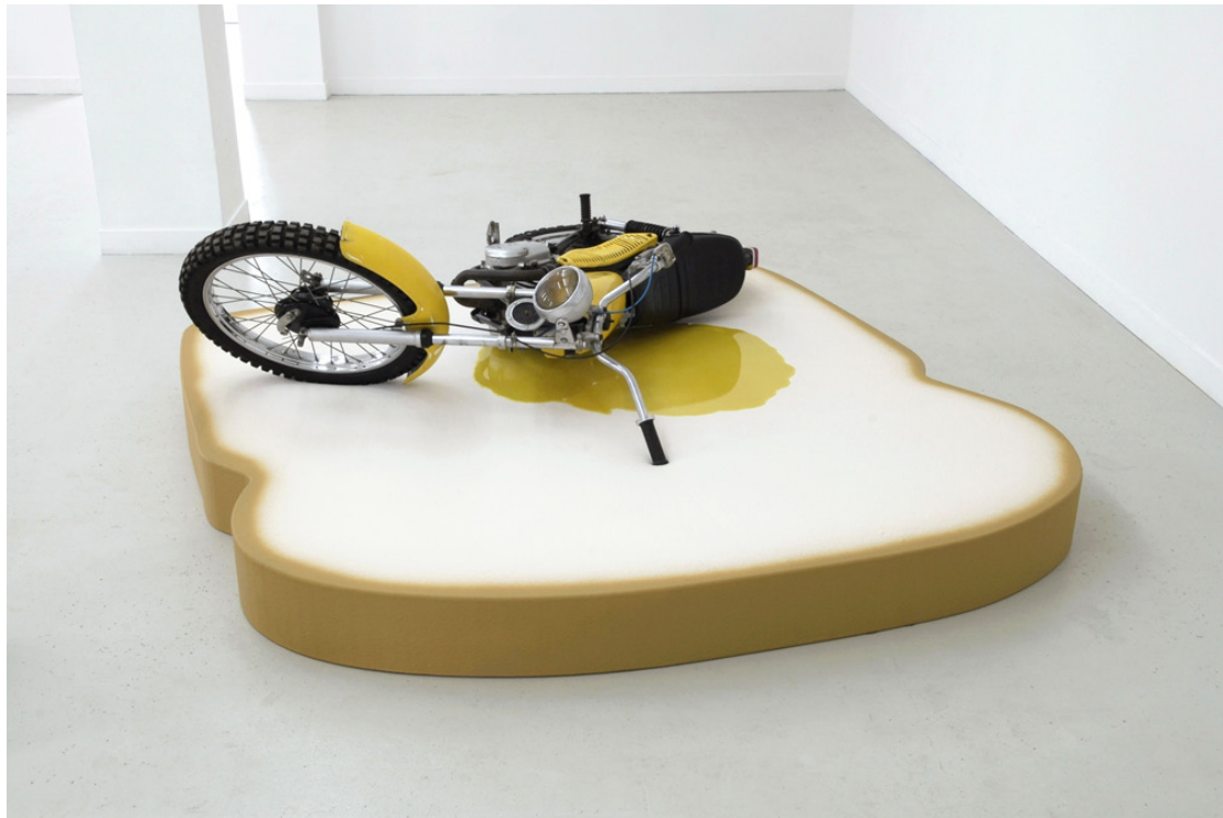
Toast cannibale, 2014 moto, mousse, résine, 220 x 200 x 50 cm (toast 18 x 201 x 194 cm, moto 106 x 184 x 70 cm) unique