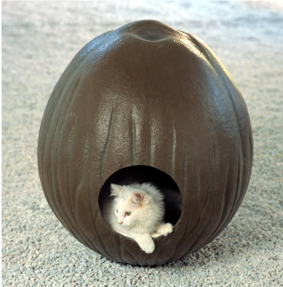
Cococat, 2001 fibre de verre, résine, tissu, mousses ca. 70 x 60 x 50 cm ed: 5