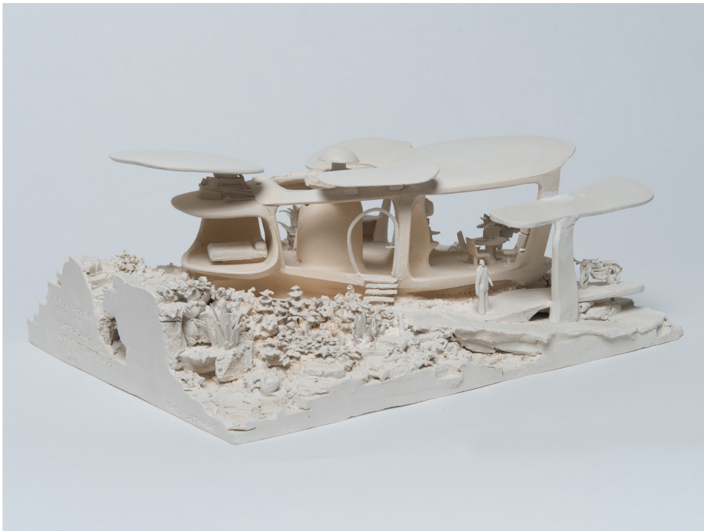
Fred Biesmans Villa Piccaya Equatoriale 2012 céramique, 26 x 19 x 9,5 cm unique