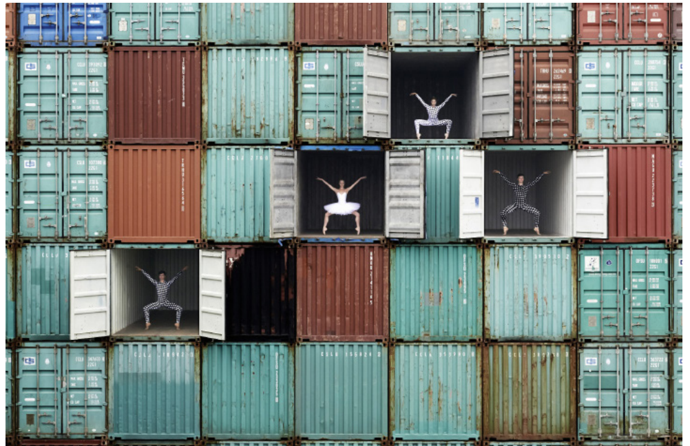
"Ballet dancers in containers, Le Havre, France, 2014" Photographie couleur, plexiglas mat, aluminium, bois / Color photograph, mat plexiglas, aluminum, wood 125 x 187 cm / 49 1/4 x 73 9/16 inches

JR « DECADE. Portrait d'une génération » Galerie Perrotin, Paris / 12 septembre - 17 octobre 2015 Vernissage: samedi 12 septembre, 16h-21h