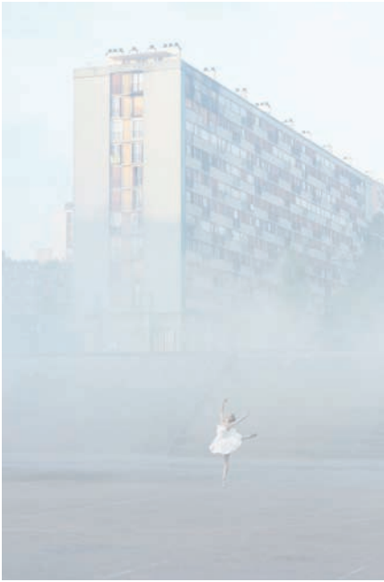
"28 Millimètres, Portrait d'une génération, Les Bosquets, In the Mist, Montfermeil, France, 2014" Photographie couleur, plexiglas mat, aluminium, bois / Color photograph, mat plexiglas, aluminum, wood 270 x 180 cm / 106 5/16 x 70 7/8 inches