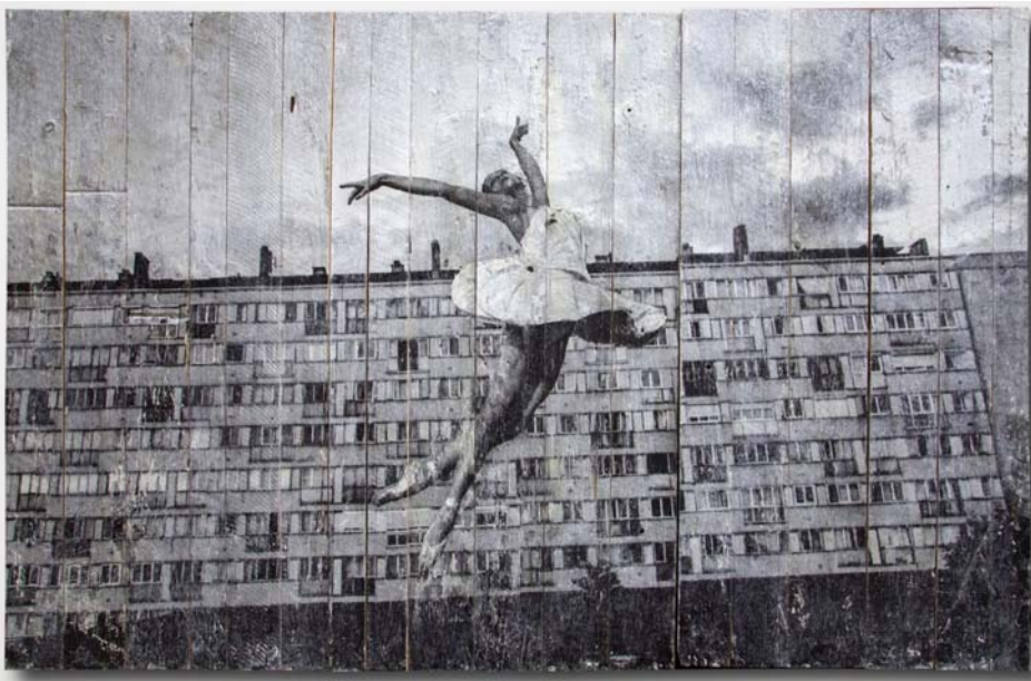
"28 Millimètres, Portrait d'une génération, Les Bosquets, Jeté cambré, Montfermeil, France, 2014" Encre sur bois / Ink on wood 228 x 366 cm / 89 3/4 x 144 1/8 inches