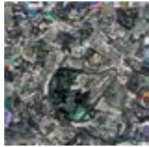
Compressed Space II 2015 30,5 x 30,5 cm acrylic on ply panel