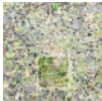
Escalation III 2015 121,9 x 121,9 cm acrylic on canvas