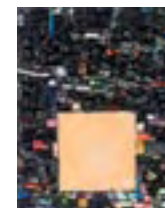
The Prize #1 2015 45,7 x 35,6 cm acrylic on ply panel