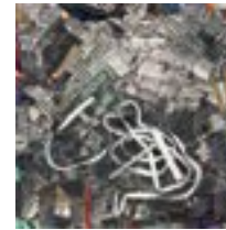
Compressed Space IV 2015 30,5 x 30,5 cm acrylic on ply panel