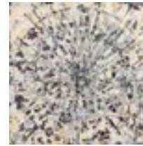
Escalation II ( x^2 + y^2 = 1 ) For Alexander Grothendieck 2014 121,9 x 121,9 cm acrylic on canvas