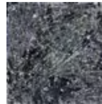
Escalation I 2014 121,9 x 121,9 cm acrylic on canvas