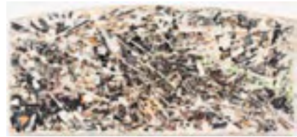
Vulcan Philosophy ("Infinite diversity in infinite combinations") For: Dr. Spock 2015 88,9 x 198,1 cm acrylic and one stainless steel ball bearing on MDF