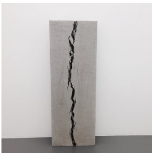
Christoph Weber Not yet titled

2015 concrete, steel 18.5 x 130 x 60 cm Unique WEB/S 97