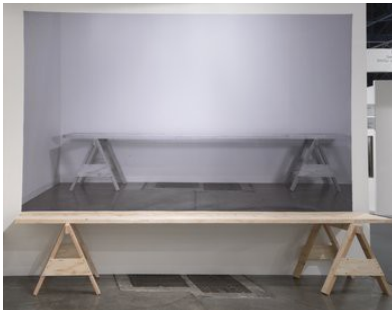
William Anastasi Passion

2000 colour pencil on paper 39 x 46.5 cm unique WA/D 79