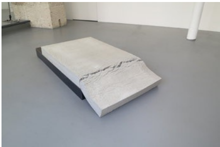
Christoph Weber Not yet titled

1967 Photomural, scaffold and pine plank Dimensions variable, (protocol) Photomural : 152,5 x 365,8 cm Scaffold and pine plank : 91,4 x 426,7 x 61 cm 1/3 + 1 A.P. WA/I 6