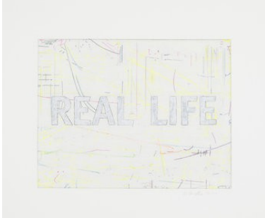
William Anastasi Real life

2000 colour pencil on paper 39 x 46.5 cm unique WA/D 79