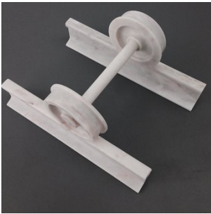
Francisco Tropa Antipode

2010 Graphite and ink on paper 19.3 x 28.8 cm Unique WA/D 4