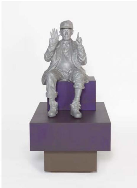
"Lee Scratch Perry" (2015) 122,5 x 62 x 86 cm / 58 1/2 x 24 4/8 x 33 7/8 inches Résine polyuréthane chargée aluminium, contreplaqué, peinture acrylique, vernis / Aluminium-filled polyurethane resin, plywood, acrylic paint, varnish