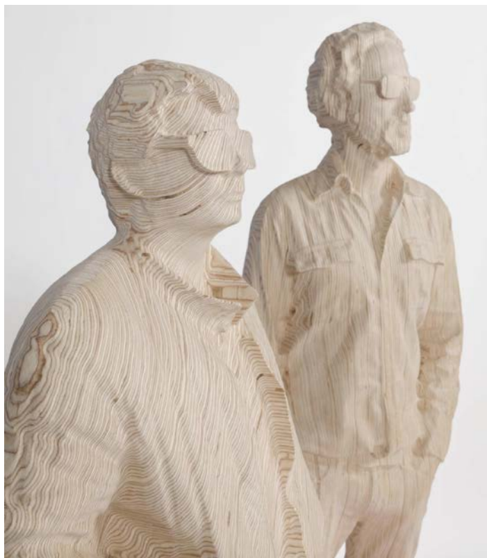
"Thomas Bangalter & Guy-Manuel de Homem-Christo" (detail), 2015 161 x 100 x 55 cm / 63 3/8 x 39 3/8 x 21 5/8 inches Contreplaqué de bouleau, peinture acrylique, vernis / Birch plywood, acrylic paint, varnish