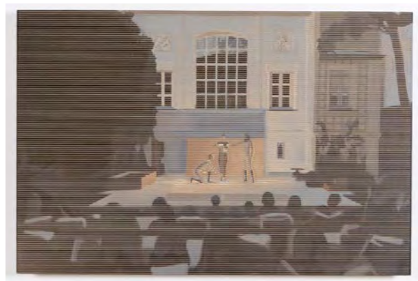
Top: "Le Mobile n°6 / Mobile n°6", 2015 105 x 86 x 54 cm / 41 3 / 8 x 33 7 / 8 x 21 1 / 4 inches. Acier inoxydable, hêtre, liège, lin, vernis acrylique / Stainless steel, beech, cork, linen, acrylic varnish Bottom: "SYSTEMA OCCAM n°1", 2015 40 x 60 x 3 cm / 15 3 / 4 x 25 5 / 8 x 1 1 / 8 inches. Huile sur bois / Oil on wood