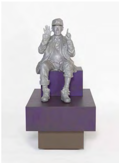
"Lee Scratch Perry" (2015) 122,5 x 62 x 86 cm / 58 1/2 x 24 4/8 x 33 7/8 inches Résine polyuréthane chargée aluminium, contreplaqué, peinture acrylique, vernis / Aluminium-filled polyurethane resin, plywood, acrylic paint, varnish

All images: © Veilhan/ ADAGP, Paris/ ARS, New York, 2015 Courtesy Galerie Perrotin