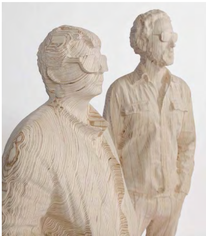
"Thomas Bangalter & Guy-Manuel de Homem-Christo" (detail), 2015 161 x 100 x 55 cm / 63 3 / 8 x 39 3 / 8 x 21 5 / 8 inches Contreplaqué de bouleau, peinture acrylique, vernis / Birch plywood, acrylic paint, varnish