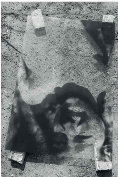
«Faccia» 2011 Sérigraphie en deux couleurs sur papier / Two colors silkscreen on paper 160 x 120 cm / 63 x 47 1/4 inches