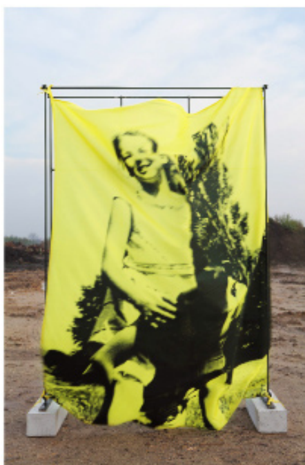
Sans titre / Untitled 2009 Impression numérique / Digital print 52 x 35 cm / 20 1/2 x 13 3/4 inches