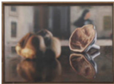
Study for Just Married Machine II 2014 56 x 78 cm oil on canvas