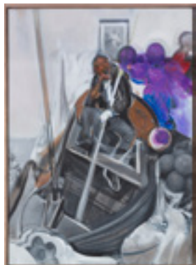
Study from Just Married Machine I 2014 198,2 x 272,7 cm acrylic on canvas