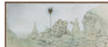
Study from Just Married Machine III 2014 126,9 x 298,2 cm charcoal and acrylic on canvas