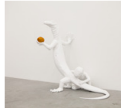
Fanfaro 2014 121 x 73 x 127 cm painted wood, fried rice ball