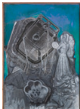
Study from Just Married Machine II 2014 198,2 x 272,7 cm acrylic on canvas