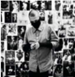
Alexander McQueen, London 2007 146 x 146 cm inkjet print on Hanemühle 285 grs. fine art pearl photo paper, mounted on dibond edition of 6 + 2 AP