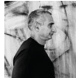
Christopher Wool, New York 2013 146 x 146 cm inkjet print on Hanemühle 285 grs. fine art pearl photo paper, mounted on dibond edition of 6 + 2 AP