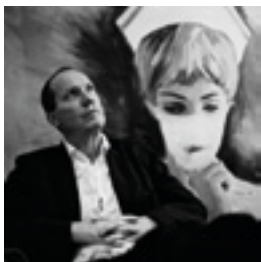
Richard Prince, New York 2010 146 x 146 cm inkjet print on Hanemühle 285 grs. fine art pearl photo paper, mounted on dibond edition of 6 + 2 AP