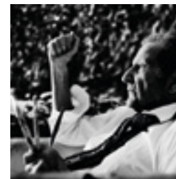
Lucian Freud, London 2008 146 x 146 cm inkjet print on Hanemühle 285 grs. fine art pearl photo paper, mounted on dibond edition of 6 + 2 AP