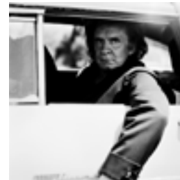
Johnny Cash, Nashville 1994 146 x 146 cm inkjet print on Hanemühle 285 grs. fine art pearl photo paper, mounted on dibond edition of 6 + 2 AP