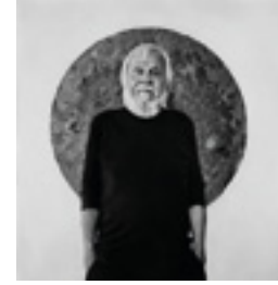
John Baldessari, Los Angeles 2013 146 x 146 cm inkjet print on Hanemühle 285 grs. fine art pearl photo paper, mounted on dibond edition of 6 + 2 AP