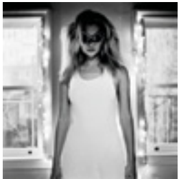
Kate Moss, New York 1996 146 x 146 cm inkjet print on Hanemühle 285 grs. fine art pearl photo paper, mounted on dibond edition of 6 + 2 AP