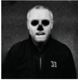
Damien Hirst, Stroud 2011 146 x 146 cm inkjet print on Hanemühle 285 grs. fine art pearl photo paper, mounted on dibond edition of 6 + 2 AP