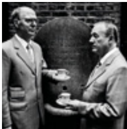
Gilbert & George, London 2001 146 x 146 cm inkjet print on Hanemühle 285 grs. fine art pearl photo paper, mounted on dibond edition of 6 + 2 AP