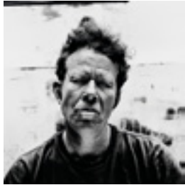
Tom Waits, Petaluma 2004 146 x 146 cm inkjet print on Hanemühle 285 grs. fine art pearl photo paper, mounted on dibond edition of 6 + 2 AP