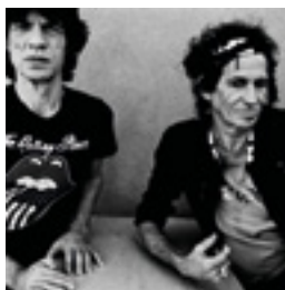
Mick + Keith, Toronto 2005 146 x 146 cm inkjet print on Hanemühle 285 grs. fine art pearl photo paper, mounted on dibond edition of 6 + 2 AP