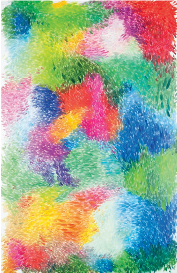
"fleur" 2014 Huile sur toile / Oil on canvas, 250 x 160 cm / 98 1/2 x 63 inches.

PETER ZIMMERMANN «sur le motif» Galerie Perrotin, Paris / June 12 - July 26, 2014 Press preview: Thursday June 12, 10am-12pm