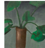
Untitled 2013 86 x 80,5 cm oil on canvas