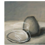
Untitled 2013 70,5 x 70 cm oil on canvas