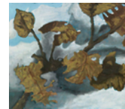
Untitled 2013 132 x 156,3 cm oil on canvas