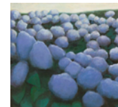
Untitled 2013 170,5 x 190,5 cm oil on canvas