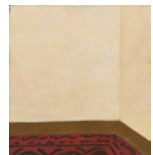
Le tapis d'Edward 1993 33,5 x 31 cm oil on canvas