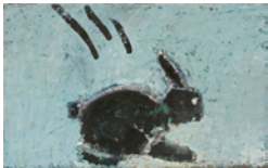
Un Lapin 1993 25 x 40 cm oil on canvas