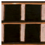
Untitled 2013 35,5 x 35,5 cm oil on canvas