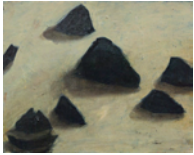
Untitled 2013 32,5 x 40 cm oil on canvas