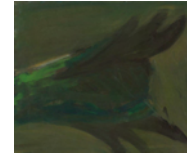
Untitled 1998 38 x 46 cm oil on canvas