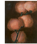
Untitled 2013 135 x 110 cm oil on canvas