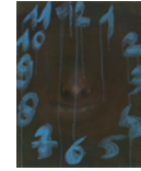
L'eau bouillante 1997-1999 46 x 38 cm oil on canvas