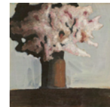
Untitled 2005 66 x 69,5 cm oil on canvas