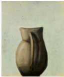
Untitled 2013 40,5 x 33,5 cm oil on canvas