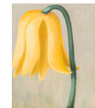
Untitled 2013 104 x 90,5 cm oil on canvas