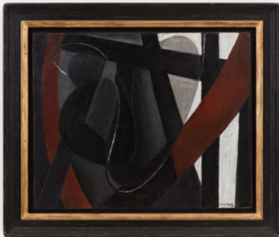
Pierre Soulages, Peinture 81 × 100 cm, 1946, 1946. Oil on canvas, 81 × 100 cm | 31 7/8 × 39 3/8 in. Photo: Claire Dorn. © Soulages / ADAGP, Paris 2026. Courtesy of Pierre Soulages Estate & Perrotin.