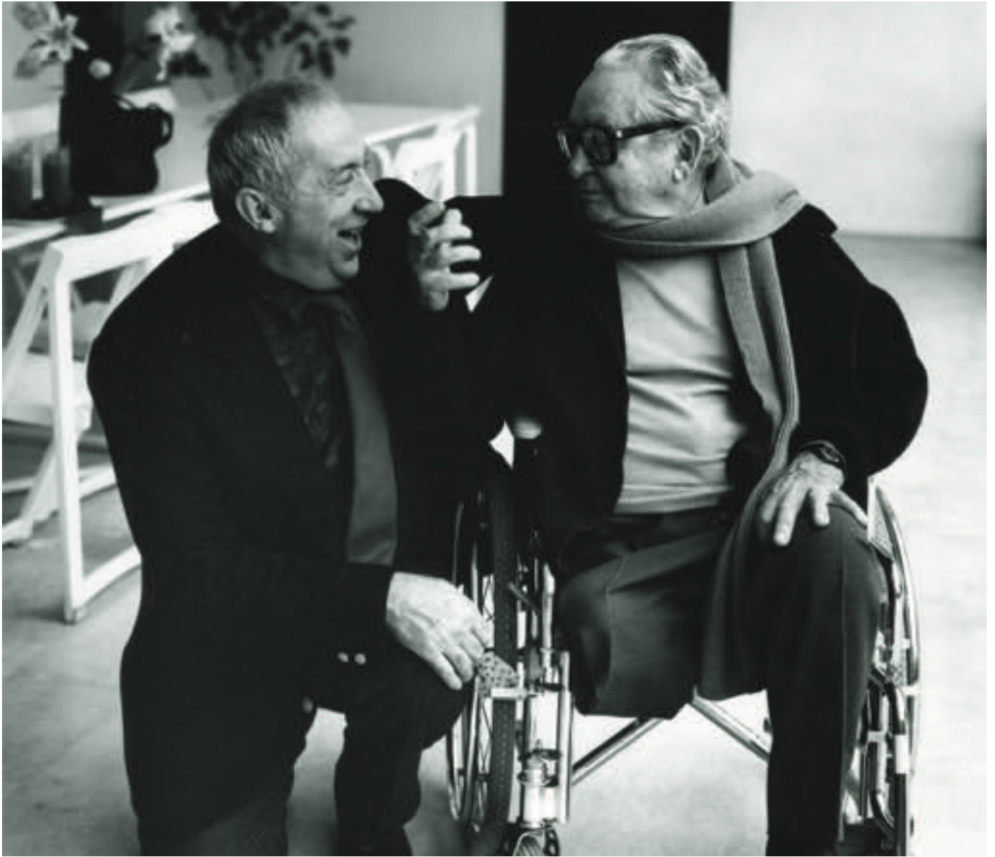
Pierre Soulages and Hans Hartung, December 1987, Antibes.

Entre les deux peintres, il y a de nombreuses préoccupations communes, parfois méconnues. Dans les années 1940-1950, poussés par des galeristes femmes audacieuses (Lydia Conti, Myriam Prévot), ils se font connaître avec un vocabulaire de lignes et de masses émancipé des canons géométriques, qui leur vaut d'être très vite identifiés comme chefs de file d'une nouvelle école abstraite, mais aussi de susciter de vives inimitiés. En 1955, la plume réactionnaire de Waldemar George affirme par exemple: «Hartung et Soulages semblent tourner dans le cercle infernal d'un art satanique et apocalyptique». Ils partagent des recherches sur le sacré, l'intériorité, ainsi qu'un rapport complexe avec la scène américaine. À la galerie Perrotin, en plus de pouvoir observer leur rapport au clair-obscur et à la lumière émanant de l'ombre, on découvrira leur utilisation moins connue du bleu dans les années 1980.