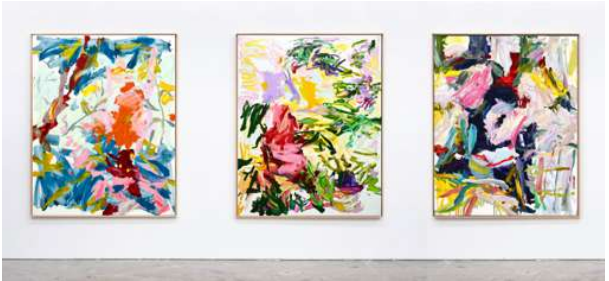
Gaël Davrinche, Champs libres , vue d'exposition