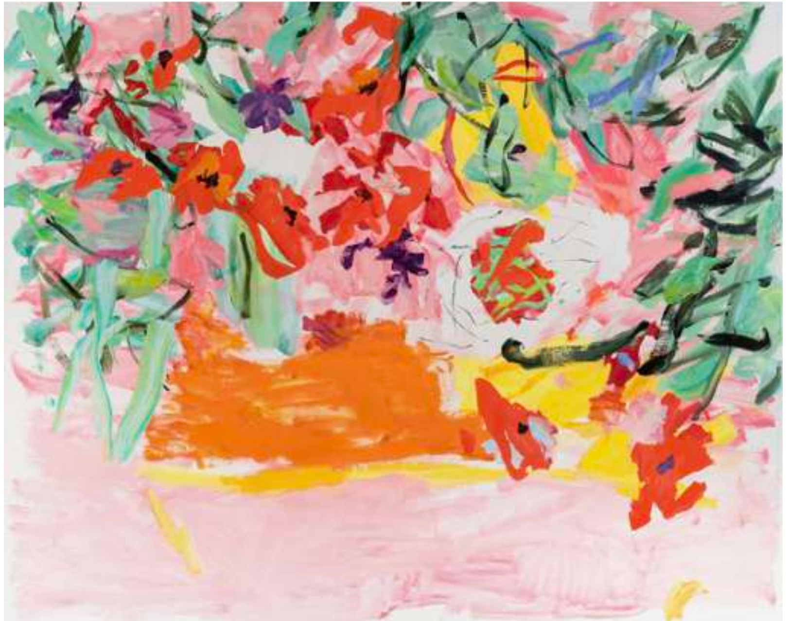
Gaël Davrinche The pink room Huile sur toile 160 x 200 cm 2024