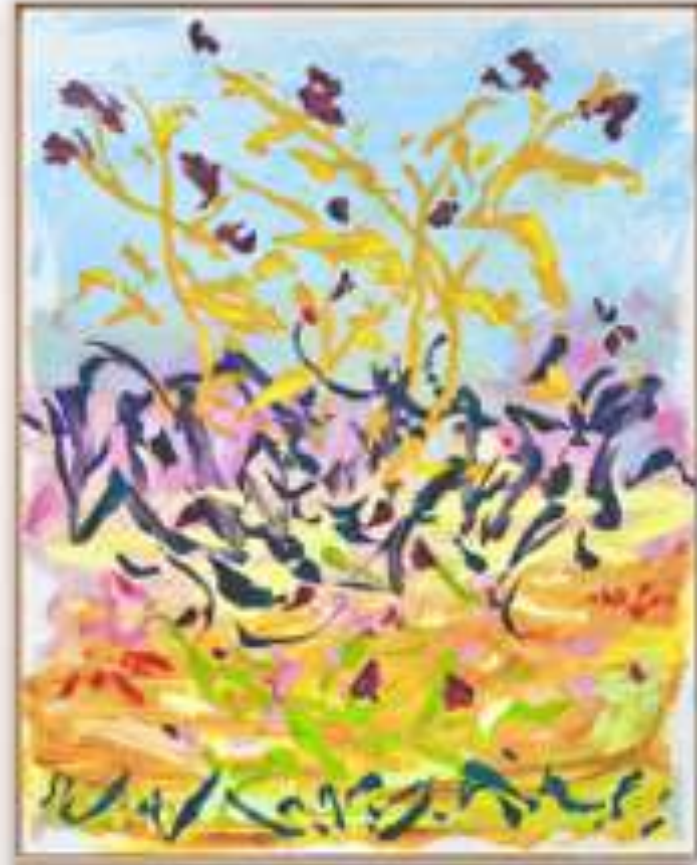
Gaël Davrinche, Champs libres , vue d'exposition