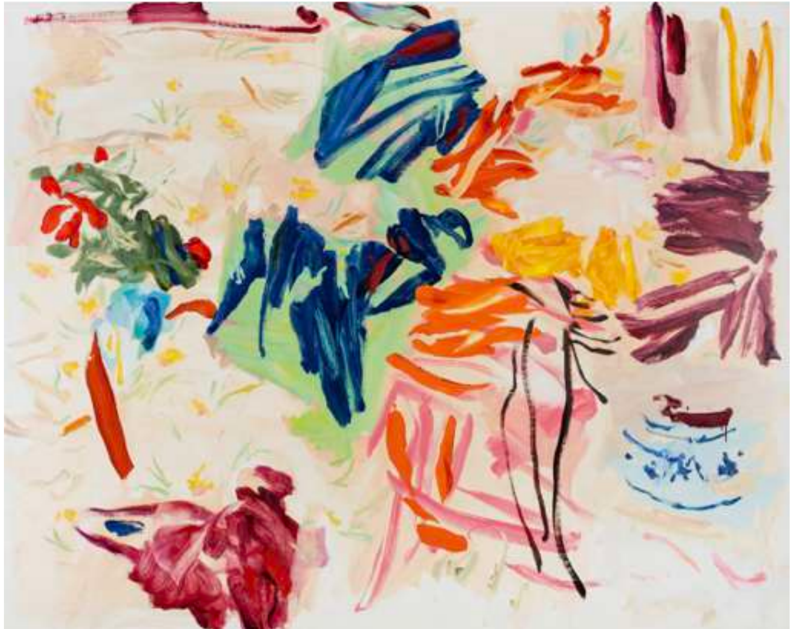
Gaël Davrinche Sunday at home Huile sur toile 160 x 200 cm 2025