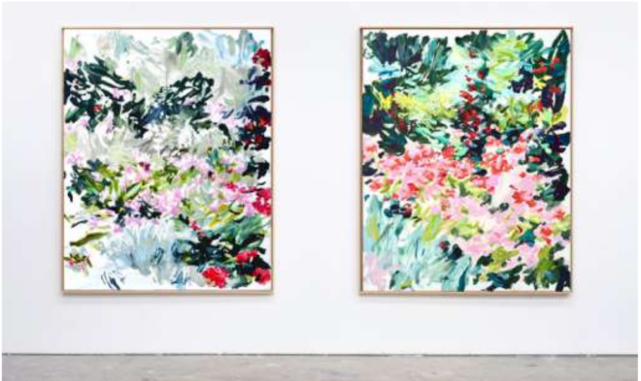
Gaël Davrinche, Champs libres , vue d'exposition