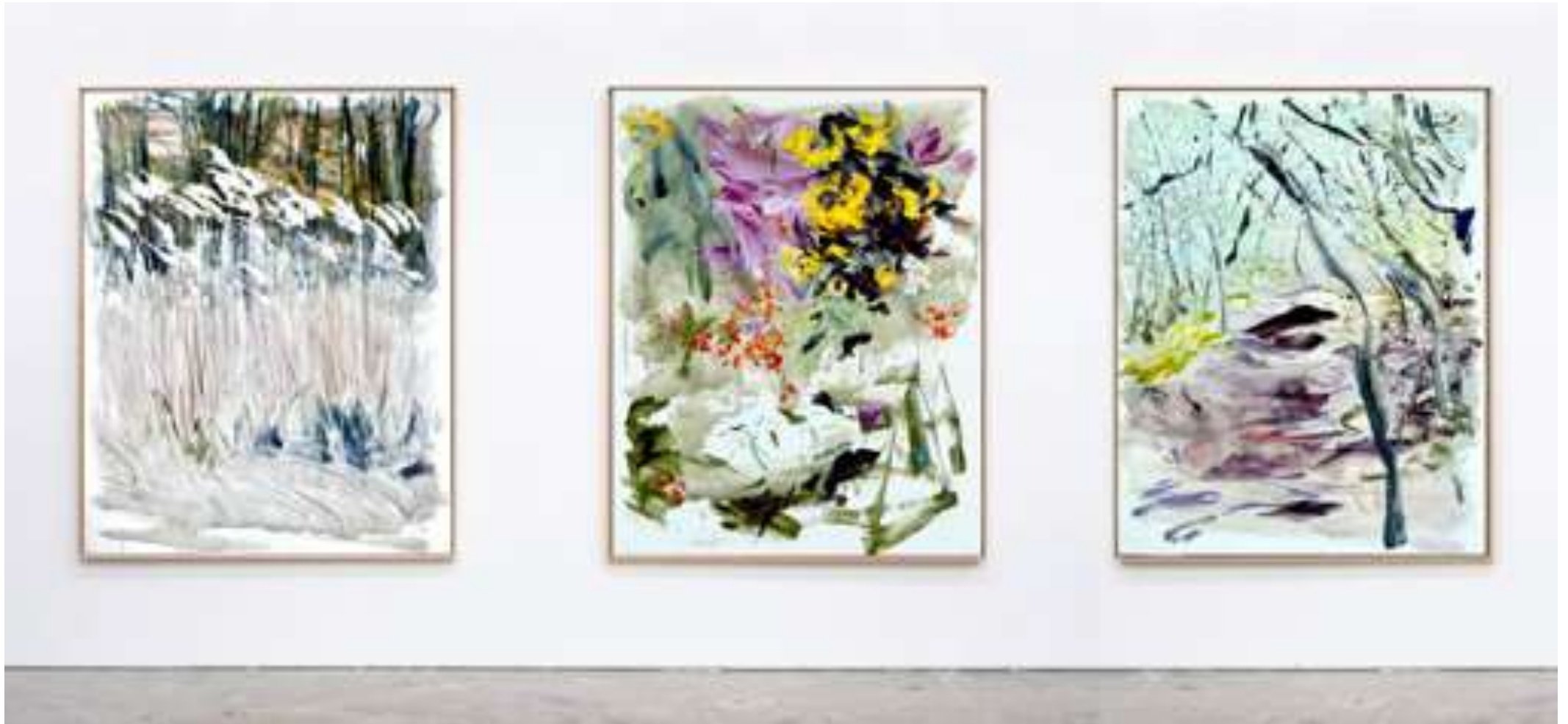
Gaël Davrinche, Champs libres , vue d'exposition