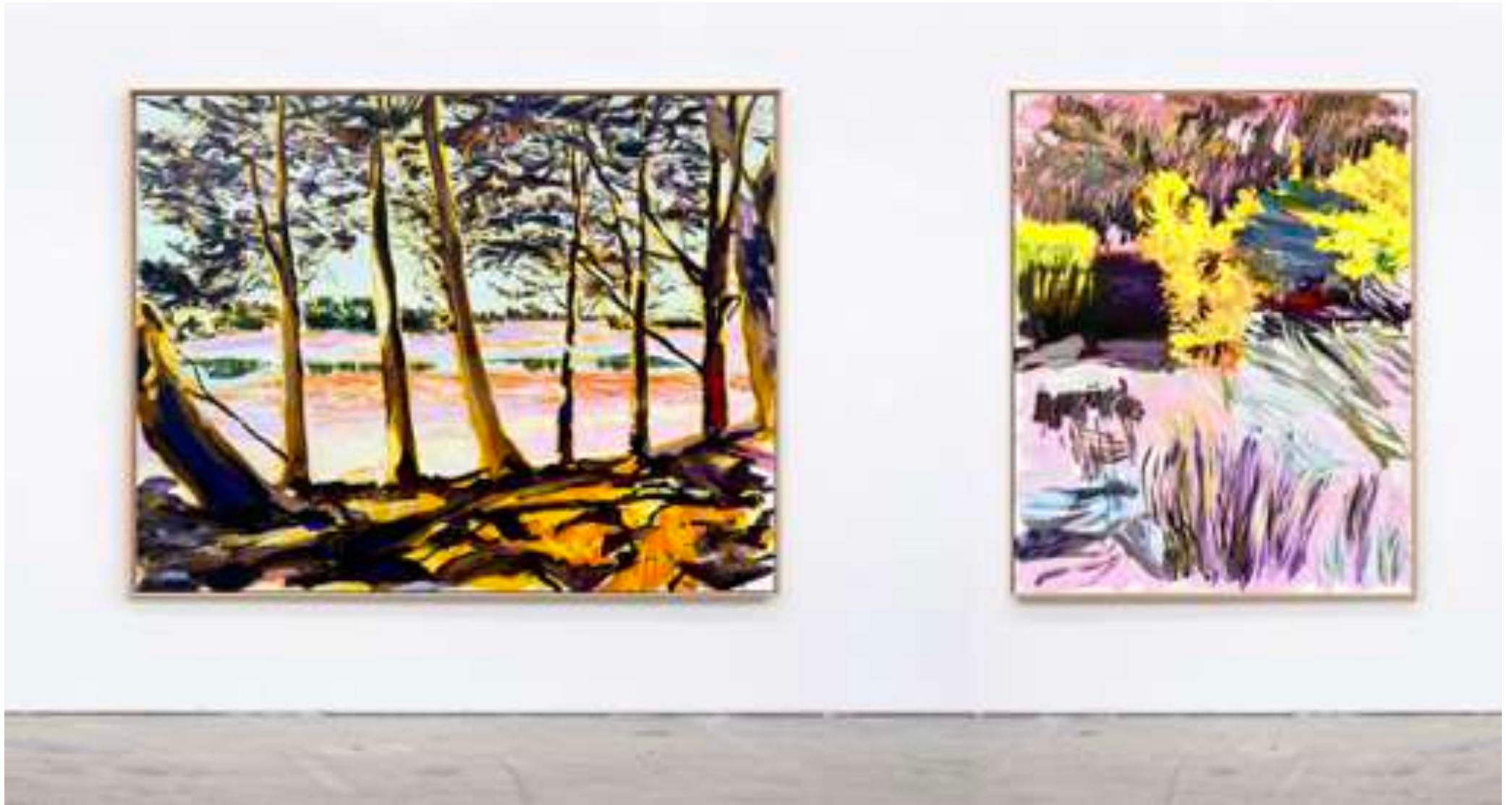
Gaël Davrinche, Champs libres , vue d'exposition