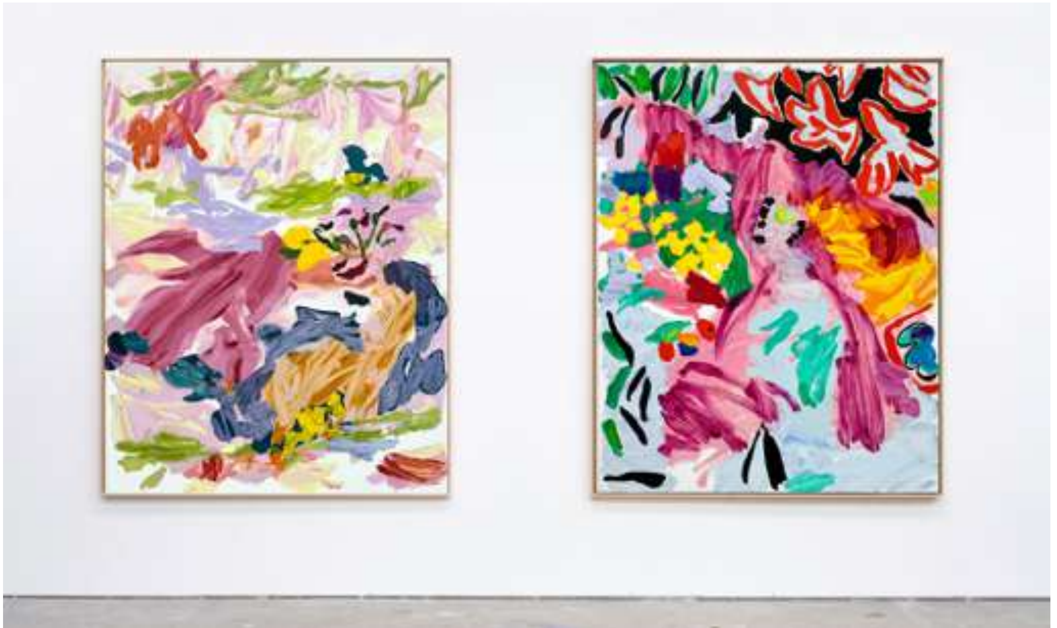
Gaël Davrinche, Champs libres , vue d'exposition