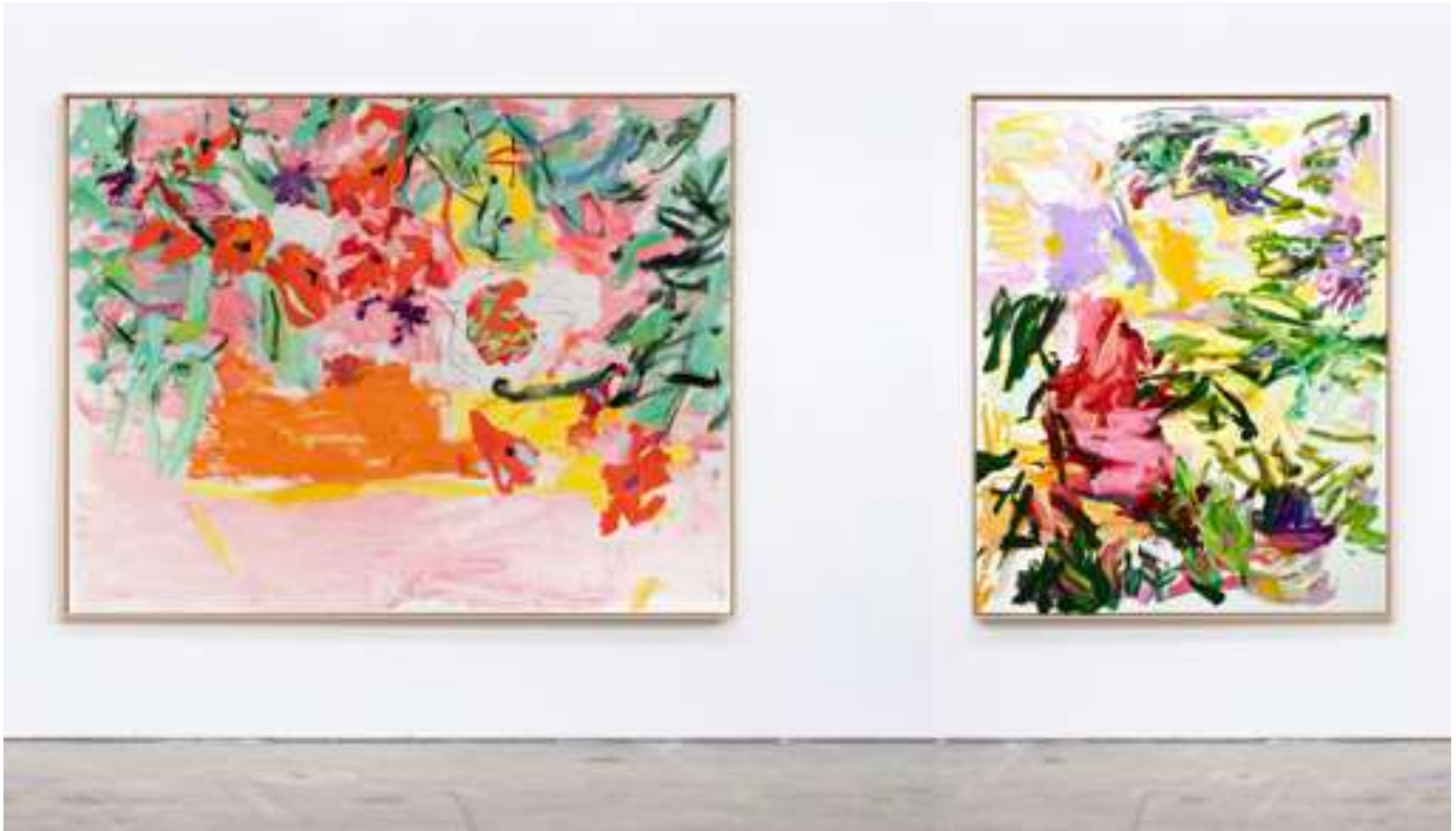
Gaël Davrinche, Champs libres , vue d'exposition