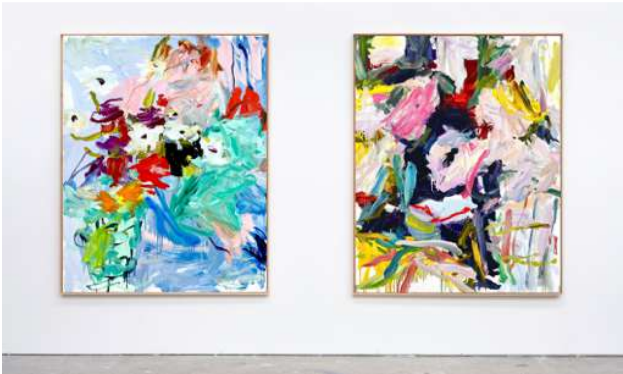
Gaël Davrinche, Champs libres , vue d'exposition