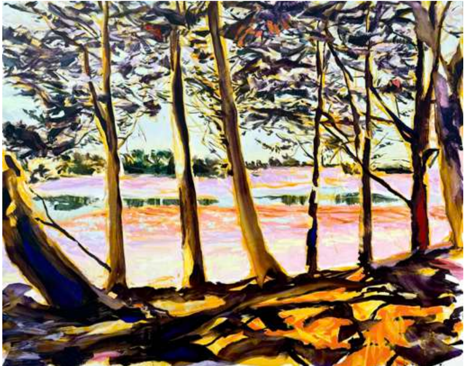
Gaël Davrinche Escape to Brittany Huile sur toile 200 x 250 cm 2025