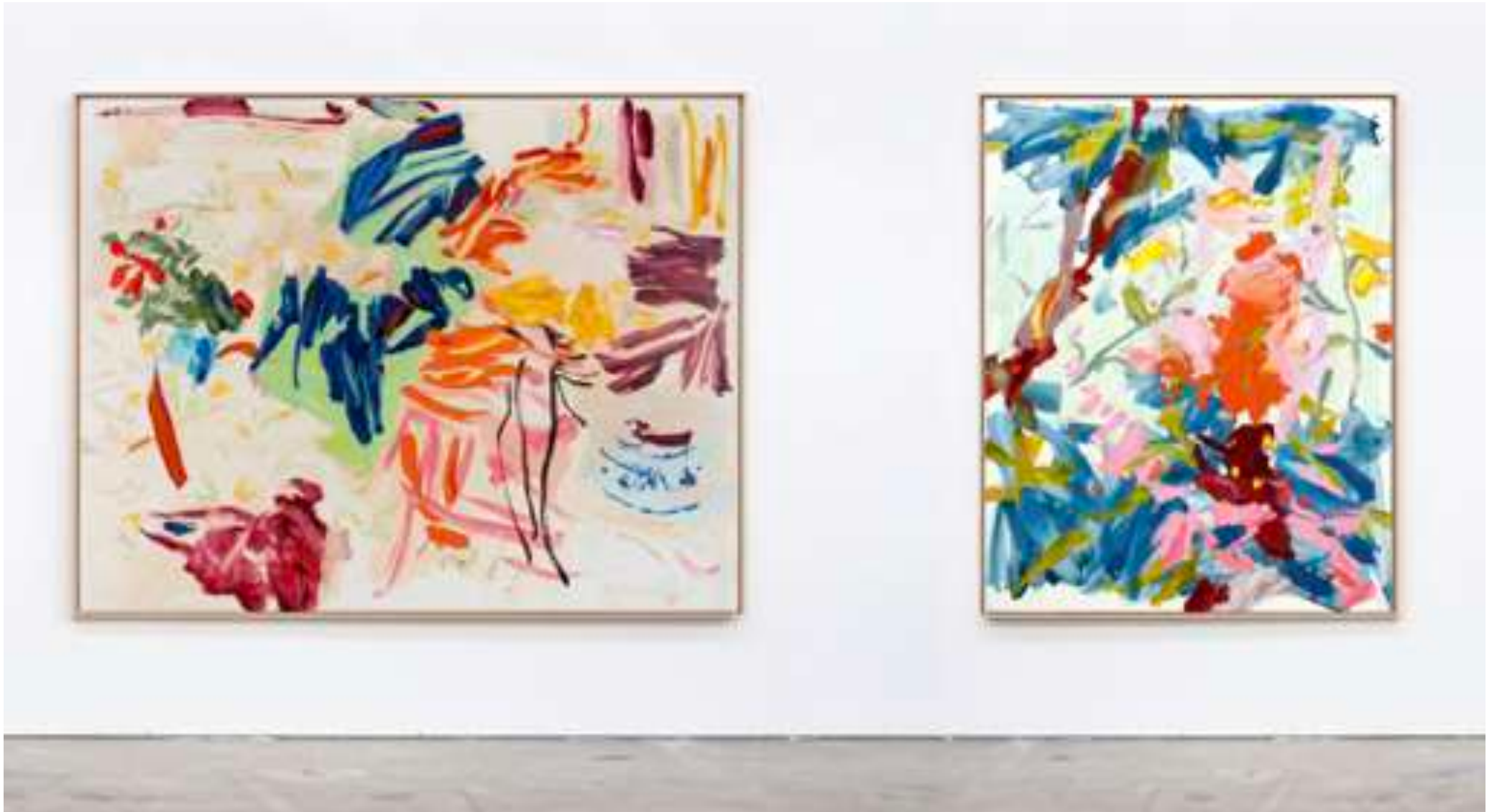
Gaël Davrinche, Champs libres , vue d'exposition