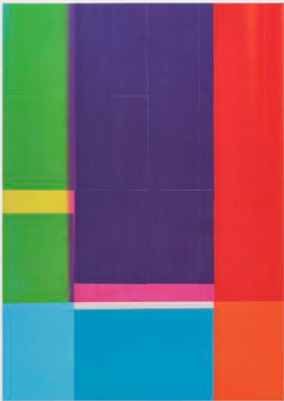
Sans titre 5 (A0) - Toner sur papier sur bois - A0 ( 84,1 x 119 cm ) - 2025