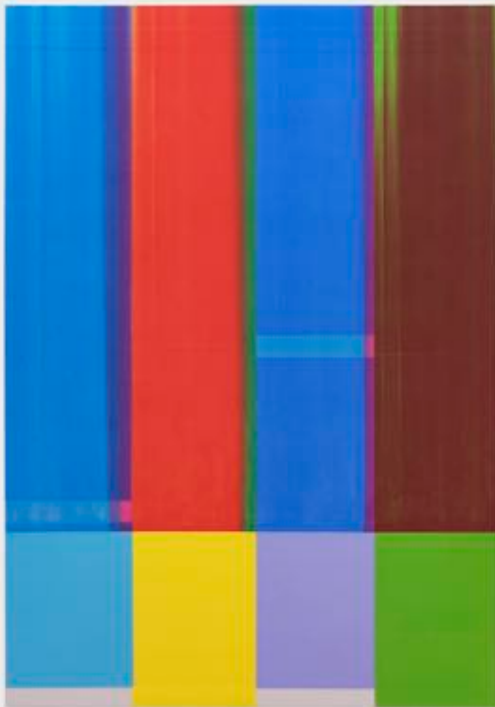
Sans titre 4 (A0) - Toner sur papier sur bois - A0 ( 84,1 x 119 cm ) - 2025