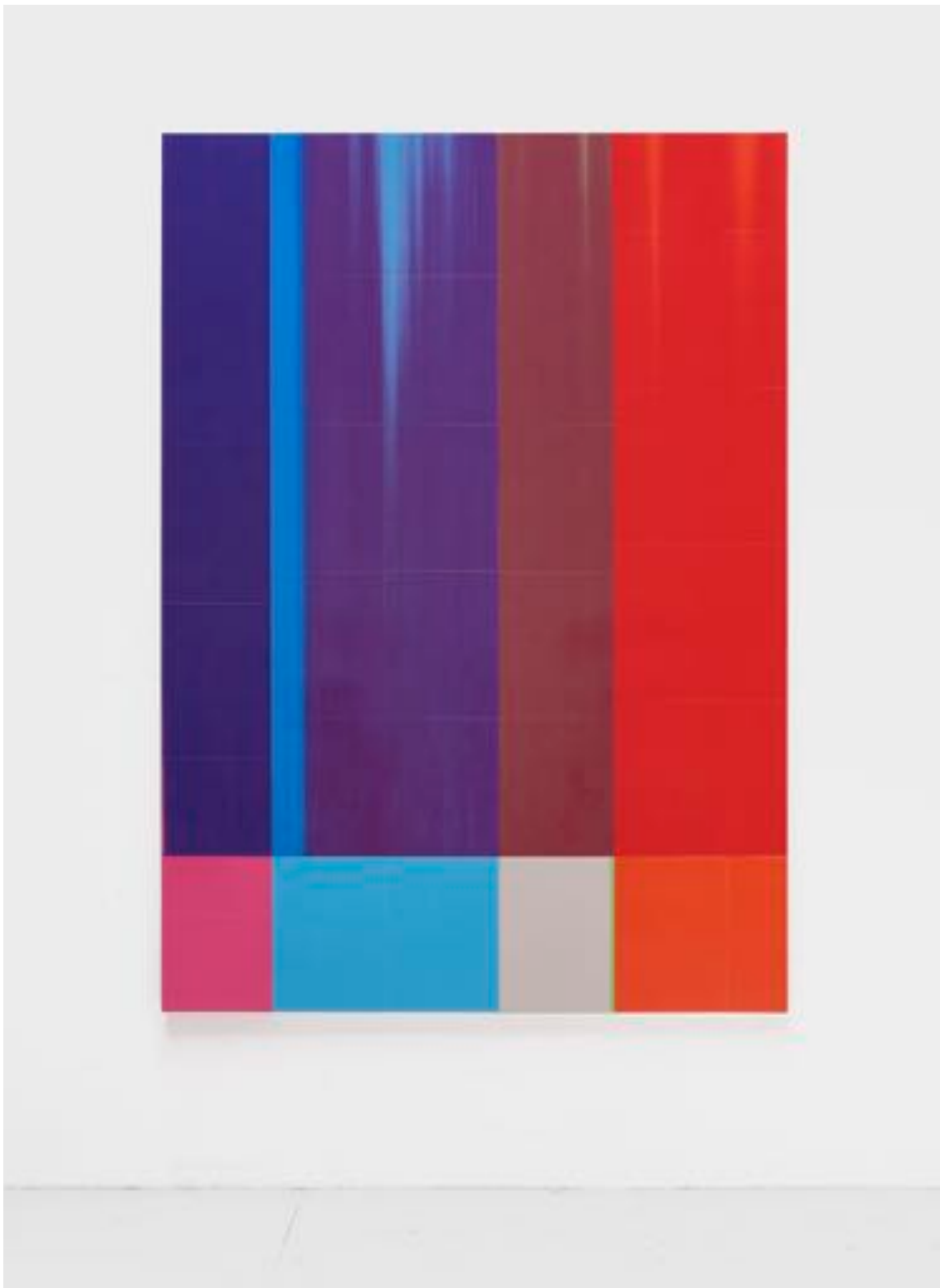
Sans titre 1 (2A0) - Toner sur papier sur bois - 2A0 ( 119 x 168,2 cm ) - 2025