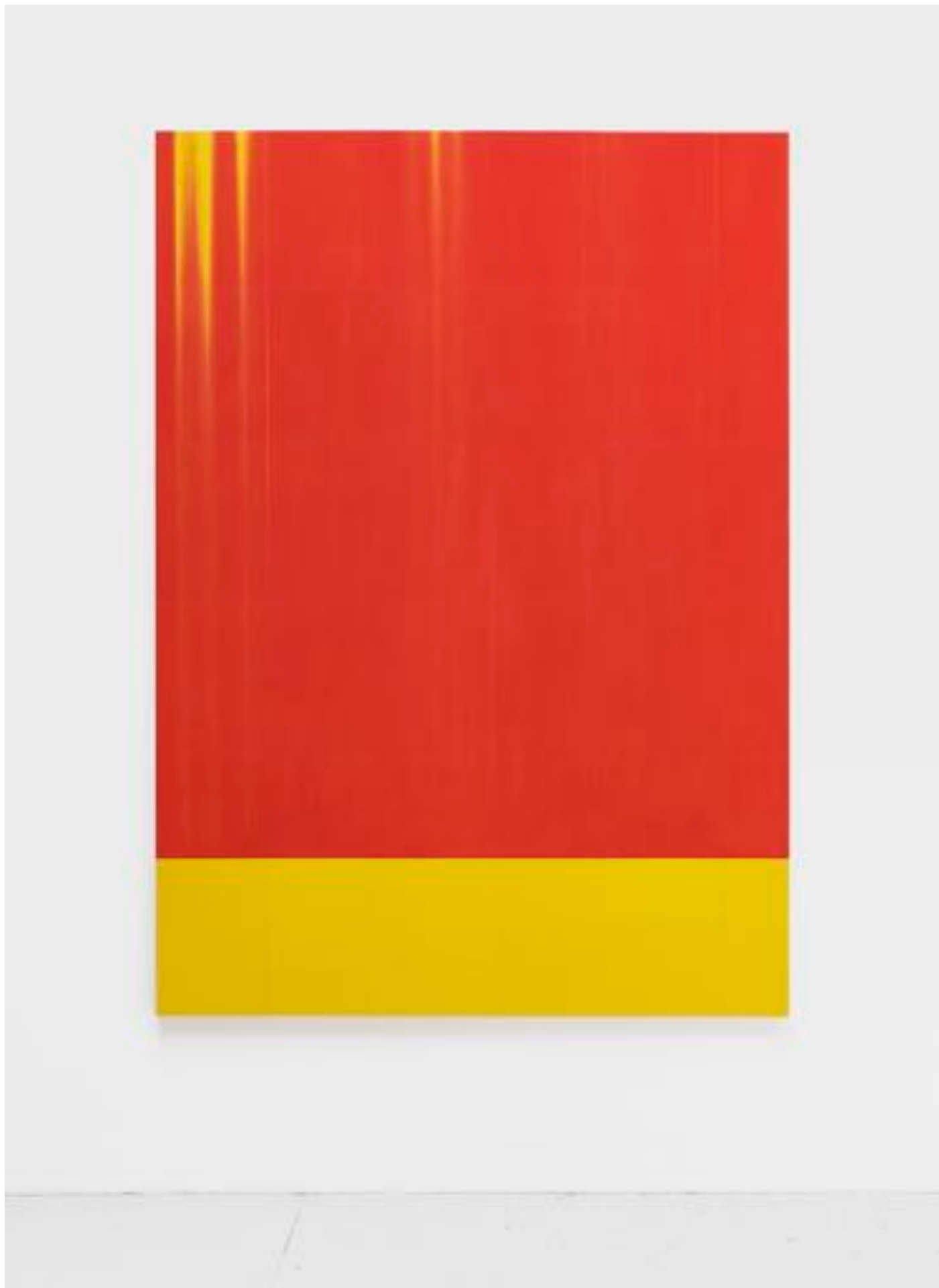
Sans titre 3 (2A0) - Toner sur papier sur bois - 2A0 ( 119 x 168,2 cm ) - 2025