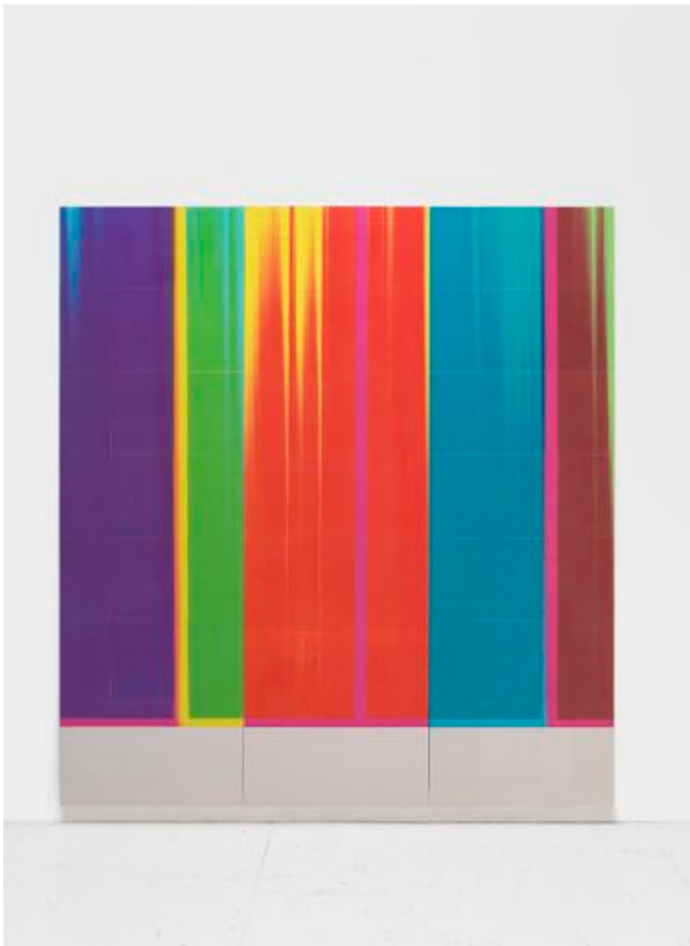
Sans titre 1 (triptyque) - Toner sur papier sur bois - 186 x 204 cm - 2025