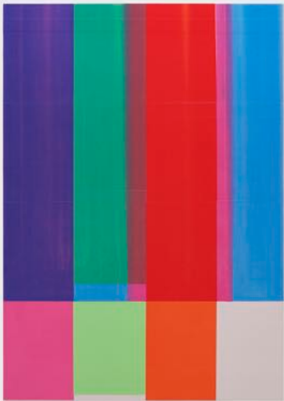
Sans titre 6 (A0) - Toner sur papier sur bois - A0 ( 84,1 x 119 cm ) - 2025