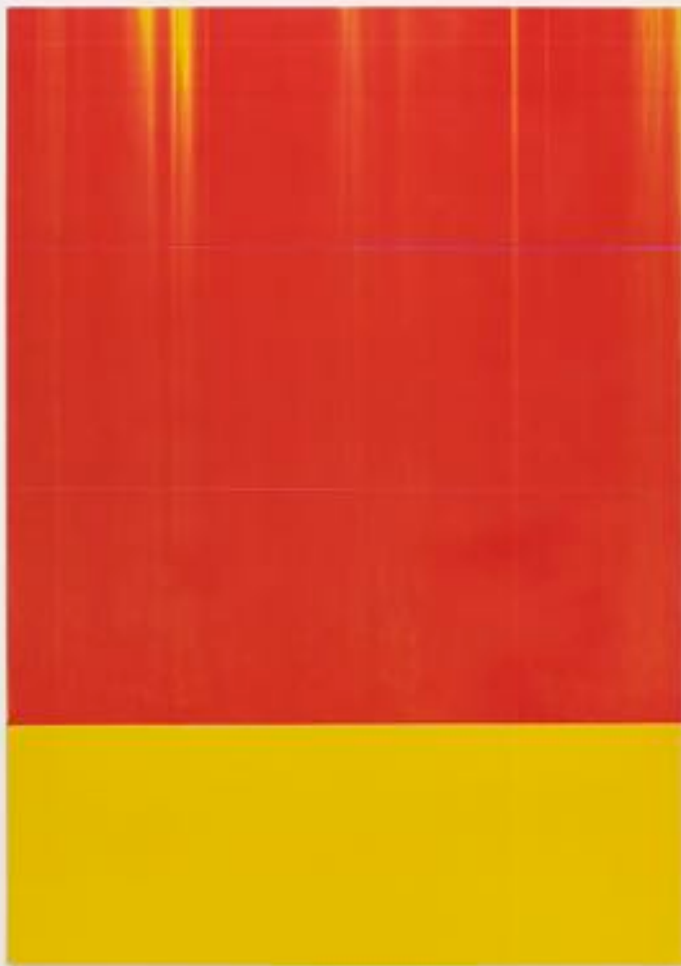
Sans titre 2 (A0) - Toner sur papier sur bois - 2A0 ( 119 x 168,2 cm ) - 2025