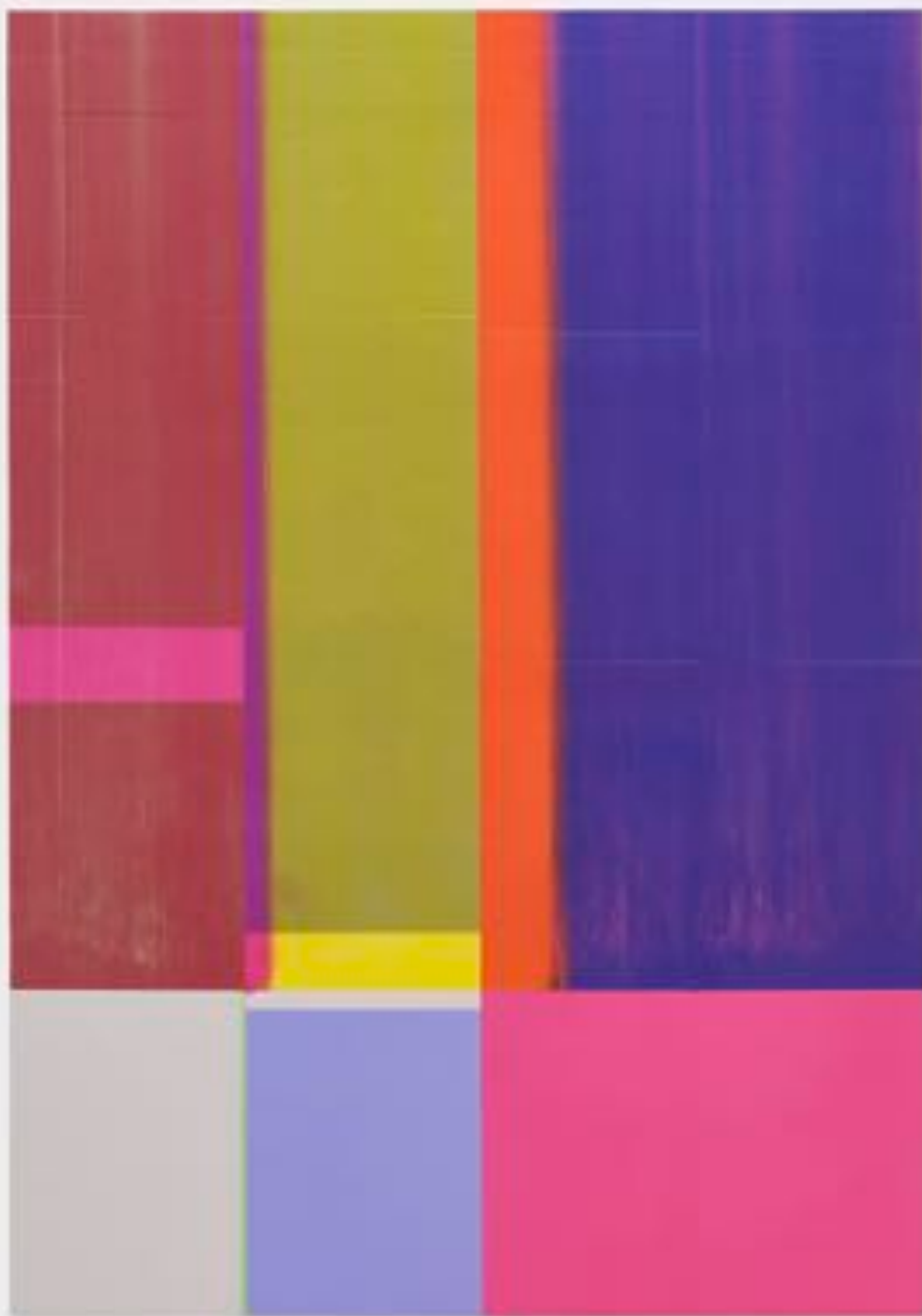
Sans titre 3 (A0) - Toner sur papier sur bois - A0 ( 84,1 x 119 cm ) - 2025