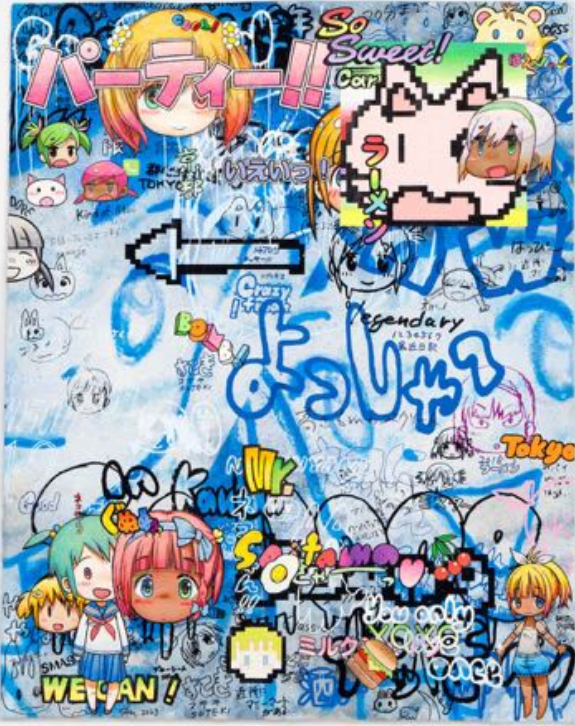
Mr., 蒼い明日 | Blue Tomorrow , 2023. Acrylic, silkscreen print, pen, pencil on paper. 71.9 x 56.8 cm | 28 5/16 x 22 3/8 in. Photo: Yuta Saito. ©2023 Mr./Kaikai Kiki Co., Ltd. All Rights Reserved. Courtesy of the artist and Perrotin.