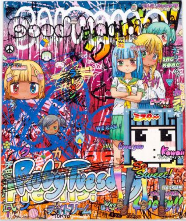
Mr., グッドモーニング埼玉・東京 | Good Morning, Saitama and Tokyo , 2023. Acrylic, silkscreen print, pen, pencil on paper. 45.5 x 37.8 cm | 17 15/16 x 14 7/8 in. Photo: Yuta Saito. ©2023 Mr./Kaikai Kiki Co., Ltd. All Rights Reserved. Courtesy of the artist and Perrotin.