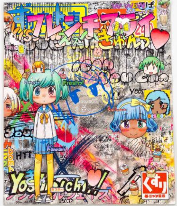
Mr., フレンチフライ | French Fries , 2023. Acrylic, silkscreen print, pen, pencil on paper. 45.3 x 37.8 cm | 17 13/16 x 14 7/8 in. Photo: Yuta Saito. ©2023 Mr./Kaikai Kiki Co., Ltd. All Rights Reserved. Courtesy of the artist and Perrotin.

graffiti writing . Il faut dire que cette internationale n'est pas sans rapports avec l'Otaku: emblématique de l'adolescence, elle est « geek » à sa manière, puisqu'elle s'exerce dans une forme de marginalité et d'entre-soi viril, quitte à susciter l'incompréhension et le rejet. Elle aussi peut se lire comme un genre de pop art, car elle remixe à main levée les cultures de masse nord-américaines - comics et dessins animés, typographies de pochettes de disques et d'albums de bandes dessinées, films de science fiction et séries télévisées... Enfin, elle bénéficie tout autant que l'Otaku d'Internet, qui en a vivifié les formes et la diffusion.