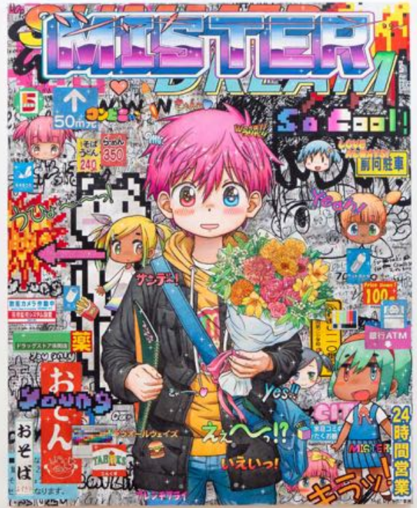
Mr., Happy Birthday to You. , 2023. Acrylic paint and silkscreen print on canvas. 162 x 130 x 5 cm | 63 3/4 x 51 3/16 x 1 15/16 in. Photo: Yuta Saito. ©2023 Mr./Kaikai Kiki Co., Ltd. All Rights Reserved. Courtesy of the artist and Perrotin.