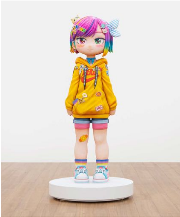
Mr., りさ-パイナップルジュースの午後- | Lisa — A Pineapple Juice Afternoon , 2023. Iron, FRP, urethane paint, acrylic paint, and plywood base with MDF surface finish. 150 × 70 × 70 cm | 59 1/16 × 27 9/16 × 31 1/8 in. Photo: Yuta Saito. ©2023 Mr./Kaikai Kiki Co., Ltd. All Rights Reserved. Courtesy of the artist and Perrotin.

divertissement. Tout en affirmant la légitimité des esthétiques propres aux cultures adolescentes, le Superflat assume l'héritage des maîtres anciens de la peinture et de l'iconographie bouddhique, à commencer par la bidimensionnalité.