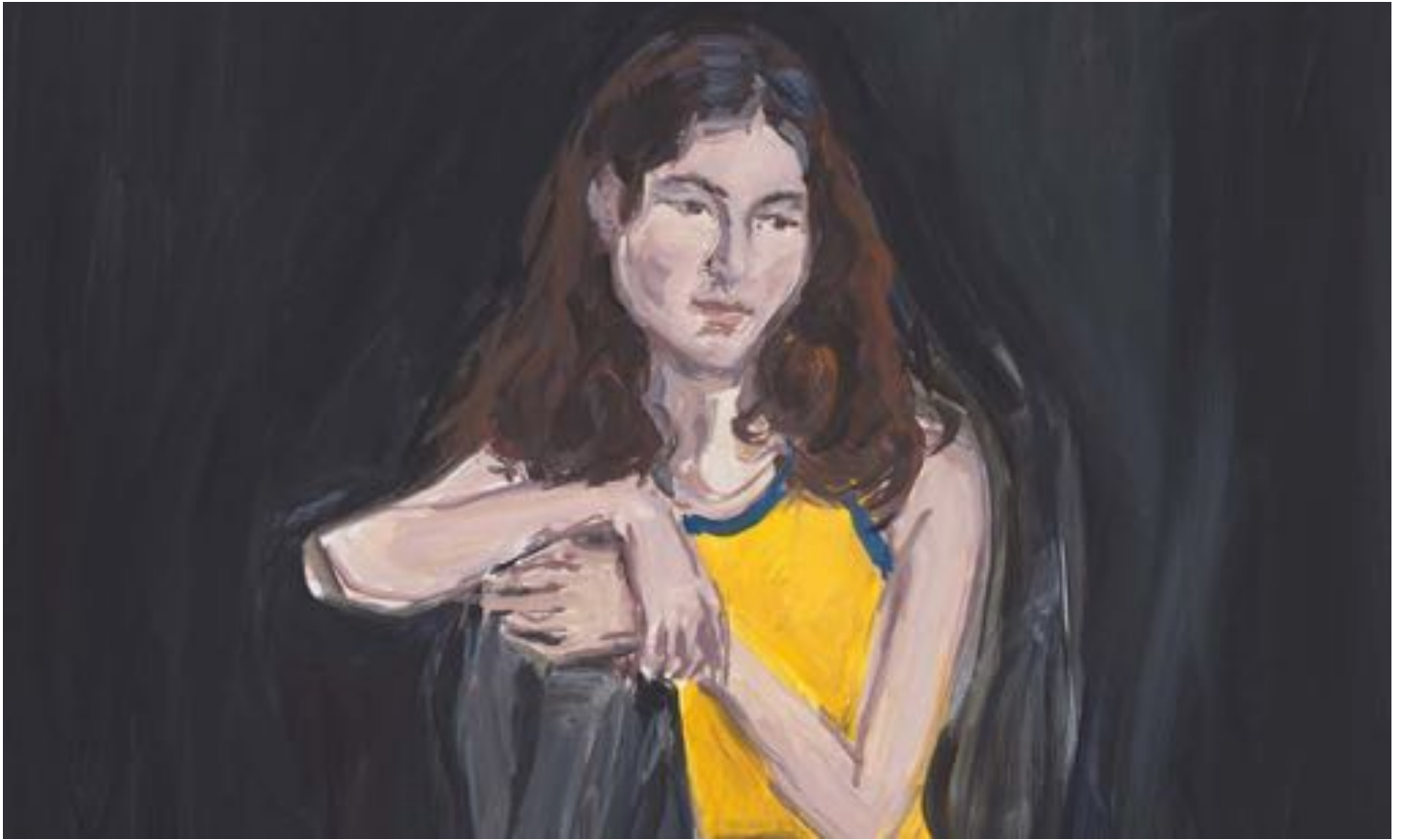
Jean-Philippe Delhomme, Talia (detail), 2023. Oil on canvas, wood frame. Framed: 65 x 54 cm | 25 9/16 x 21 1/4 inch.