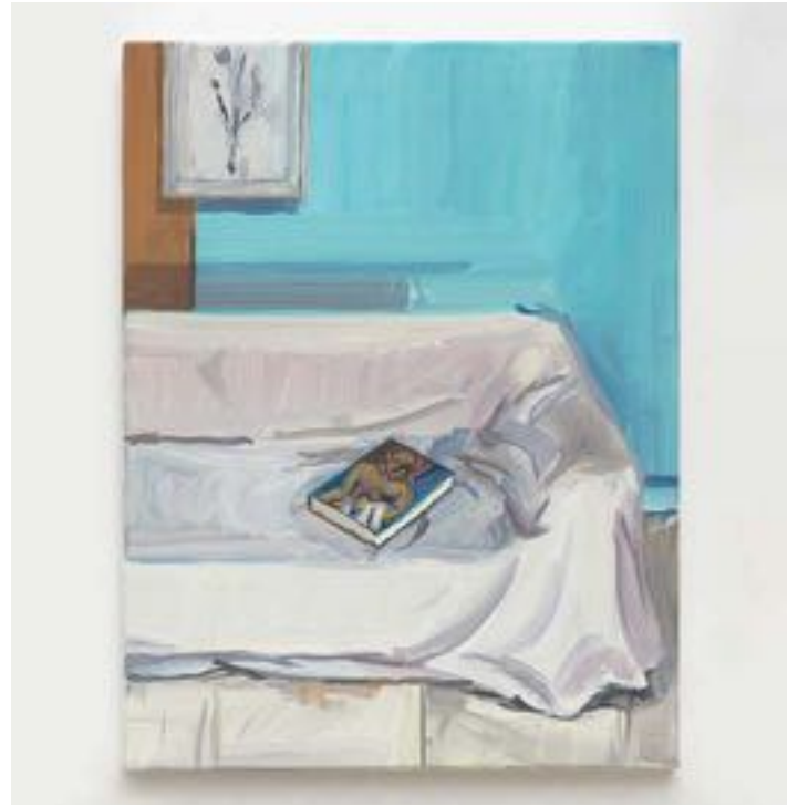
Jean-Philippe Delhomme, Resting Picasso , 2023. Oil on canvas, wood frame. Framed: 39 x 31 cm | 15 3 / 8 x 12 3 / 16 inch. Courtesy of the artist and Perrotin

As a counterpoint to visage(s) at Perrotin, Delhomme will present The Studio , a selection of works displayed in the exhibition space