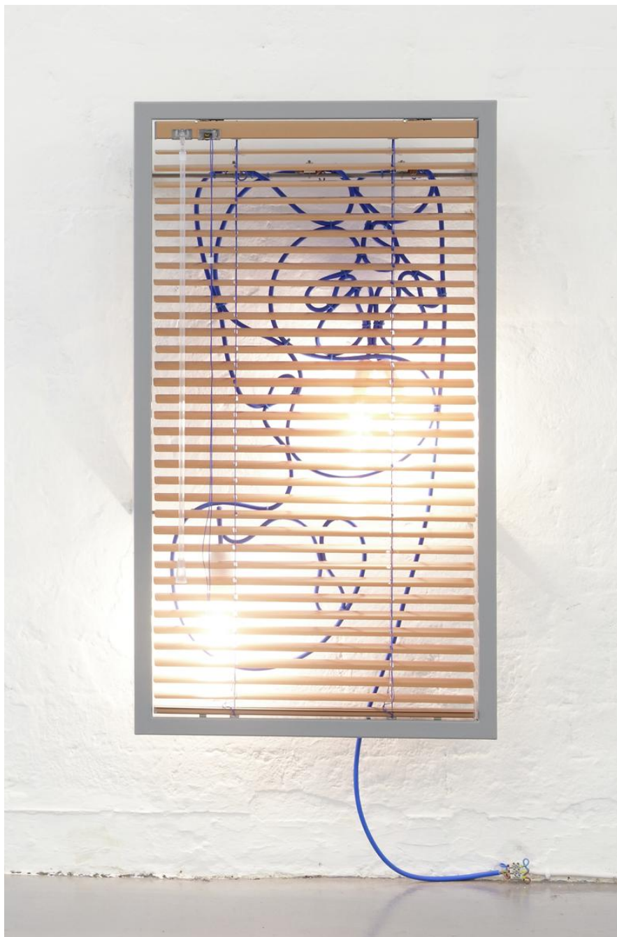
Haegue Yang Manteuffelstrasse 112 - Single and Solid (bathtub radiator) 2010

Aluminum Venetian blinds, powdercoated steel frame, perforated metal plates, light bulbs, cable / Stores vénitiens en aluminium, cadre en acier thermolaqué, plaques de métal perforées, ampoules et câble électrique 87 x 49 x 5 cm