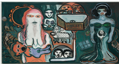
Ya Habibi Ya Eini 2022 oil on canvas 82,5 x 134,5 cm