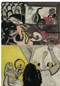
Wanted, Blind, Beloved, in Jail and on the Water 2022 ink, gouache, watercolour, collage, pencil and pen on paper 59,2 x 41,8 cm