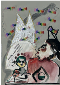
Wanted, Blind, Beloved, in Jail and on the Water 2022 ink, gouache, watercolour, collage, pencil and pen on paper 59,2 x 41,8 cm