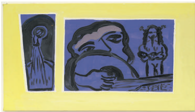
Sheikh Imam as Seen by 2022 oil on canvas 44,5 x 74 cm