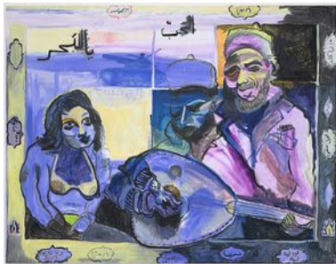
The Sea, in Love; and the Cockroach Sings 2022 oil on canvas 162 x 209 cm