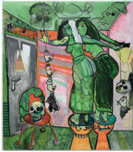
Silicone, Poppies and a Couple of Invisible Deffs 2022 oil on canvas 235 x 206 cm