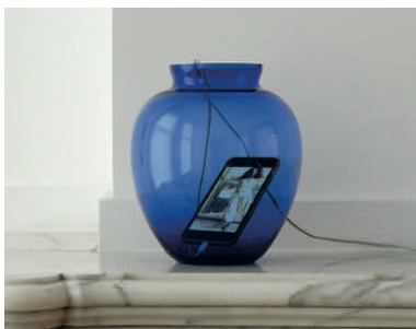
The Un-Musical Vase 2022 video played on old iPhone placed in vase (edition of 5)