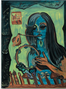
Illuminated Darkness 2022 oil on canvas 97 x 71 cm