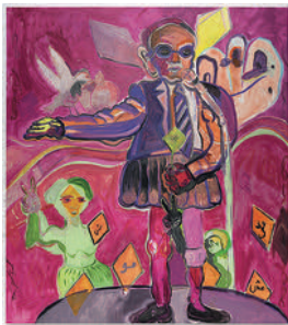
Brown Fish; His Voice 2022 oil on canvas 206 x 183 cm