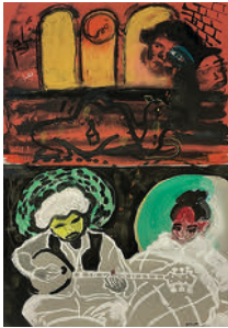
Wanted, Blind, Beloved, in Jail and on the Water 2022 ink, gouache, watercolour, collage, pencil and pen on paper 59,2 x 41,8 cm