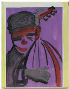
Sheikh Imam as Seen by 2022 oil on canvas 45 x 35 cm