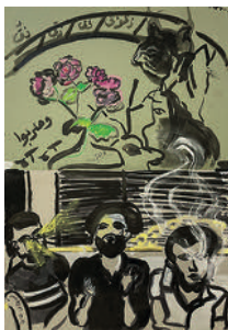
Wanted, Blind, Beloved, in Jail and on the Water 2022 ink, gouache, watercolour, collage, pencil and pen on paper 59,2 x 41,8 cm