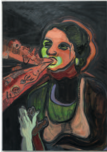
Skulls, Hands and Hearts, in Her Red 2022 oil on canvas 99 x 70 cm