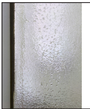
vue de l'exposition Jacob Kassay , Art: Concept, Paris, du 9 mai au 5 juin 2010

Art: Concept a le plaisir d'annoncer la première exposition personnelle de l'artiste Jacob Kassay.