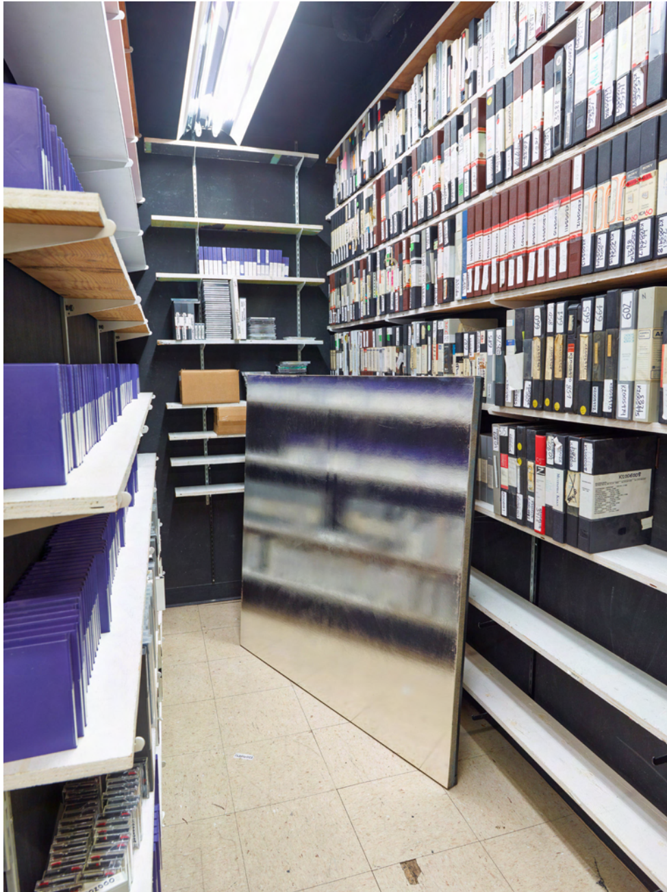
Vue d'exposition // Exhibition view Untitled, (disambiguation)!, The Kitchen, New York, 09.01 - 16.02 2013

Image de presse // Picture for the press