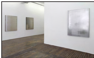
vue de l'exposition Jacob Kassay , Art: Concept, Paris, du 9 mai au 5 juin 2010