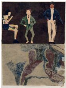
Drunkare (Drunkard) 2022 watercolour and collage on paper 101 x 77 cm