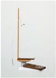
Att sova (To Sleep) 2022 wood, metal hanger, coins, wire, pencil, string instrument 127 x 41 x 97 cm