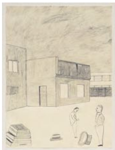
Castor och Pollux (Castor and Pollux) 2022 pencil on paper 64 x 48 cm