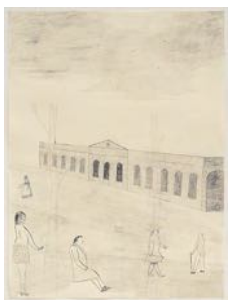
Överstelöjtnant (Lieutenant Colonel) 2022 pencil on paper 64 x 48 cm