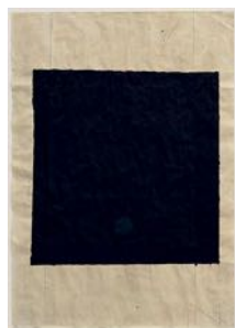
Nattljus (Night Light) 2022 watercolour on paper 99 x 69 cm