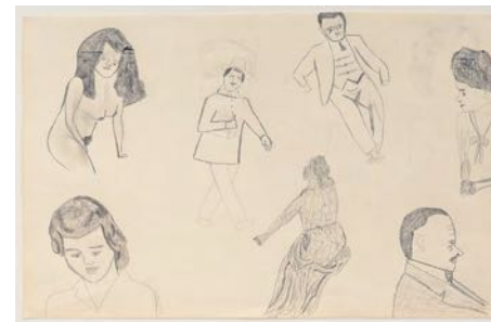
Åskan gick (The Thunder Passed) 2022 pencil on paper 32 x 48 cm