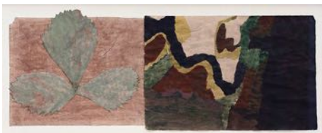
Nere i ängset (Down in the Meadow) 2022 watercolour and collage on paper 47 x 121 cm