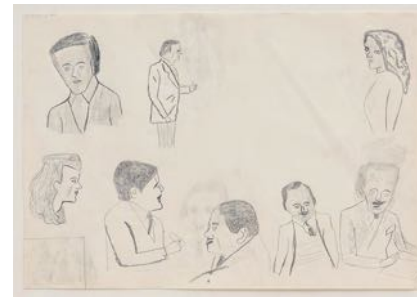
Tjänstemän och affärer (Officials and Deals) 2022 pencil on paper 29 x 42 cm