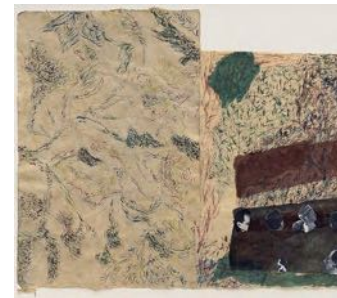
Suset i skogen (Wind in the Forest) 2022 watercolour and collage on paper 77 x 91 cm