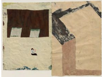
Anläggning (Facility) 2022 watercolour and collage on paper 77 x 100 cm