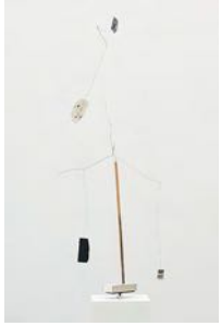
Att komma ihåg (To Remember) 2021 wood, metal hanger, cardboard, wire, matchbox, collage 168 x 79 x 18,5 cm