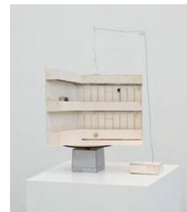
Skolan genom fönstret (School through the Window) 2021 cardboard, wood, metal hanger, wire, eraser, crayon, collage 66 x 45 x 38 cm