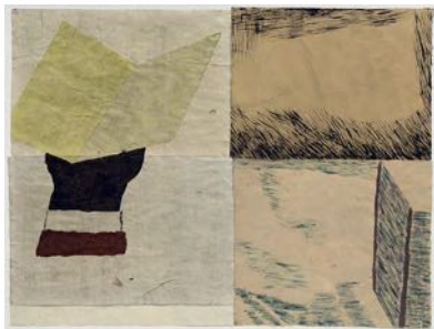
Här (Here) 2022 watercolour and collage on paper 96,5 x 127 cm