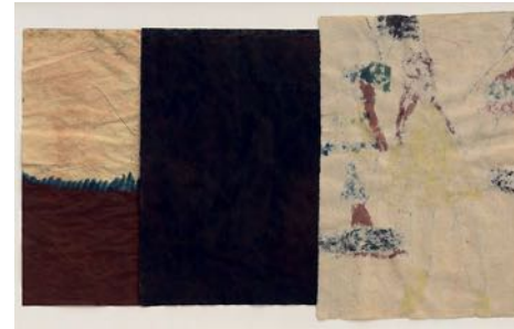
Hundarna sover (Dogs Are Sleeping) 2022 watercolour on paper 76 x 122,5 cm