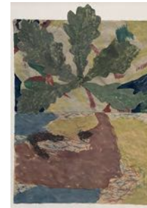
Ek (Oak) 2022 watercolour and collage on paper 109 x 76,5 cm