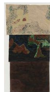
Ängen (The Meadow) 2022 watercolour on paper 145 x 76 cm