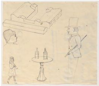
En försvunnen egendom (A Lost Property) 2022 pencil on paper 44 x 51 cm