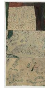
Historien från skogen (The Story from the Forest) 2022 watercolour on paper 150,5 x 76 cm