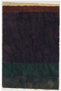
Thousand Belongs to the Night 2022 watercolour on paper 66 x 44 cm