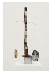
Stora salen (The Main Hall) 2021 matchboxes, coins, cardboard, wire, collage 75 x 47 x 25,5 cm