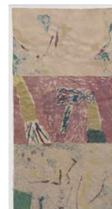
Fodret i min jacka (The Lining of My Jacket) 2022 watercolour on paper 150,5 x 77 cm