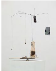
Önskebrunn (Wishing Well) 2021 coins, cardboard, wire, metal hanger, collage 76 x 70 x 45 cm