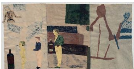
Apotek (Pharmacy) 2022 watercolour and collage on paper 77 x 150 cm