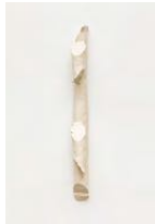
Untitled 2022 oil on bronze 46,2 x 4,2 x 6,8 cm unique in a series of 2