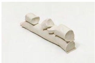
Untitled 2022 oil on bronze 60 x 10 x 15,5 cm unique in a series of 2