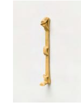
Untitled 2022 oil on bronze 42,3 x 4 x 7 cm unique in a series of 2