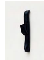
Untitled 2022 oil on bronze 25 x 4 x 7 cm unique in a series of 2