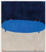
Untitled 2022 oil on linen 170,5 x 150,5 cm