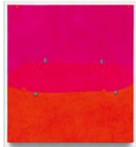
Untitled 2022 oil on linen 55 x 50 cm