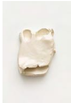
Untitled 2022 oil on bronze 16,5 x 12 x 6 cm unique in a series of 2