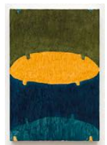
Untitled 2022 oil on linen 25 x 17 cm