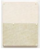
Untitled 2022 oil on linen 32 x 25 cm