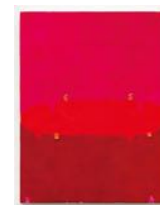
Untitled 2022 oil on linen 32 x 24 cm