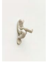
Untitled 2022 oil on bronze 10 x 3 x 9 cm unique in a series of 2