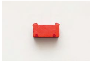
Untitled 2022 oil on wood 2,3 x 4,7 x 2 cm