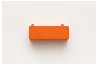
Untitled 2022 oil on wood 3,8 x 11,6 x 3,5 cm