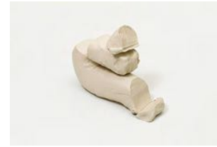
Untitled 2022 oil on bronze 36 x 13,5 x 30,5 cm unique in a series of 2