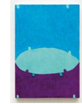
Untitled 2022 oil on linen 25 x 17 cm