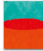
Untitled 2022 oil on linen 170,5 x 150,5 cm