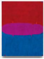
Untitled 2022 oil on linen 60 x 45,5 cm