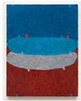
Untitled 2022 oil on linen 31 x 24 cm