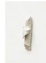
Untitled 2022 oil on bronze 13 x 3 x 4,2 cm unique in a series of 2