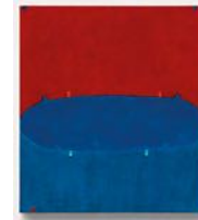
Untitled 2022 oil on linen 55 x 50 cm