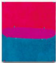
Untitled 2022 oil on linen 55 x 50 cm