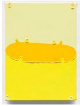
Untitled 2022 oil on linen 22 x 16 cm