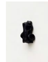
Untitled 2022 oil on bronze 8 x 3,5 x 4 cm unique in a series of 2