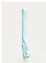
Untitled 2022 oil on bronze 25 x 3 x 4 cm unique in a series of 2