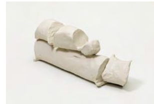
Untitled 2022 oil on bronze 58 x 29 x 23 cm unique in a series of 2