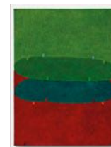
Untitled 2022 oil on linen 60 x 45,5 cm