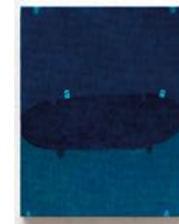
Untitled 2022 oil on linen 32 x 25 cm