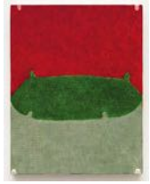
Untitled 2022 oil on linen 32 x 25 cm