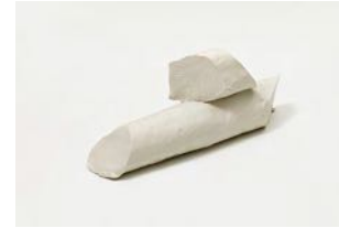
Untitled 2022 oil on bronze 55 x 20 x 12,5 cm unique in a series of 2