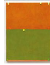
Untitled 2022 oil on linen 32 x 25 cm