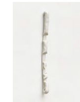
Untitled 2022 oil on bronze 45,5 x 4 x 3,5 cm unique in a series of 2