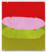
Untitled 2022 oil on linen 170,5 x 150,5 cm