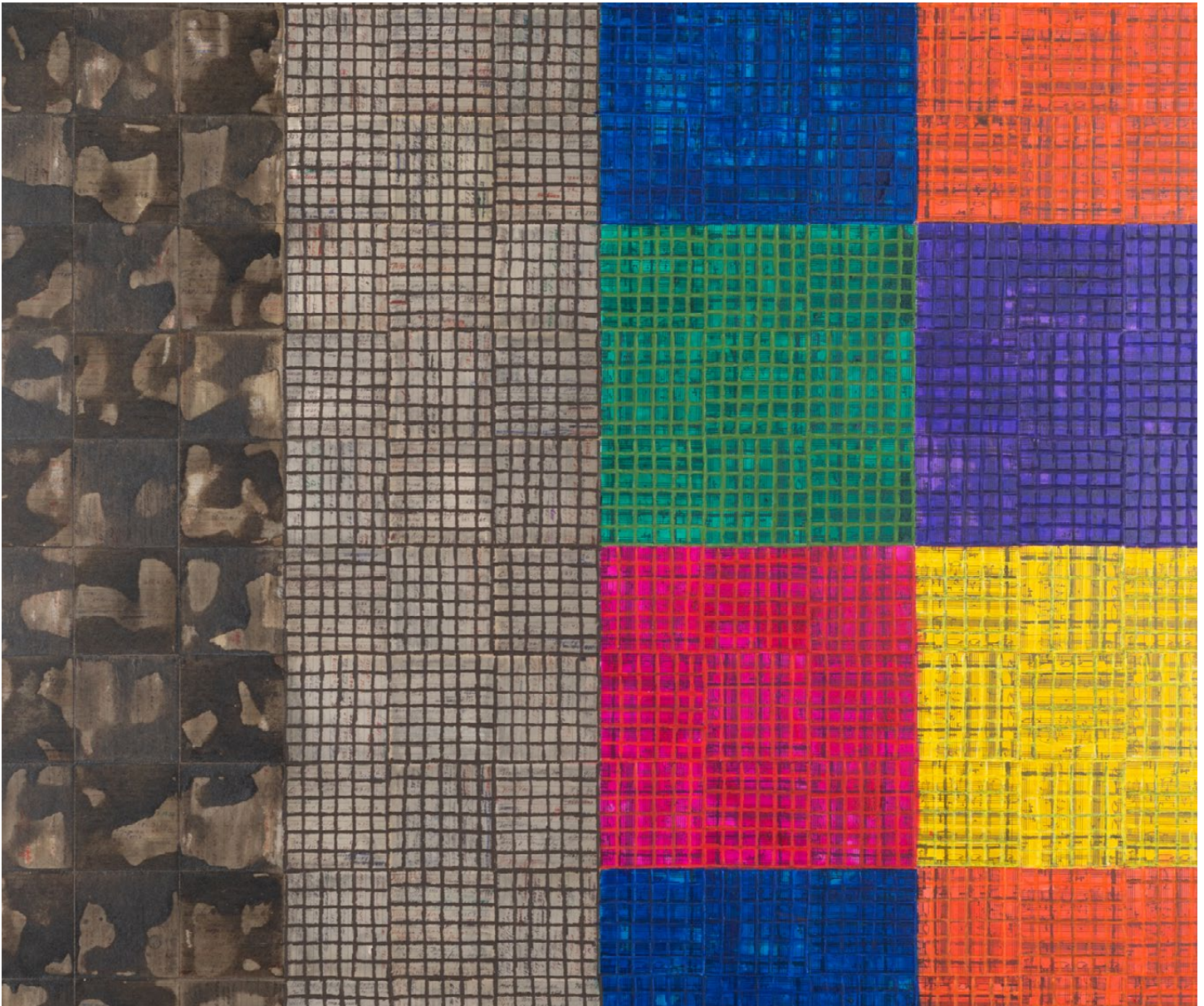
McArthur Binion, DNA:Study/(Visual:Ear) , 2022. Ink, paint stick and paper on board, 72 x 48 inches (182.9 x 121.9 cm)

맥아서 비니언 《DNA:Study/(Visual:Ear)》 2022년 9월 1일 - 10월 22일 리만머핀 서울