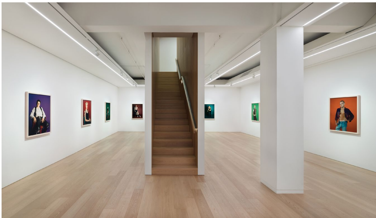
Lehmann Maupin Seoul, 2022.