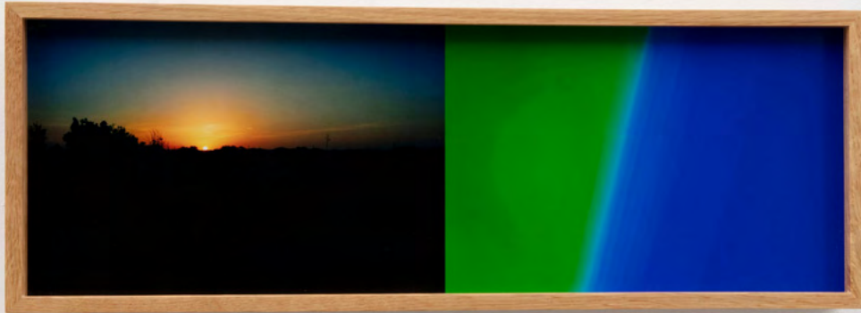
Leslie Hewitt, Daylight/Daylong 007 , 2021. Digital chromogenic print. 16.8 × 52.1 cm | 6 5/8 × 20 1/2 in.