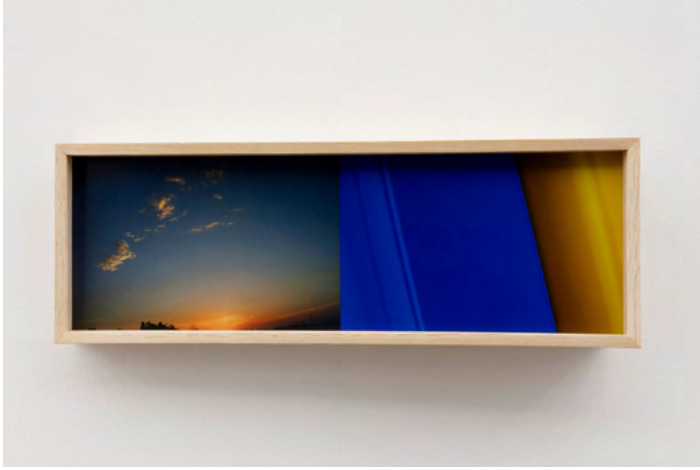
Leslie Hewitt, Daylight/Daylong 002 , 2021. Digital chromogenic print. 18.4 × 51.8 × 10.2cm | 7 1/4 × 20 3/8 × 4 in.