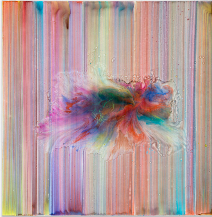
Ader, 2022. Acrylic and resin on canvas. 160 x 157 cm | 63 x 61 13/16 inch.