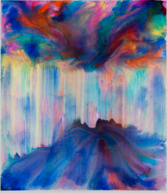
Iseg, 2022. Acrylic and resin on canvas. 160×140 cm | 63×55 1/8 inch.