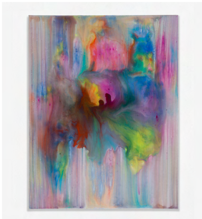
Kova, 2022. Acrylic and resin on canvas. 110 × 85 cm | 43 5/16 × 33 7/16 inch.

즐겁다. 특히 이번 신작을 마주했을 때는 그야말로 눈이 번쩍 뜨이고 후두엽(occipital lobe)이 각성된 듯 느껴졌다. 그리고 이번엔 우리가 주목해야 할 프리츠만의 새로운 회화 실험은 추상에서 시각뿐만 아니라 촉각과 청각이 동시에 자극받을 가능성이라고 확신했다. 그런 의미에서 곧 프리츠의 추상화를 감상할 당신에게 특별히 권하고 싶다. '그림을 본다'는 고정관념에서 자유로워질 것을 말이다. 그럴 수 있다면 당신은 더 큰 그림의 세계, 당신의 감각이 별떡별떡 숨 쉬고 더 깊고 풍부하게 숨을 뿔어낼 수 있는 미의 고원을 만날 것이다. 물론 쉬운 일이 아니다. 고정관념이란 단지 사고의 경직만이 아니라 취향과 감각이 특정 경향으로 편향된 결과니 말이다. '보는 대로 믿기' 와 그 역인 '믿는 대로 보기'가 (Seeing is believing, believing is seeing.) 둘 다 맞는 말인 이유다. 그런데 예술은 그렇게 벗어나기 어려운 고정관념에서 해방될 수 있는 거의 유일한 영역이다. 무려 40년이 훌쩍 넘는 긴 세월 동안 프리츠가 추상화를 그려온 근본 동력, 하지만 매년 새로운 창작의 들판을 거닐어온 메커니즘이 또한 그렇다.