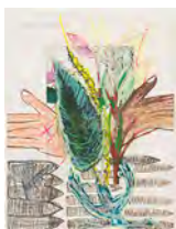
Chaine Humaine 2022 36,5 x 27,5 cm wax pastel and coloured pencil on paper