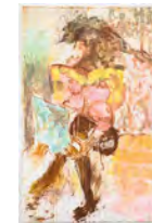
Le jour se lève: Double Check 2021 211 x 136,5 cm acrylic and pigment on canvas