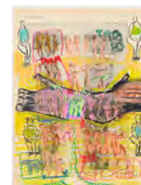
Chaine Humaine 2022 36,5 x 27,5 cm wax pastel and coloured pencil on paper