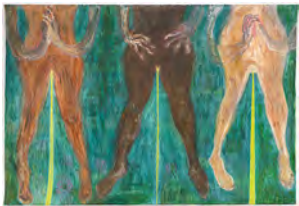
Le jour se lève: The Mutants 2021 138 x 203 cm acrylic and pigment on canvas