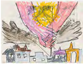
Chaine Humaine 2022 27,5 x 36,5 cm wax pastel and coloured pencil on paper