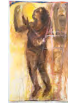
Le jour se lève: Unfinished 2021 211 x 135,5 cm acrylic and pigment on canvas