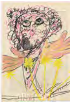
Chaine Humaine 2022 36,5 x 27,5 cm wax pastel and coloured pencil on paper