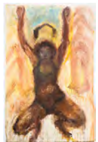
Le jour se lève: Body Archive 2021 210 x 135,5 cm acrylic and pigment on canvas