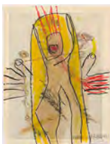
Chaine Humaine 2022 36,5 x 27,5 cm wax pastel, grease and coloured pencil on paper