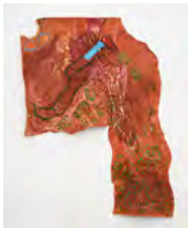
Disconnection 2019 197 x 152 cm acrylic on used tarpaulin from Lubumbashi