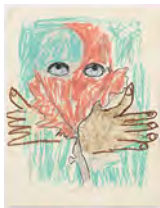
Chaine Humaine 2022 36,5 x 27,5 cm wax pastel and coloured pencil on paper