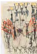
Chaine Humaine 2022 36,5 x 27,5 cm wax pastel and coloured pencil on paper