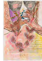
Chaine Humaine 2022 55 x 36,5 cm wax pastel and coloured pencil on paper