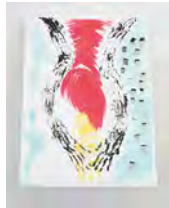
The Holes 2021 - 2022 107,5 x 79,4 cm acrylic, pigment and wax on recycled paper