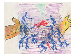
Chaine Humaine 2022 27,5 x 36,5 cm wax pastel and coloured pencil on paper