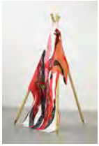
Care 2019 - 2020 243,5 x 175 cm embroidery on flour sack