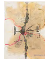
Chaine Humaine 2022 36,5 x 27,5 cm wax pastel, grease and coloured pencil on paper