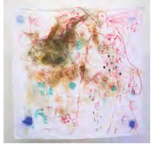
Un-Masking in the Plural #Moulting 2017 240 x 240 cm pigment and mixed media on canvas