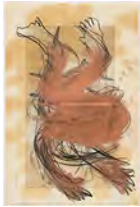
Chaine Humaine 2022 55 x 36,5 cm wax pastel, grease and coloured pencil on paper