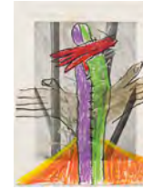
Chaine Humaine 2022 36,5 x 27,5 cm wax pastel and coloured pencil on paper