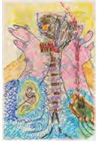
Chaine Humaine 2022 55 x 36,5 cm wax pastel and coloured pencil on paper