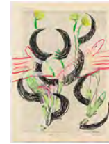
Chaine Humaine 2022 36,5 x 27,5 cm wax pastel and coloured pencil on paper