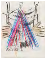
Chaine Humaine 2022 36,5 x 27,5 cm wax pastel and coloured pencil on paper