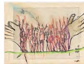
Chaine Humaine 2022 27,5 x 36,5 cm wax pastel and coloured pencil on paper