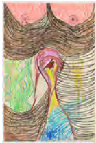
Chaine Humaine 2022 55 x 36,5 cm wax pastel and coloured pencil on paper