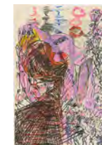
Chaine Humaine 2022 55 x 36,5 cm wax pastel and coloured pencil on paper