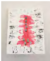
The Holes 2021 - 2022 107,5 x 79,4 cm pigment and wax on recycled paper