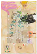
Chaine Humaine 2022 55 x 36,5 cm wax pastel, grease and coloured pencil on paper