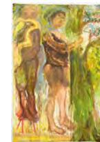
Le jour se lève: Ritual & Green 2021 204 x 139 cm acrylic and pigment on canvas