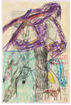
Chaine Humaine 2022 55 x 36,5 cm wax pastel and coloured pencil on paper