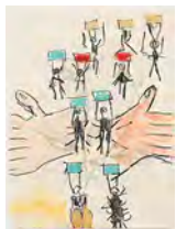
Chaine Humaine 2022 36,5 x 27,5 cm wax pastel and coloured pencil on paper