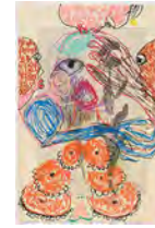
Chaine Humaine 2022 55 x 36,5 cm wax pastel and coloured pencil on paper