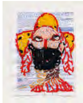
Care 2020 16,5 x 12 cm embroidery on medical leaflet