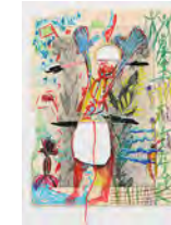
Chaine Humaine 2022 36,5 x 27,5 cm wax pastel, wool and coloured pencil on paper