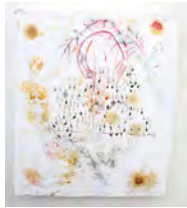
Un-Masking in the Plural #Moulting 2017 250 x 211 cm pigment and mixed media on canvas