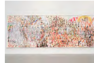
Pourquoi je ne bande plus dit le vieil homme à son médecin 2009 219 x 615 cm acrylic and pigment on canvas