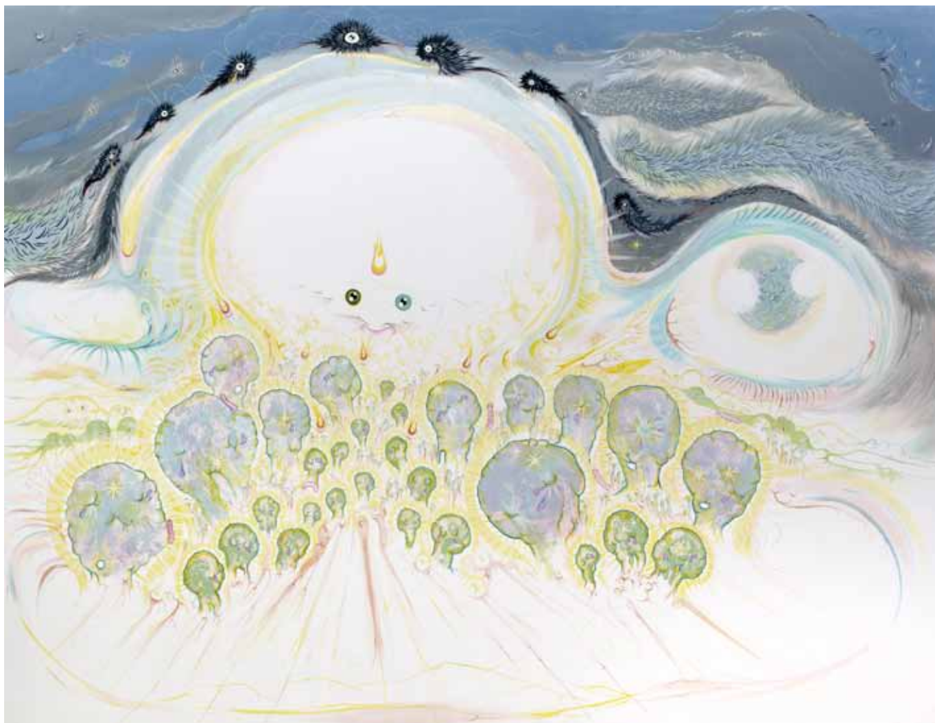
De l'amour avec du poil autour , 2012, acrylique & huile sur toile, 90 x 120 cm