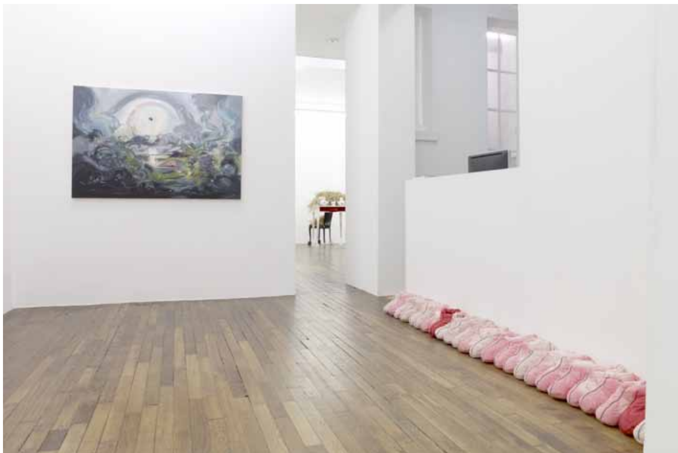
vue de l'exposition I'm in Love with the New World , Art:Concept, Paris, du 12 janvier au 16 février 2013 exhibition view I'm in Love with the New World , Art:Concept, Paris, from January 12th to February 16th 2013