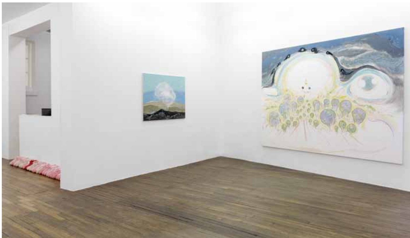
vue de l'exposition I'm in Love with the New World , Art:Concept, Paris, du 12 janvier au 16 février 2013 exhibition view I'm in Love with the New World , Art:Concept, Paris, from January 12th to February 16th 2013