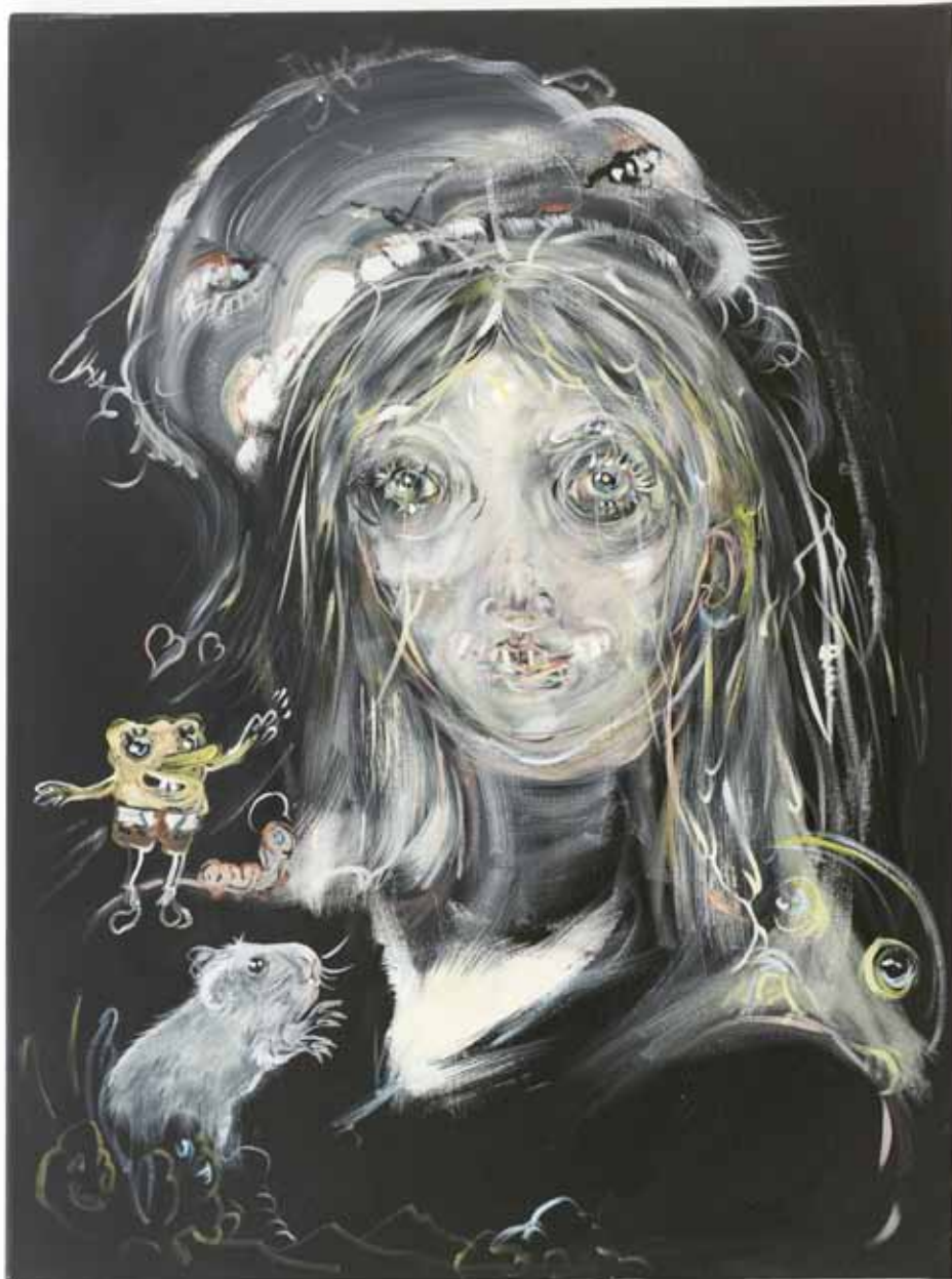
Selfportrait (Avidya) , 2012, acrylique & huile sur toile, 80 x 60 cm