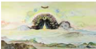
Playful Flame 2012 Acrylique et huile sur toile Acrylic and oil on canvas 90 x 180 cm

A more Lewis Carrollish installation, reminds us of the Mad Hatter's cluttered table: Here Vidya disseminates painted teapots and objects, she arranges them to create a hilarious and foamy apparition. These humanized objects, permeated with a certain cartoonish surrealism, remind us of Disney's animated objects. They abound, parade and constitute a universe on the edge of reality; riveted to an existing yet weird temporality.