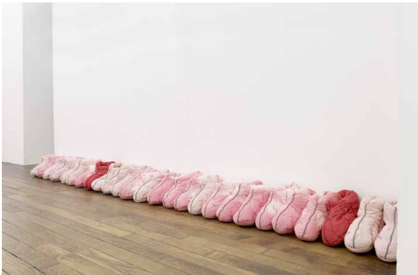
Les invités (avant) , 2013, chaussons brodés, coton, fibres de polyester, 20 x 280 x 30 cm