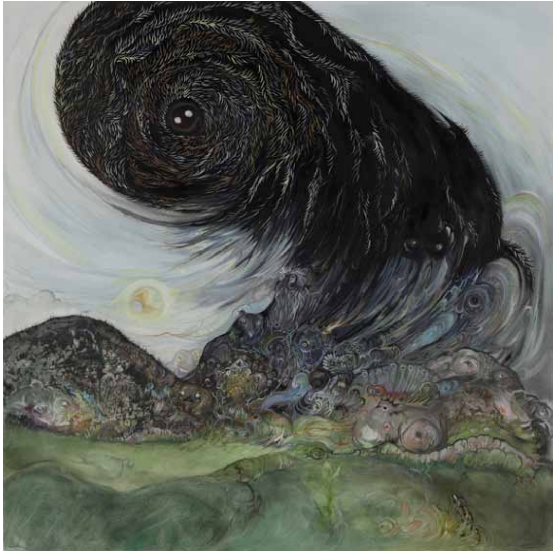
Rainbow Gathering , 2012, huile sur toile, 80 x 80 cm Rainbow Gathering , 2012, oil on canvas, 31 1/2 x 31 1/2 in