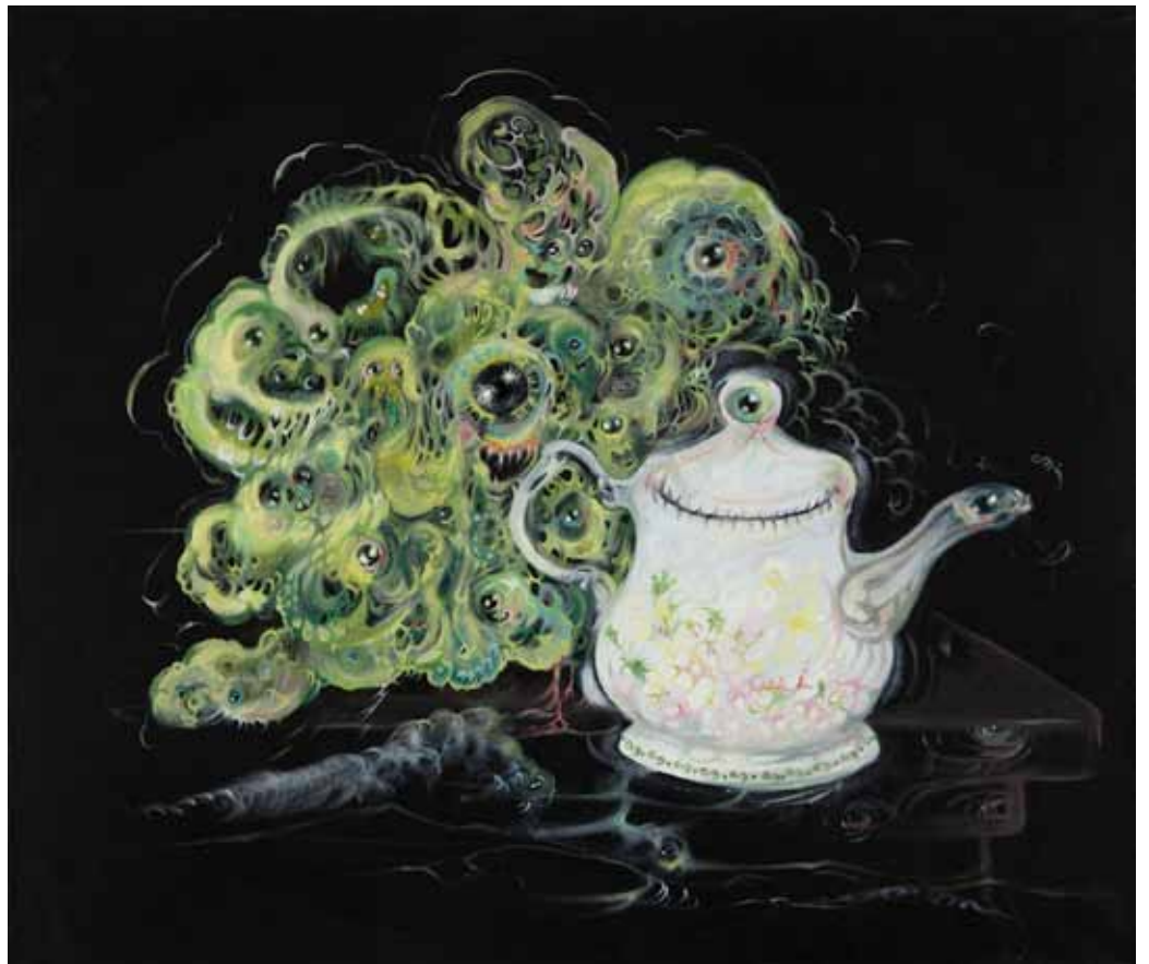
Teapot, salad, poltergeist 2012 Huile sur toile Oil on canvas 60 x 70 cm

Images de presse // Pictures for the press