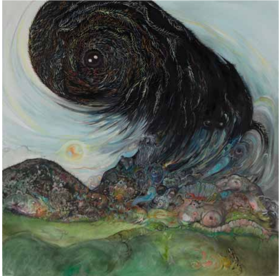
Rainbow Gathering 2012 Huile sur toile Oil on canvas 80 x 80 cm