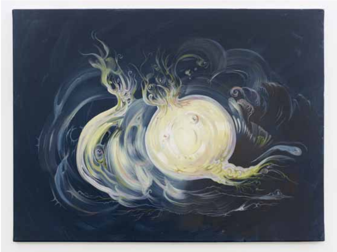
Pleurer de rire , 2012, acrylique & huile sur toile, 60 x 80 cm