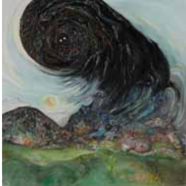
Rainbow Gathering 2012 Huile sur toile Oil on canvas 80 x 80 cm

The End of the World, the Apocalypse, and a subsequent renewal and renaissance through non-duality are a few insights proposed by Vidya Gastaldon. On occasion of her third solo exhibition at Art: Concept. Inspired and amused by ideas of planetary annihilation that often border on intellectual catastrophe and collective panic, she has projected her imagination on what the new world could really look like and translated her ideas into a new series of paintings and installations.