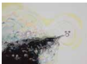
Le prochain portail 2012 Huile sur toile Oil on canvas 180 x 250 cm

Une autre installation plus Lewis Carrollienne, rappelle la table envahie du Chapelier Fou, Vidya Gastaldon essaime des théières, des objets peints qui s'organisent sous nos yeux en une apparition hilare et mousseuse. Ces objets humanisés, imprégnés d'un certain surréalisme cartoonnesque, rappellent les objets animés de Disney. Ils abondent, défilent et créent un univers en marge du réel ancré dans une temporalité à part mais existante.