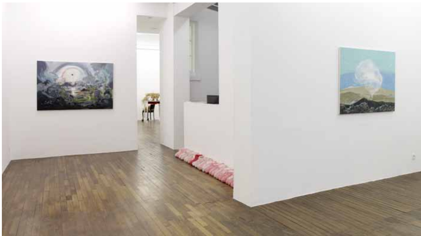
vue de l'exposition I'm in Love with the New World , Art:Concept, Paris, du 12 janvier au 16 février 2013 exhibition view I'm in Love with the New World , Art:Concept, Paris, from January 12th to February 16th 2013