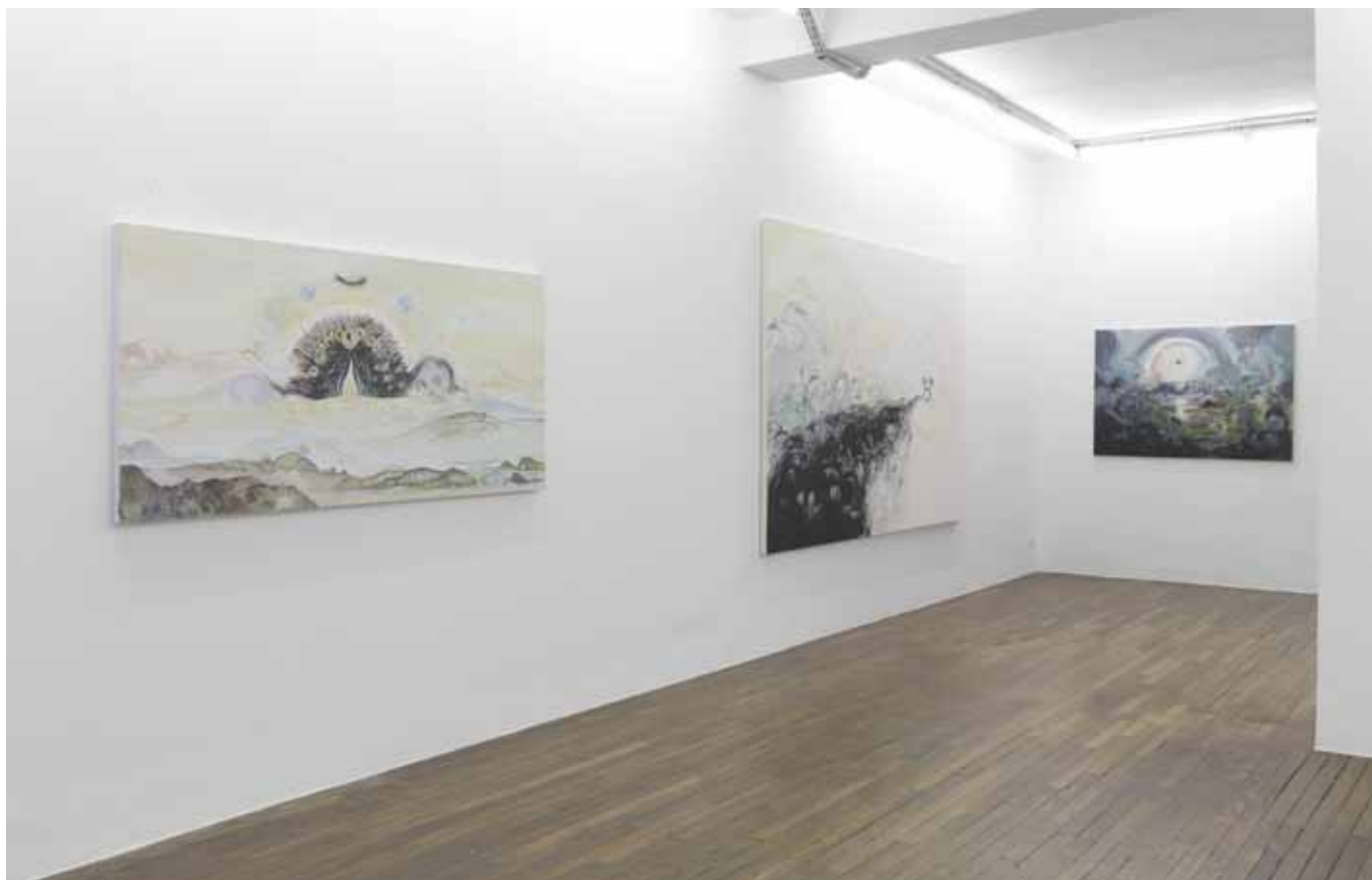
vue de l'exposition I'm in Love with the New World , Art:Concept, Paris, du 12 janvier au 16 février 2013 exhibition view I'm in Love with the New World , Art:Concept, Paris, from January 12th to February 16th 2013