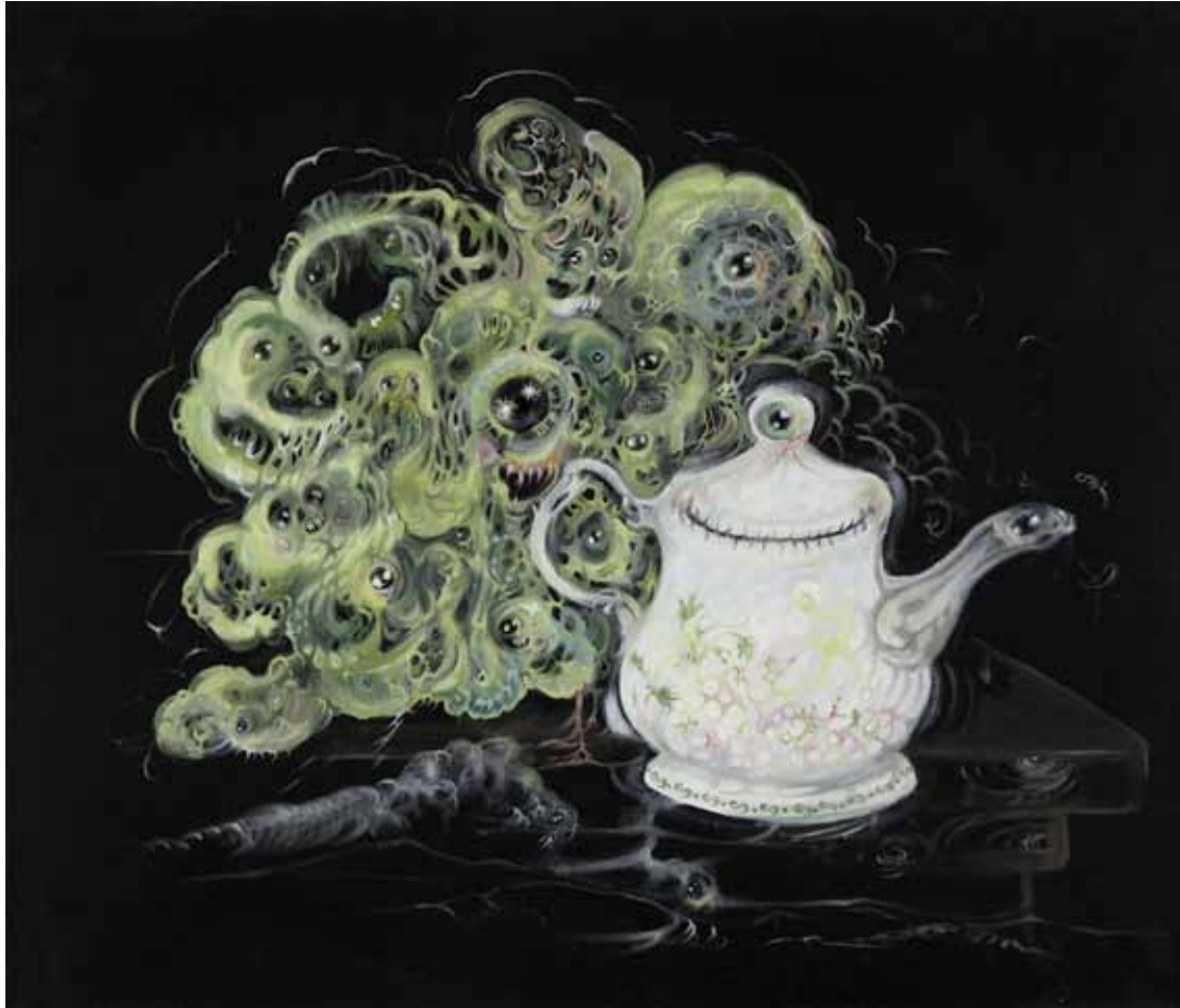
Teapot, salad, poltergeist , 2012, huile sur toile, 60 x 70 cm