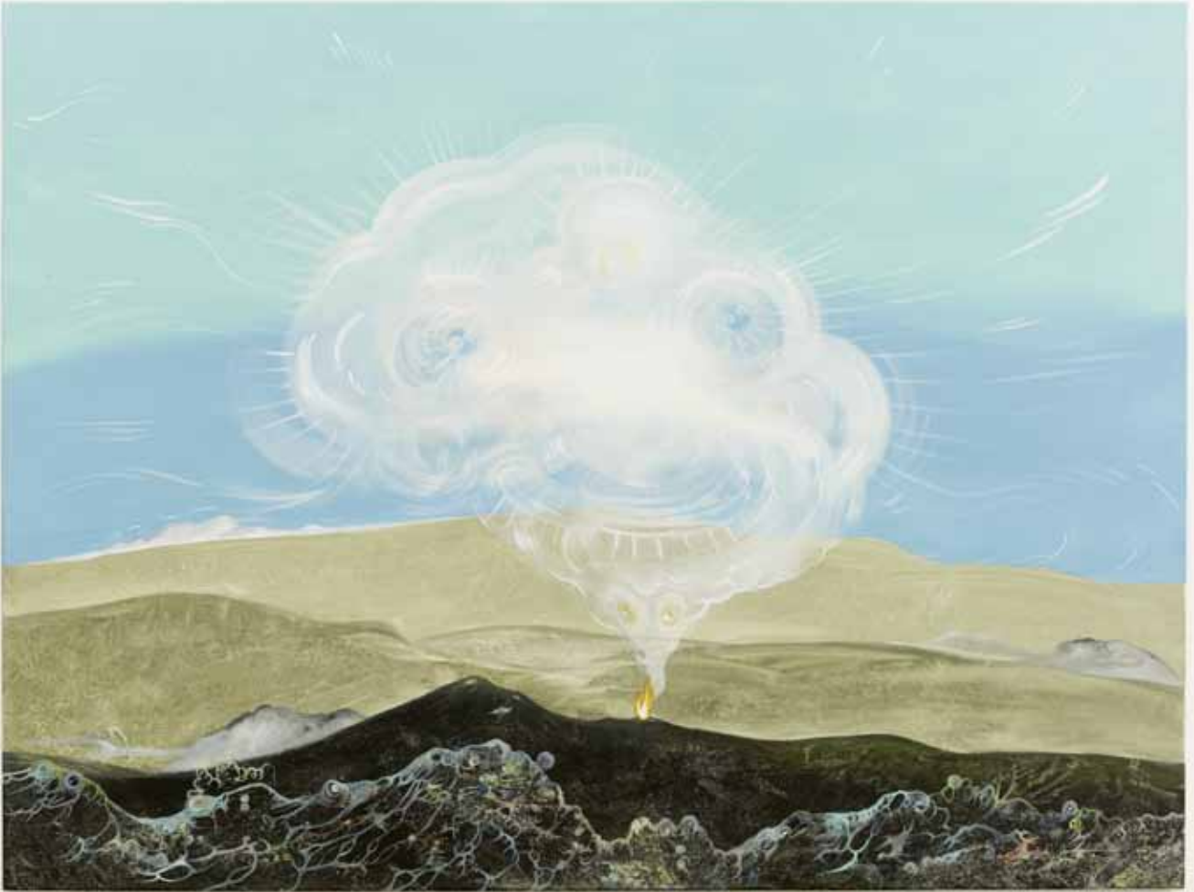
De l'amour avec du poil autour , 2012, acrylique & huile sur toile, 90 x 120 cm