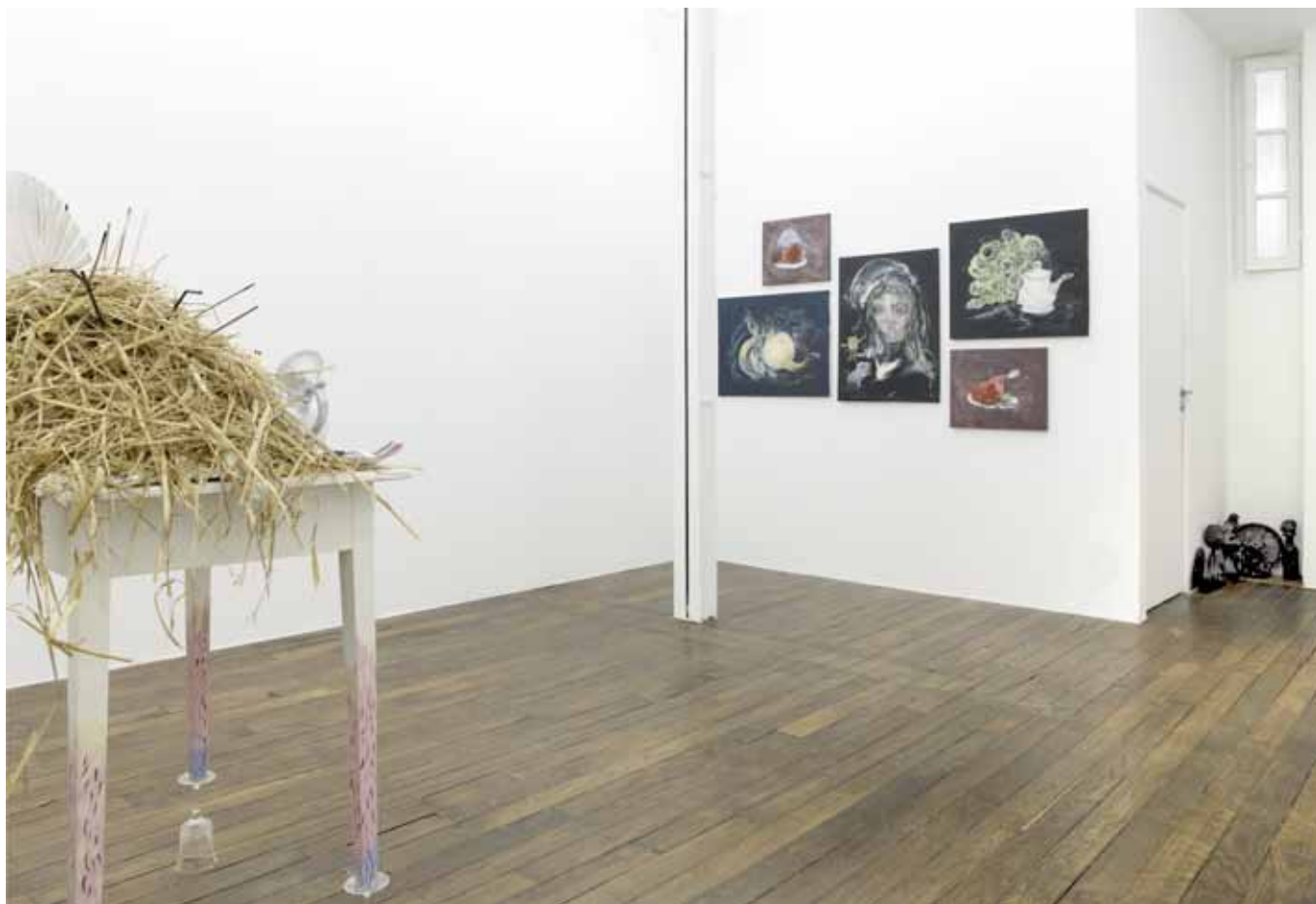
vue de l'exposition I'm in Love with the New World , Art:Concept, Paris, du 12 janvier au 16 février 2013 exhibition view I'm in Love with the New World , Art:Concept, Paris, from January 12th to February 16th 2013