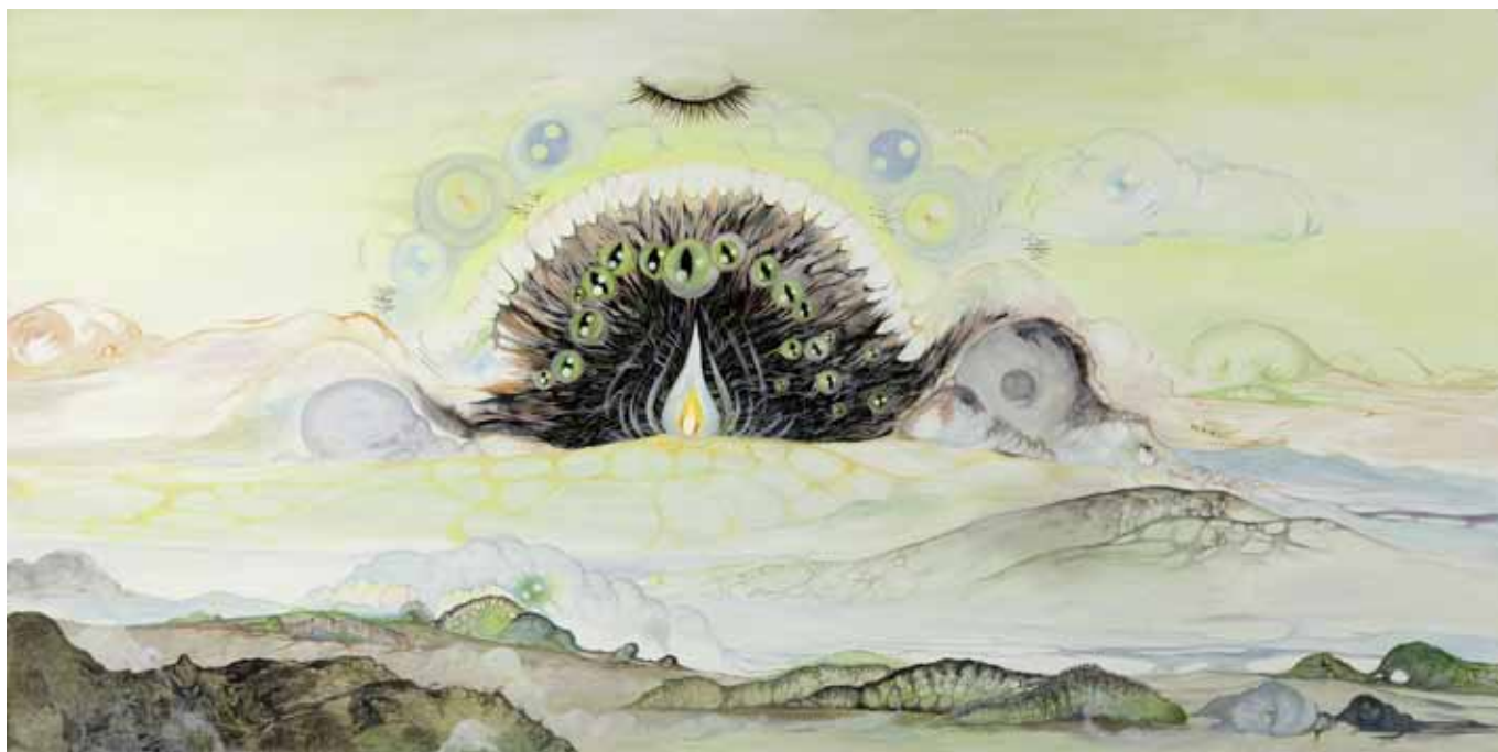
Playful Flame , 2011, acrylique & huile sur toile, 90 x 180 cm