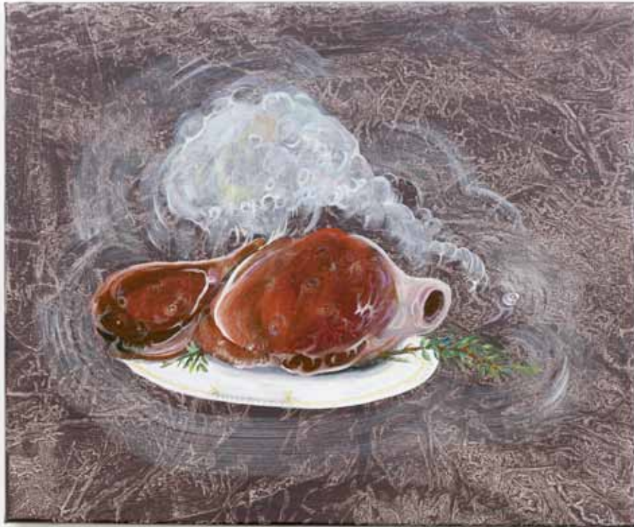
Côtes de boeuf, Romarin, Poltergeist , 2012, acrylique & huile sur toile, 38 x 46 cm Côtes de boeuf, Romarin, Poltergeist , 2012, acrylic & oil on canvas, 15 x 18 1/8 in