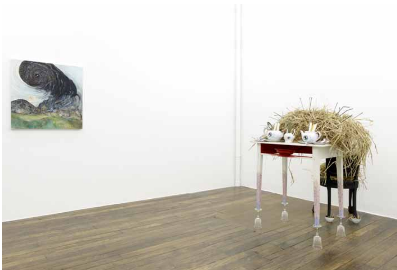
vue de l'exposition I'm in Love with the New World , Art:Concept, Paris, du 12 janvier au 16 février 2013 exhibition view I'm in Love with the New World , Art:Concept, Paris, from January 12th to February 16th 2013