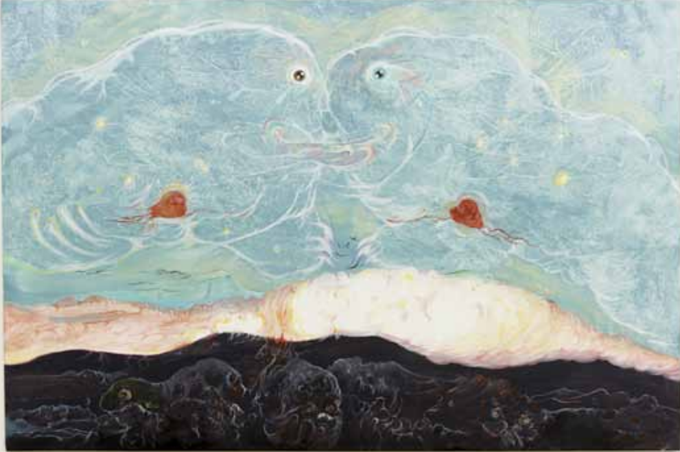
Le champs des possibles , 2012, acrylique & huile sur toile, 100 x 150 cm Le champs des possibles , 2012, acrylic & oil on canvas, 39 3/8 x 59 in