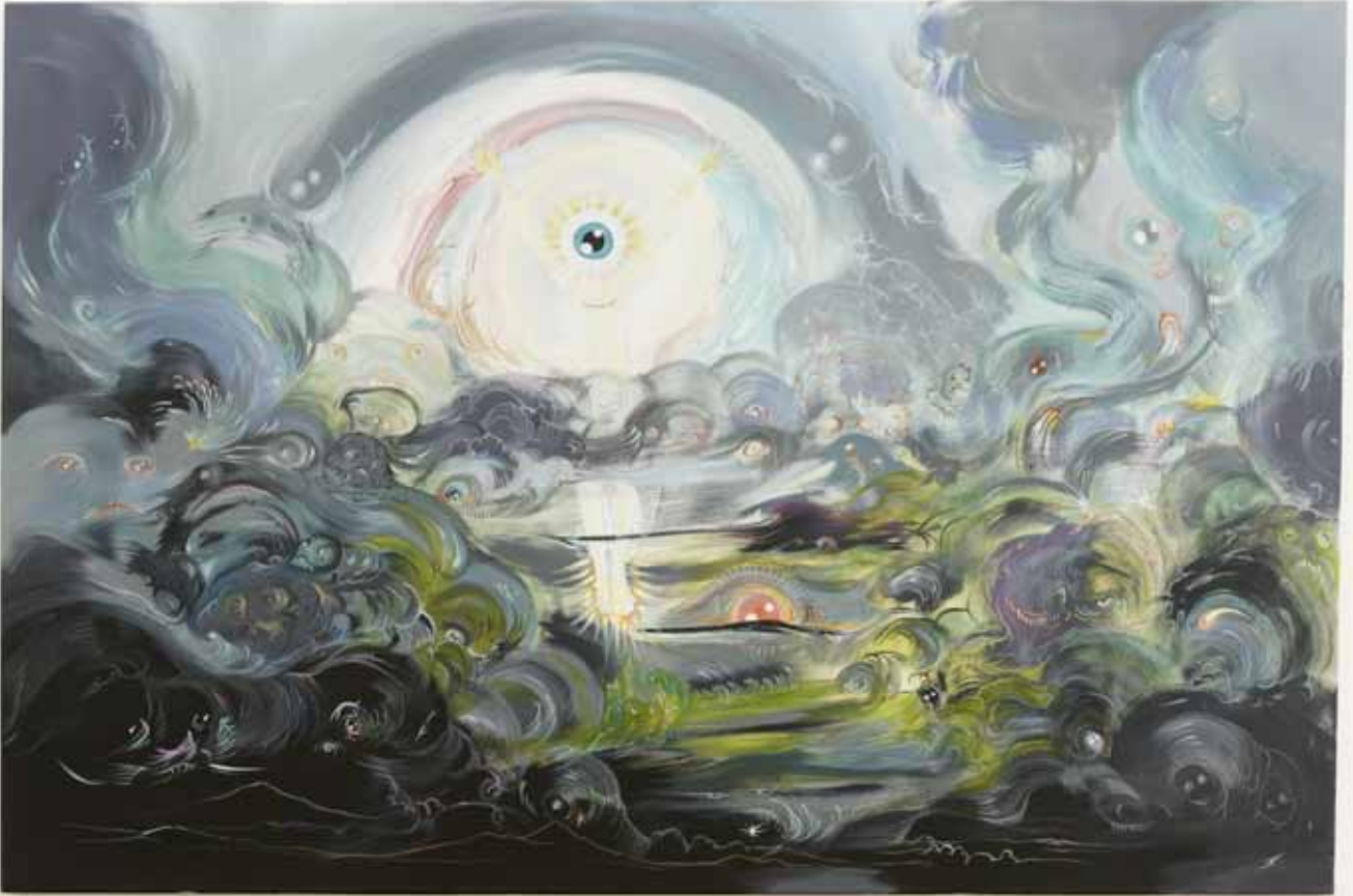
L'ange de l'apocalypse (d'après Danby) , 2012, acrylique & huile sur toile, 100 x 150 cm L'ange de l'apocalypse (d'après Danby) , 2012, acrylic & oil on canvas, 39 3/8 x 59 in