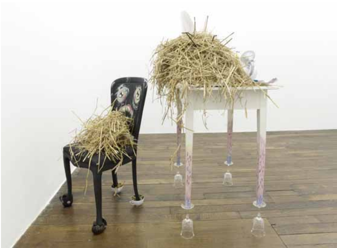
Let it god (Santa Table) , 2013, techniques mixtes, dimensions variables