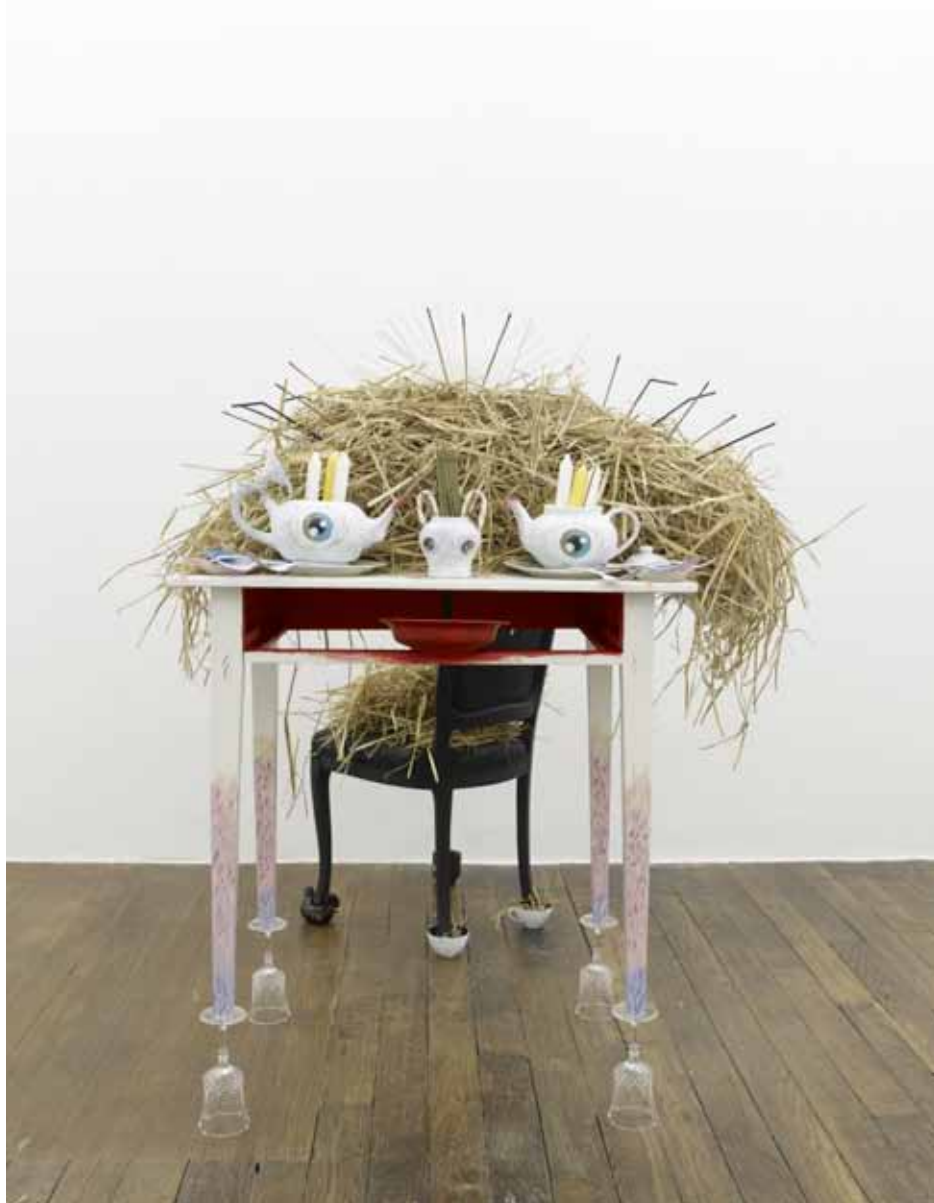
Let it god (Santa Table) , 2013, techniques mixtes, dimensions variables