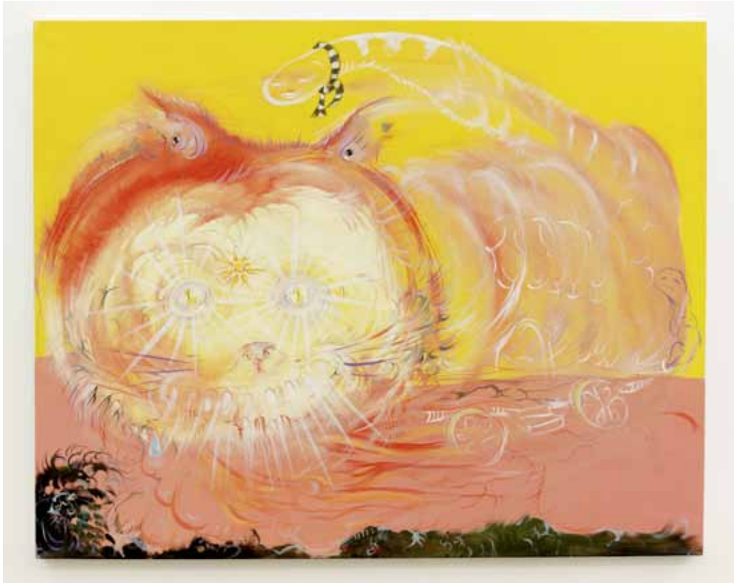
Oubliez le Chat , 2012, acrylique & huile sur toile, 80 x 100 cm Oubliez le Chat , 2012, acrylic & oil on canvas, 31 1/2 x 39 3/8 in