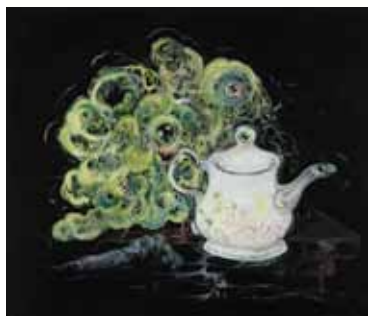
Teapot, salad, poltergeist 2012 Huile sur toile Oil on canvas 60 x 70 cm

Fin du monde, Apocalypse puis renouveau, renaissance et non-dualité sont quelques unes des réflexions proposées par Vidya Gastaldon pour sa troisième exposition personnelle à la galerie Art : Concept. Inspirée et amusée par les idées d'anéantissement planétaire frôlant parfois la catastrophe intellectuelle et la panique collective, elle s'est projeté sur ce que pourrait être ce nouveau monde en proposant une nouvelle série de peintures et installations.