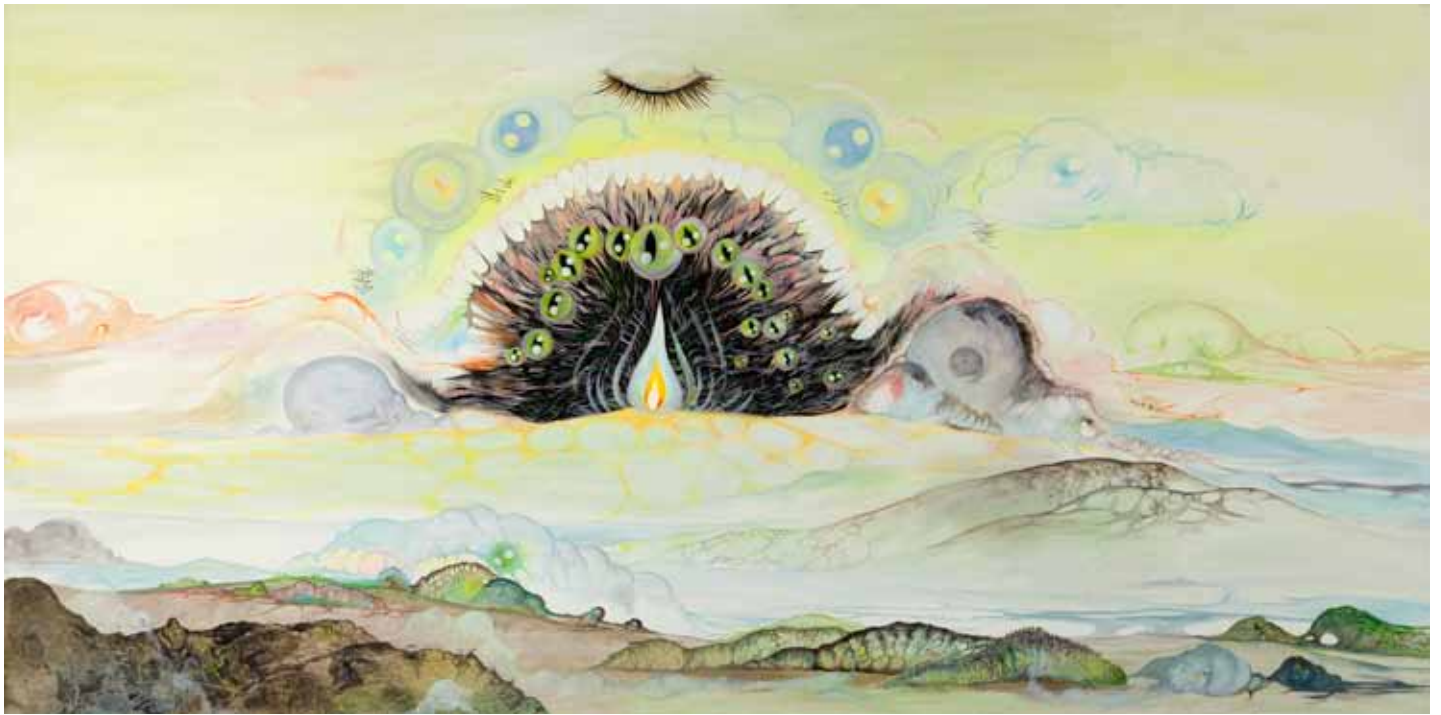
Playful Flame 2012 Acrylique et huile sur toile Acrylic and oil on canvas 90 x 180 cm