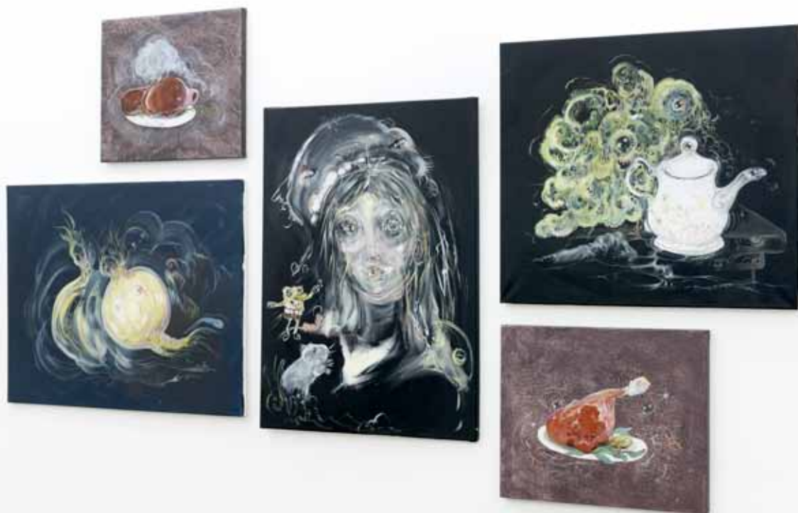
vue de l'exposition I'm in Love with the New World , Art:Concept, Paris, du 12 janvier au 16 février 2013 exhibition view I'm in Love with the New World , Art:Concept, Paris, from January 12th to February 16th 2013