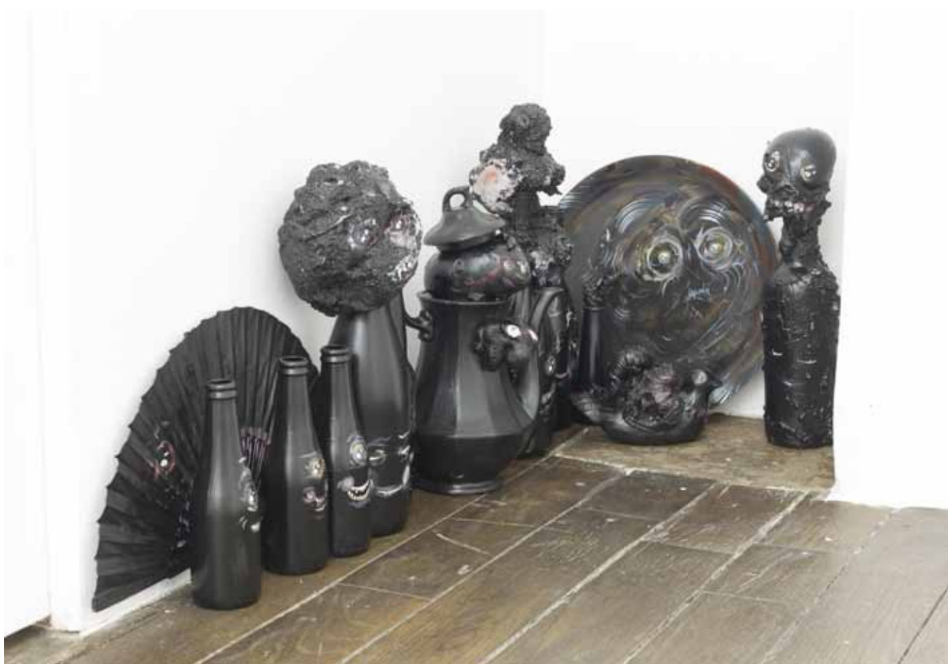
Les invités (après) , 2013, 13 objets peints à l'acrylique, dimensions variables Les invités (après) , 2013, 13 objects painted with acrylic, dimensions variable