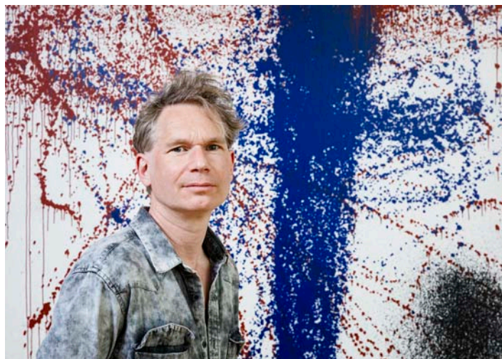
Portrait d'Abraham Poincheval devant une œuvre de Hans Hartung T1987-H15 , 1987, Acrylique sur toile, 154 x 195 cm. © Hartung / ADAGP, Paris 2021. © Poincheval / ADAGP, Paris 2021 / Courtesy Semiose

Abraham Poincheval (born in 1972) has become known for works that test his psychic and corporeal limits over a very long time—up to a week—in cramped places, notably Pierre at the Palais de Tokyo in 2017. Abraham Poincheval admires the work of Hans Hartung immensely and, he has said, the hallucinations provoked by some of his experiences of isolation are evocative of the Franco-German artist's paintings from the 1970s and 1980s. The Hartung-Bergman Foundation, in collaboration with Semiose gallery and Perrotin, has invited Abraham Poincheval to remain in a unique sculptural chamber, mimetic of his own silhouette, in which a single work by Hans Hartung sits in his line of vision. He will look at it continuously, for seven entire days. The artist will not know which work it is until the performance.