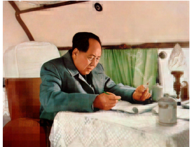
Thomas Ruff, tableau chinois_06 , 2019 © Thomas Ruff/VG Bild Kunst, Bonn/Artists Rights Society (ARS), New York Courtesy the artist and David Zwirner

14 January–6 March 2021 108, rue Vieille du Temple 75003 Paris